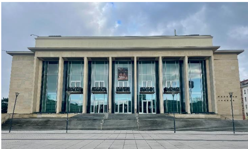
Obrázek 10: Janáčkovo divadlo

V budově Janáčkova divadla se hrají především opery a balety, kromě nich zde vystupuje také brněnská filharmonie. V roce 2016 byly prostory před divadlem zrekonstruovány a byla zde zbudována moderní fontána připomínající oponu (Biler, 2020).