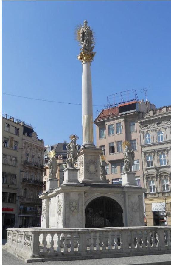
Obrázek 7: Mariánský sloup