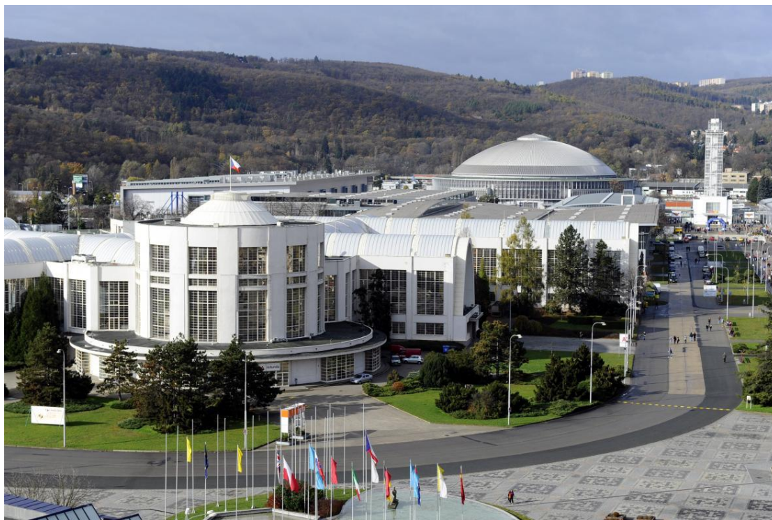
Obrázek 12: Brněnské výstaviště

Na výstavišti se konají různé akce, mezi nimiž je nejvýznamnější Mezinárodní strojírenský veletrh, který se koná každoročně na podzim (Biler, 2020).