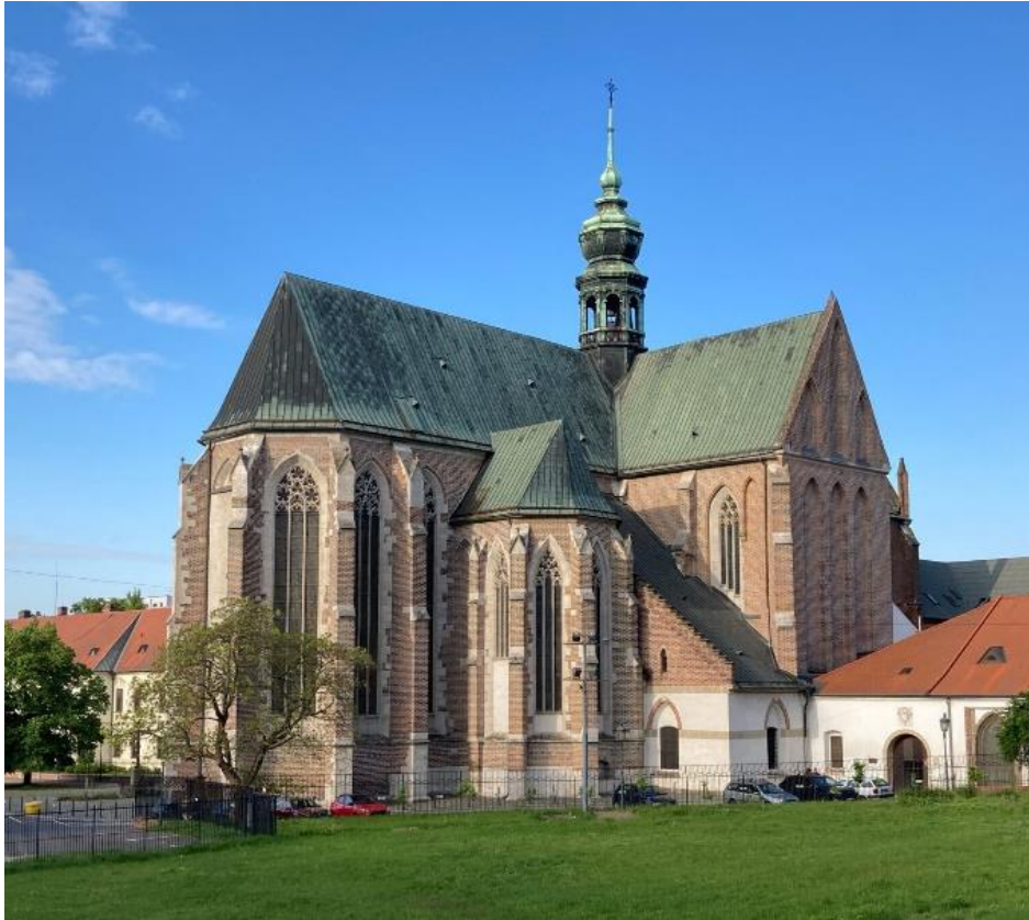
Obrázek 11: Bazilika Nanebevzetí Panny Marie