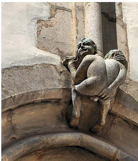
Obrázek 8: Socha neslušného mužička