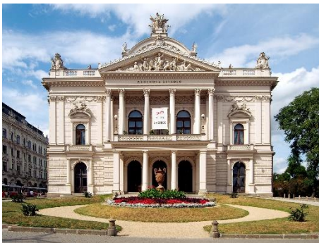
Mahenovo divadlo/Národní divadlo Brno