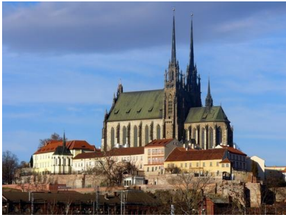
Petrov/Katedrála sv. Petra a Pavla

20. Pojmenuj památku, stavbu či místo na obrázku: