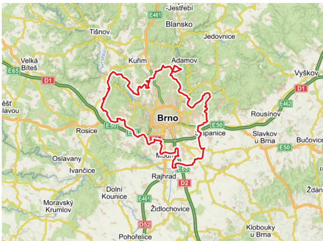
Obrázek 1: Poloha Brna