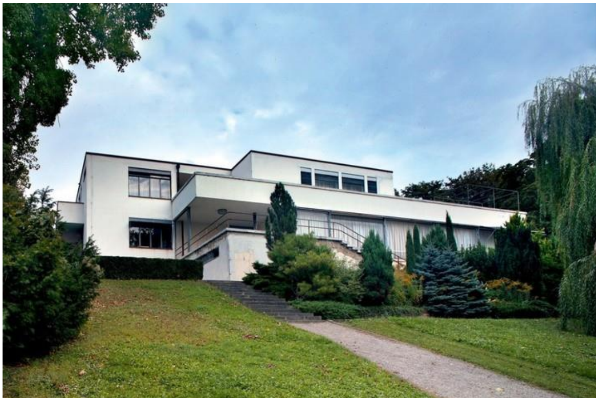
Obrázek 13: Vila Tugendhat

Vila je volně stojící budova, která je umístěna do svažitého terénu. Je rozdělena do tří podlaží. V prvním z nich je vybudováno technické zázemí, v druhém se rozprostírá hlavní společenský prostor, kuchyně, pokoje pro personál a prostorná zimní zahrada. Ve třetím, nejvýše položeném podlaží, se nachází hlavní vstup do budovy, pokoje pro rodiče i děti a rozsáhlá prostorná terasa. Ve vile je použito nejmodernější technické vybavení dané doby, například systém vytápění, elektromotorické spouštění oken či fotobuňka u vstupních dveří. Konstrukce je tvořena ocelovým skeletem, stropy jsou železobetonové a zdivo cihlové. Podlahu terasy tvoří travertin. Obytná hala je přepažena onyxovou stěnou, na níž navazuje půlkruhová stěna z černého ebenu. Prostory lze dále rozdělit bílými a černými závěsy z hedvábí a sametu. Pracovna s knihovnou, ke které přiléhá zimní zahrada, se nacházela za onyxovou stěnou. Před onyxovou stěnou je umístěno posezení s výhledem na zahradu. Většina nábytku pocházela z Německa a byla vyrobena z trubkové nebo pásové oceli a z ušlechtilého dřeva. Nábytek, který byl vestavěný, pocházel z brněnské firmy architekta Jana Vaňka. Vnitřní prostor je se zahradou propojen díky velkým okenním tabulím, které lze spustit do suterénu. Takto byla zahrada s několika samostatnými stromy a zatravněnou plochou neoddělitelnou součástí domu (Sedlák, 2006). V roce 2001 byla vila zapsána do Seznamu světového kulturního dědictví UNESCO (Tučka a Menšíková, 2008).