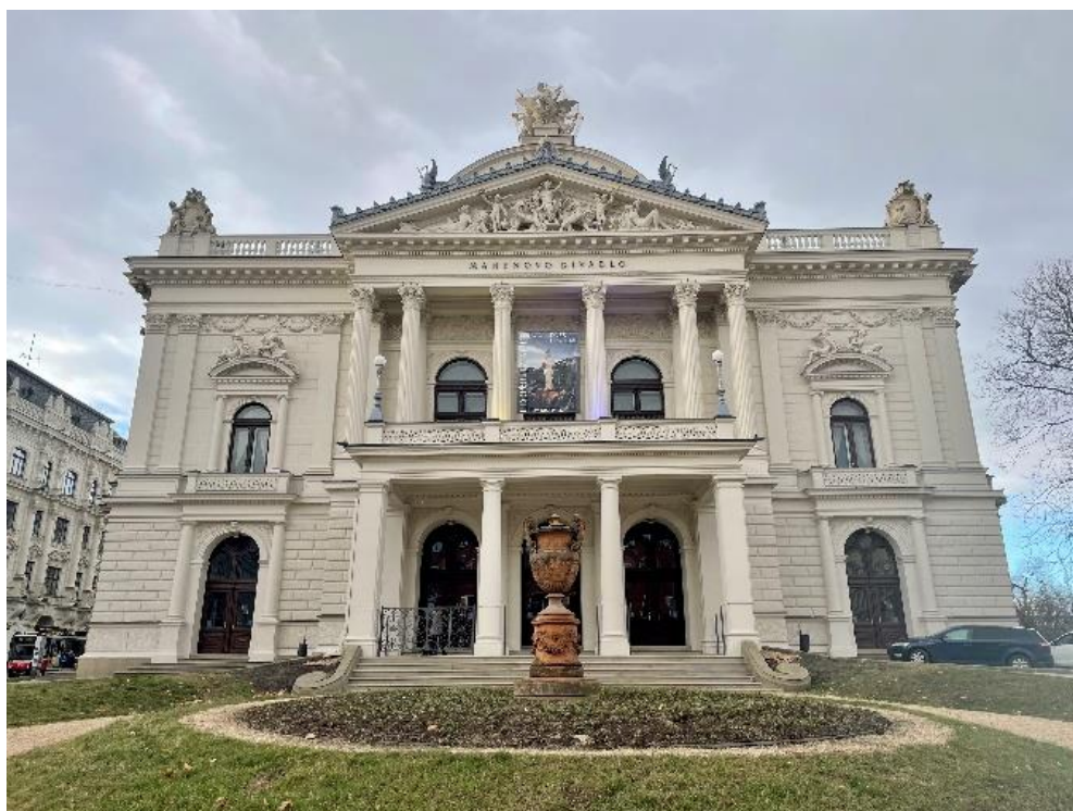
Obrázek 9: Mahenovo divadlo

Mahenovo divadlo stojí v místě, kde byly zbořeny původní městské hradby. Mělo se stát součástí okružní třídy, která se začala nově budovat. Za divadlem je tak dodnes zachován park, který se rozprostírá až na Moravské náměstí. Je jím odděleno centrum Brna od městského okruhu Koliště. V parku se nachází replika funkcionalistické Zemanovy kavárny od architekta Bohuslava Fuchse (Biler, 2020).