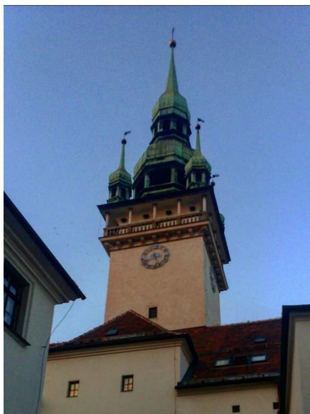
Obrázek 6: Věž Staré radnice

draka udělají hon. Když ho uviděli, zalekli se a utekli. Na radnici si lámali hlavu, co s drakem udělají. Nakonec po městě vyhlásili, že kdo draka zabije, dostane sto zlatáků. Dlouhou dobu trvalo, než se našel odvážlivec, který by s drakem bojoval. Jednoho dne do města přišel vychytralý řezník, kterému se odměna zalíbila. Požádal občany o čerstvou kůži z vola a pytel syrového vápna. Řezník zašil pytel s vápnem do kůže a odvezl jej na místo, kde drak sídlil. Vylezl na strom a pozoroval, co se bude dít. Drak ucítil kořist a celou ji sežral. Jelikož dostal žízeň, odplazil se k řece a pil. Po chvíli se v něm začalo vápno hasit, břicho se mu nadmulo a bylo po drakovi. Brňané se radovali a řezník dostal svoji odměnu. Na památku si měšťané draka pověsili do průjezdu Staré radnice (Šrámková a Sirovátka, 1991).