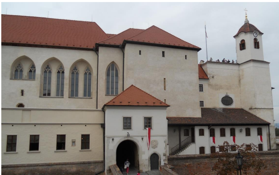
Obrázek 3: Hrad Špilberk