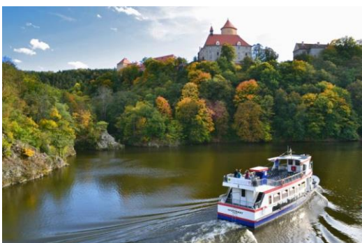
Brněnská přehrada/Hrad Veveří