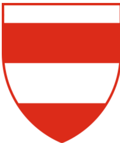
Obrázek 2: Znak města Brna

Znak Brna představuje gotický štít se čtyřmi stříbrno – červenými pruhy. Ke vzhledu štítu neexistuje žádná pověst ani legenda. Domníváme se však, že pruhy symbolizují řeky Svratku a Svitavu, kdy širší pruh je Svratka a užší Svitava. Červené pruhy pak představují těmito řekami rozdělené město (Eliášek, 2016).