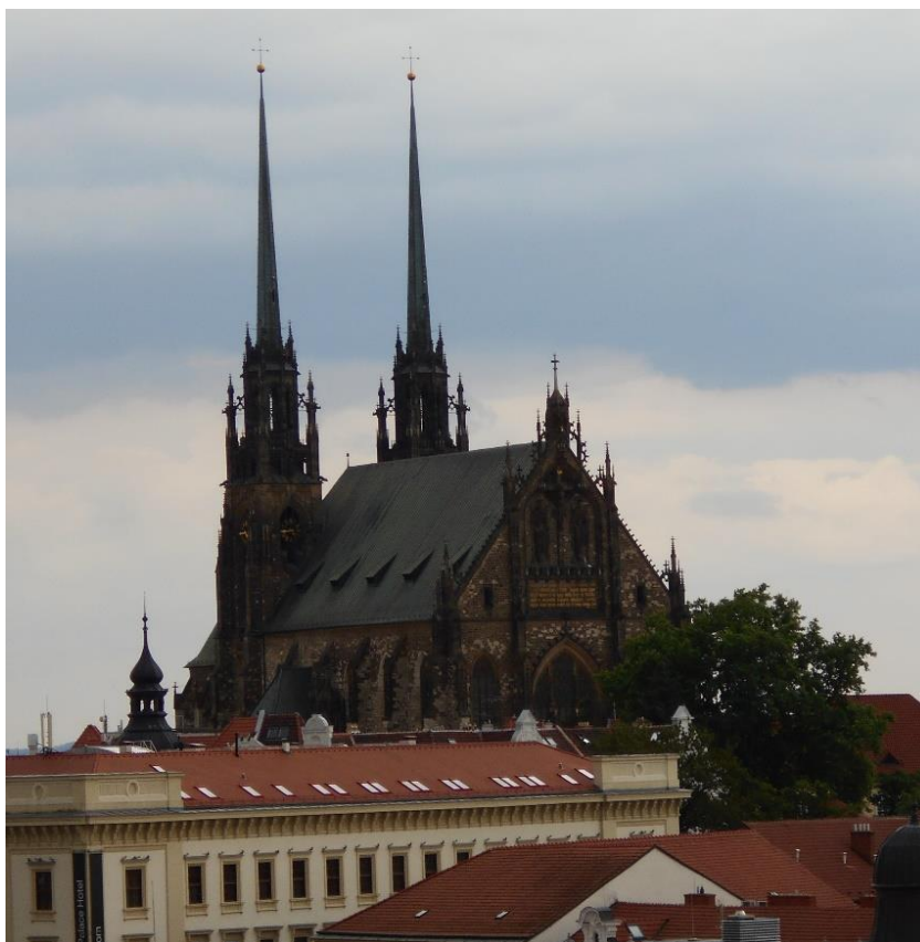
Obrázek 4: Katedrála sv. Petra a Pavla