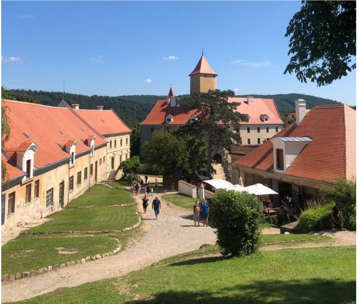
Obrázek 14: Hrad Veveří