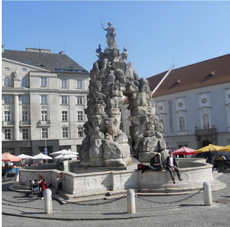
Obrázek 5: Kašna Parnas