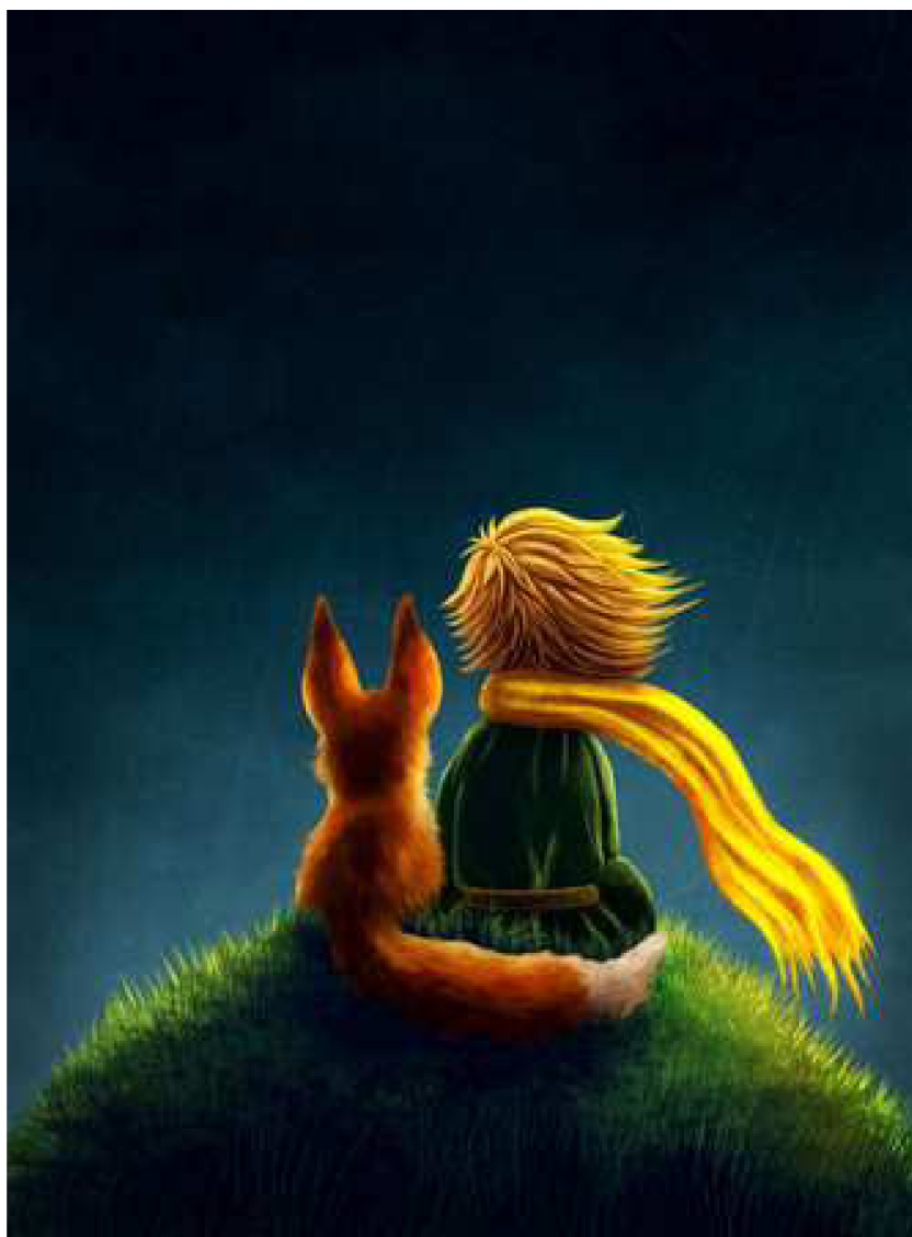
Obrázek 1 MALY PRINC