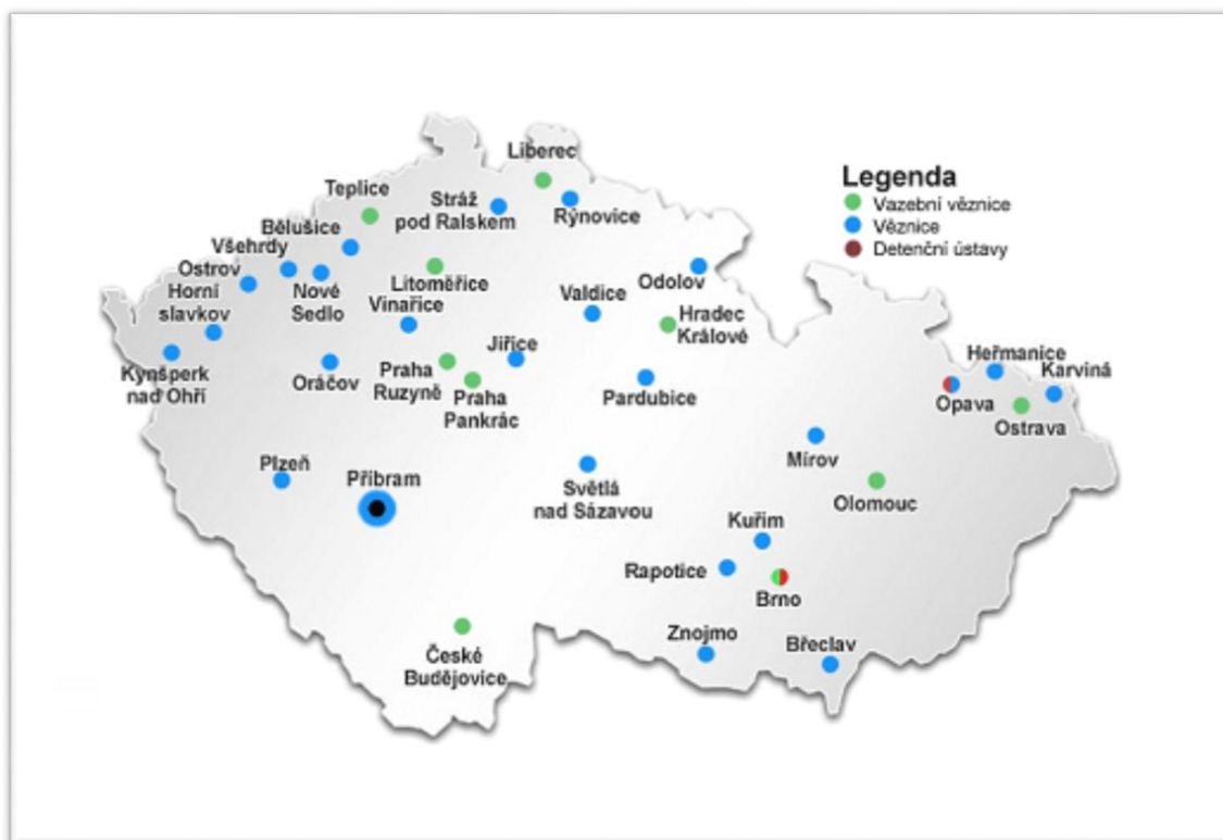
Obrázek 1: Vězeňská zařízení v České Republice, zdroj: Vězeňská služba ČR

Vedle základních typů věznic se zřizují zvláštní věznice pro mladistvé, nebo se vytváří v oddělených částech daných věznic oddělení pro mladistvé. V rámci jedné věznice mohou být zřízena oddělení různých typů, ale nesmí tím být ohrožen výkon trestu. 9