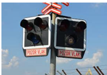
Obrázek 3: Světelné signalizační zařízení, které může být doplněno signalizačním zařízením