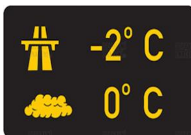
Obrázek 5: Zařízení pro provozní informace