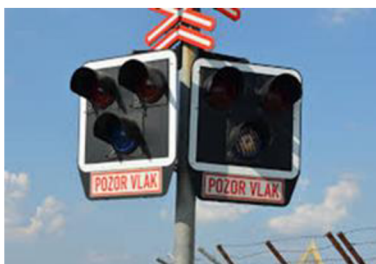
Obrázek 3: Světelné signalizační zařízení, které může být doplněno signalizačním zařízením