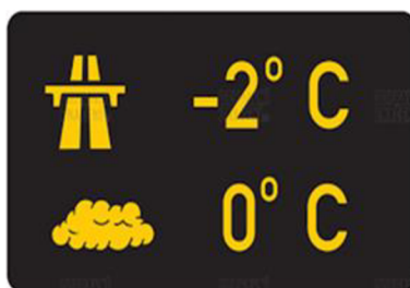
Obrázek 5: Zařízení pro provozní informace