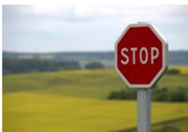
Obrázek 4: Dopravní značka