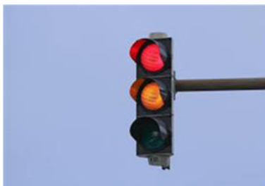
Obrázek 2: Světelné signalizační zařízení