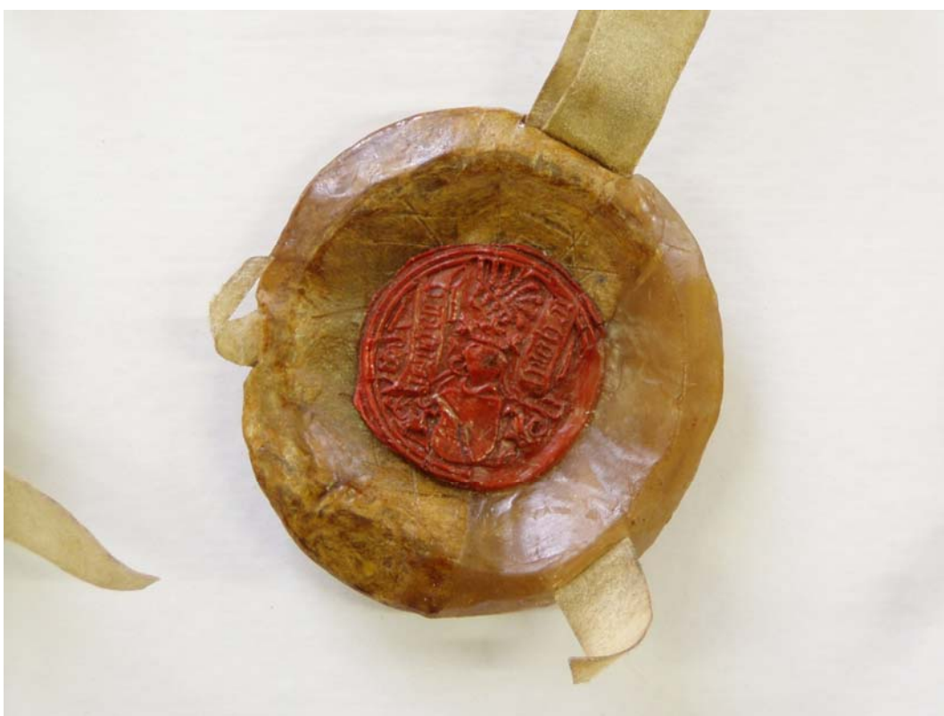
Obr. č. 6