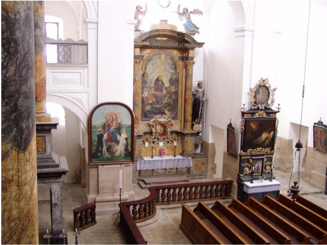
Obr. č. 12