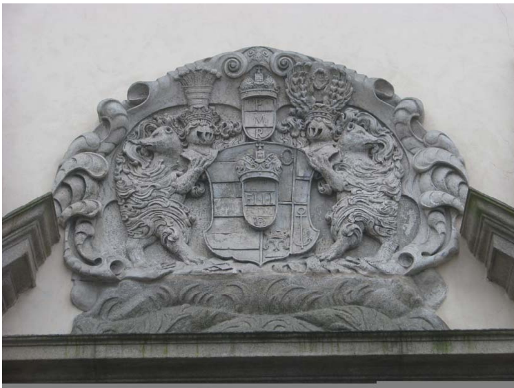
Obr. č. 14