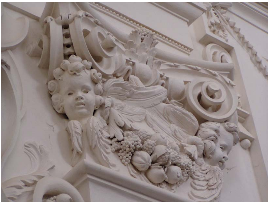
Obr. č. 10