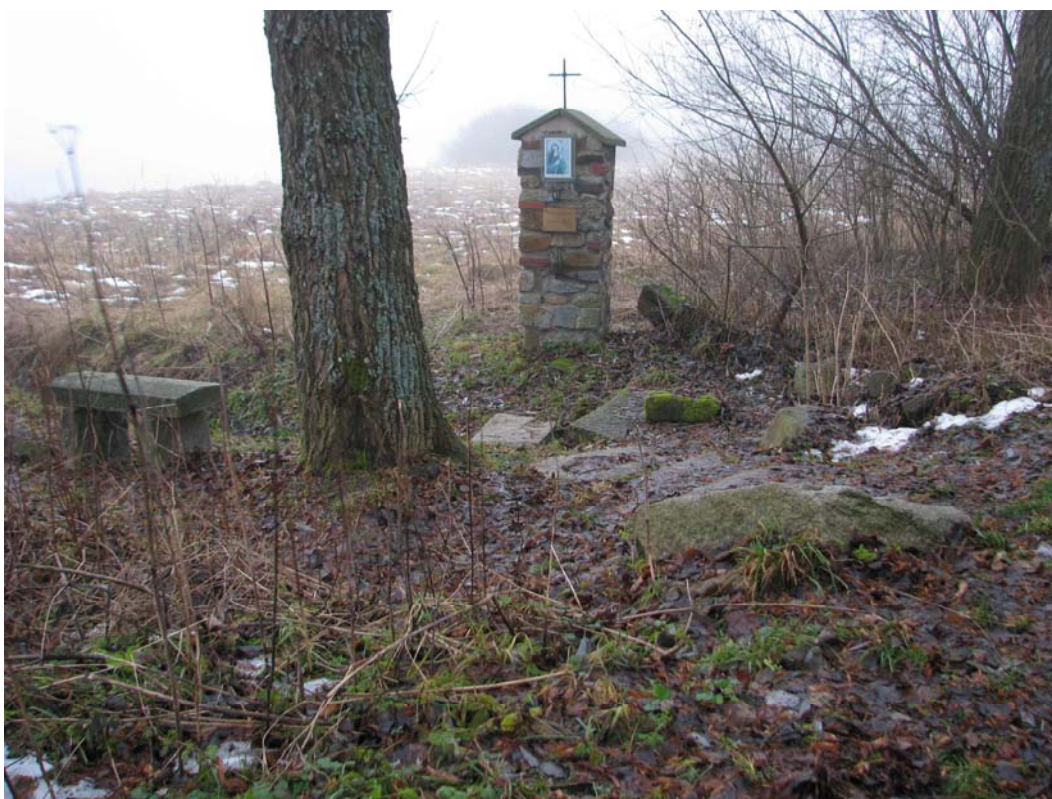
Obr. č. 15