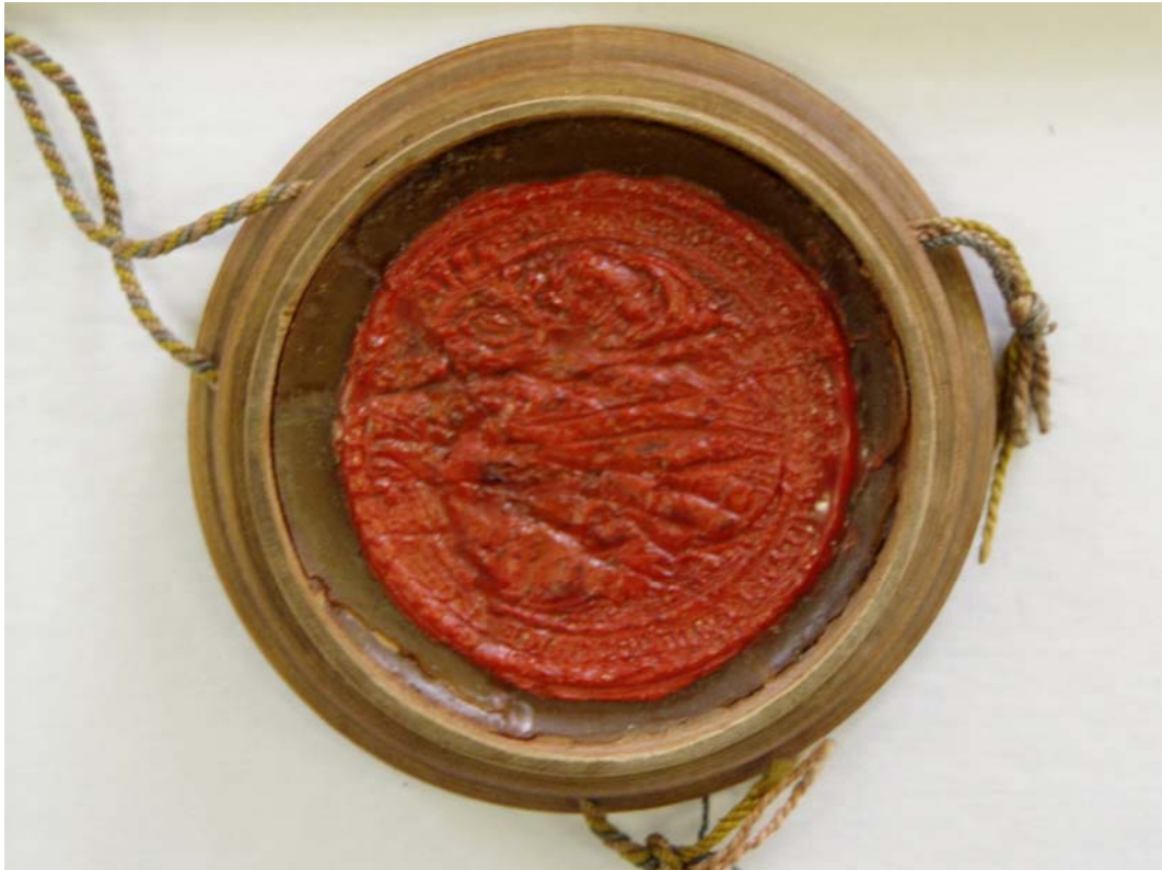
Obr. č. 7