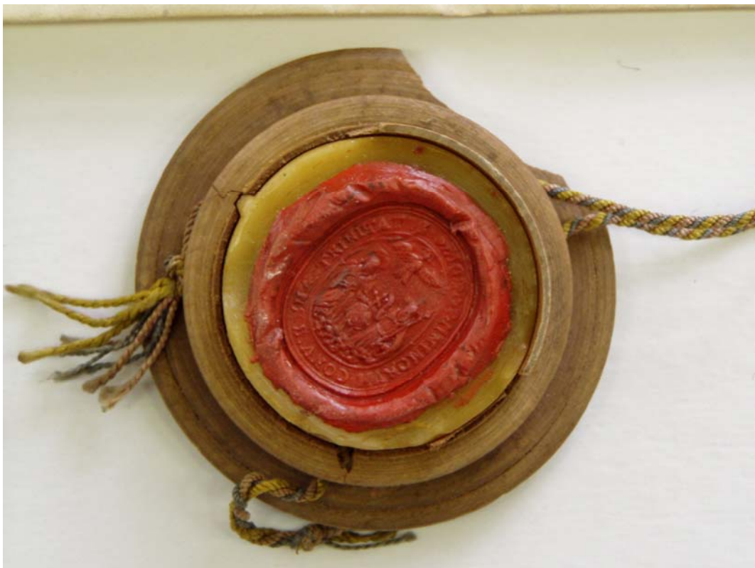
Obr. č. 8