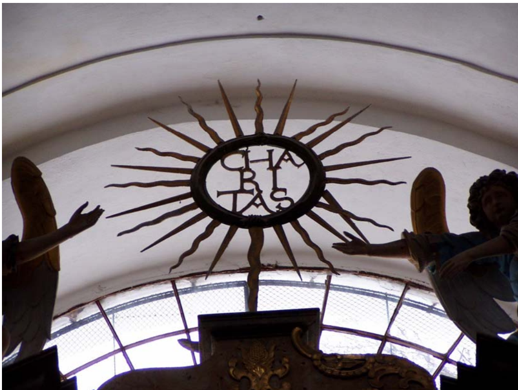
Obr. č. 13