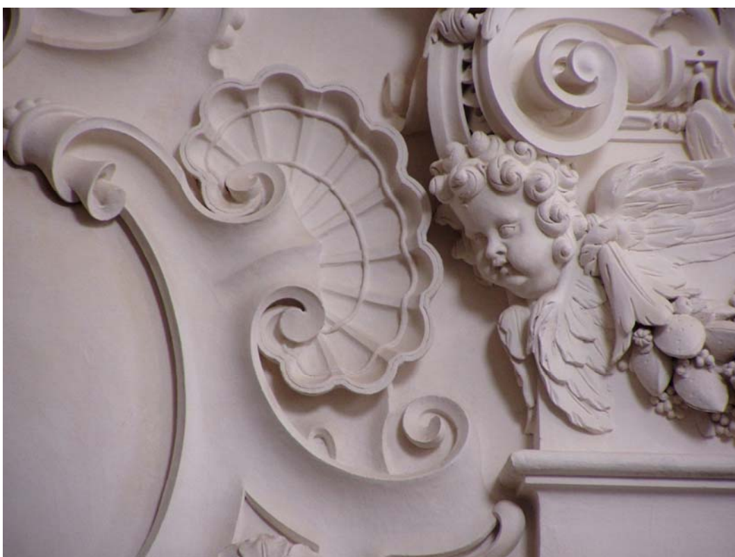
Obr. č. 11