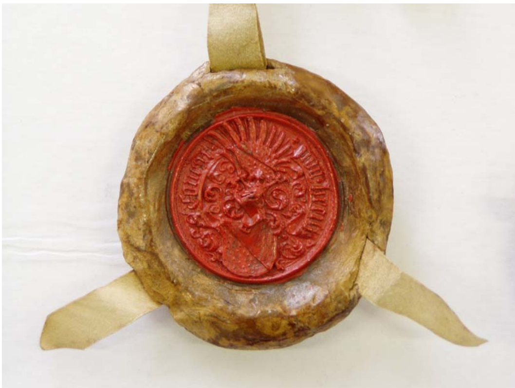
Obr. č. 5