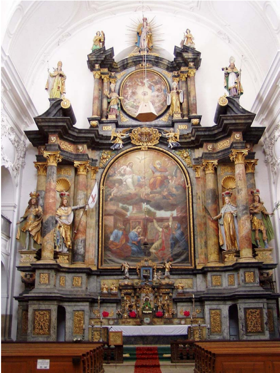
Obr. č. 9