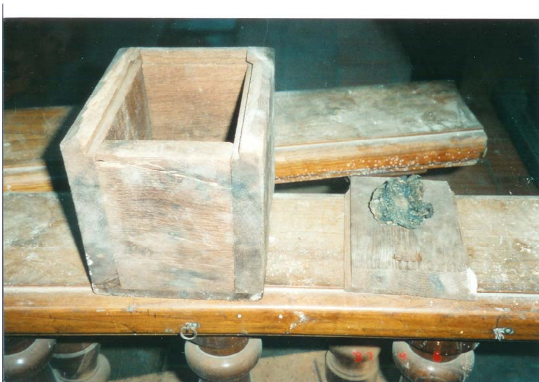
Obr. č. 17