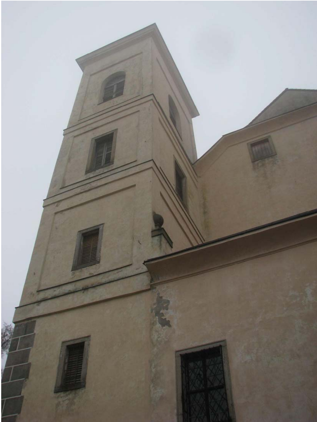
Obr. č. 16