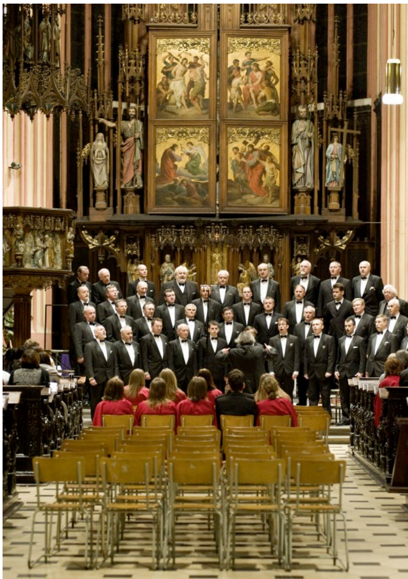
SPEVÁCKY ZBOR SLOVENSKÝCH UČITEĽOV, 2010.