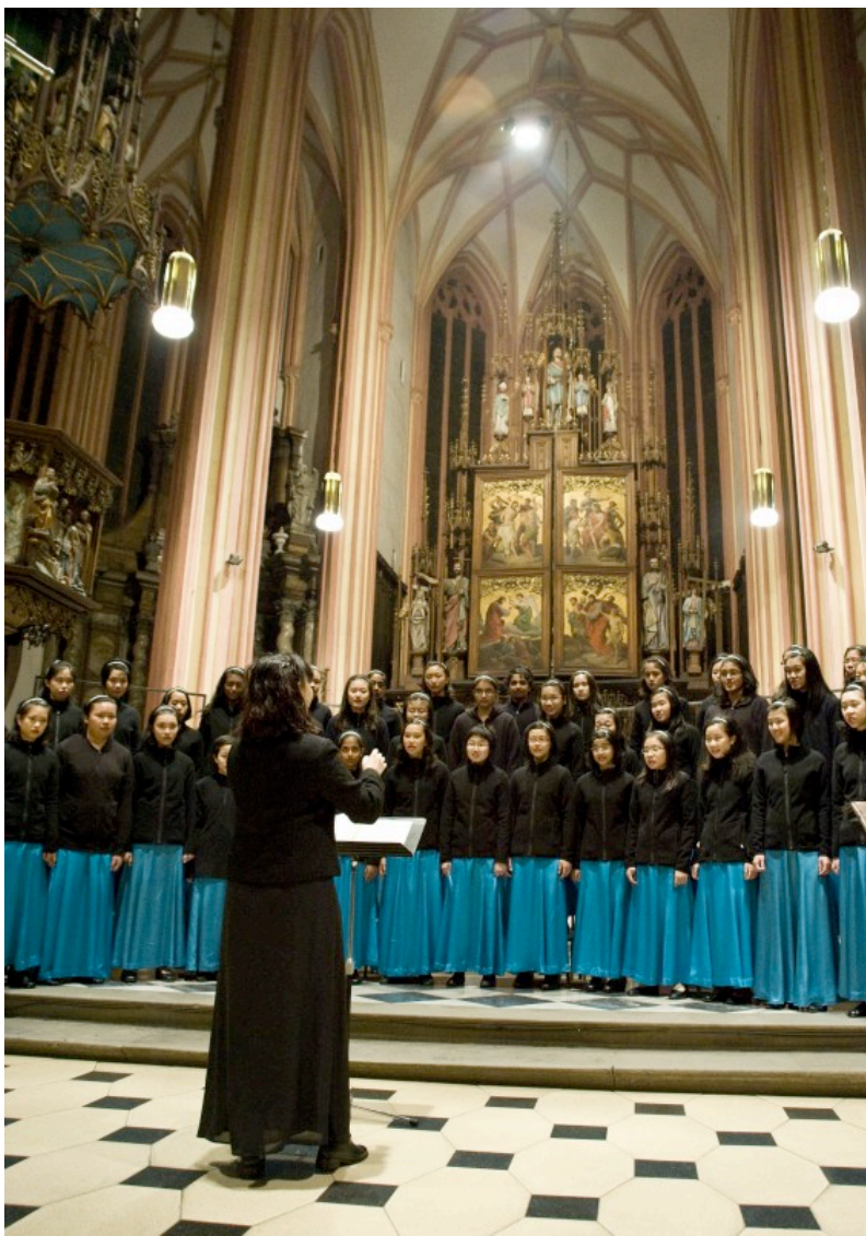
THE CEDAR GIRLS' SECONDARY SCHOOL CHOIR Singapur, 2010.