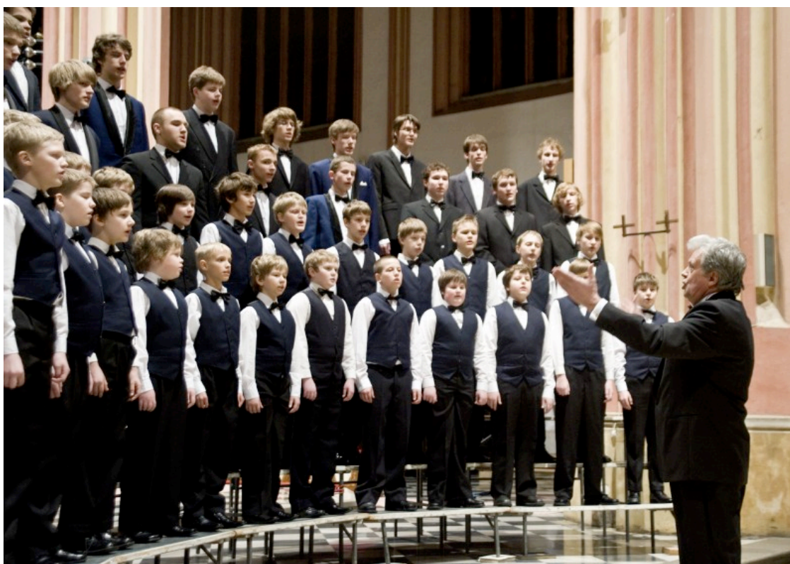
TARTU BOYS'CHOIR Estonsko, 2010.