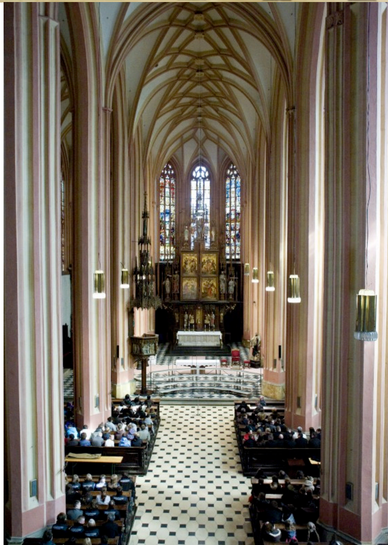
CHRÁM SV. MOŘICE, 2009.