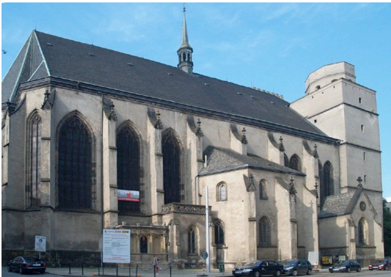
CHRÁM SV. MOŘICE, 2009