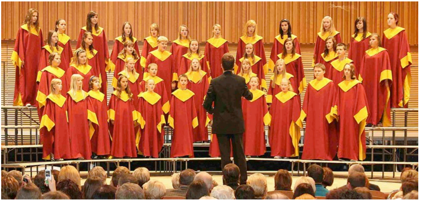
CAMPANELLA OLOMOUC, 2011.