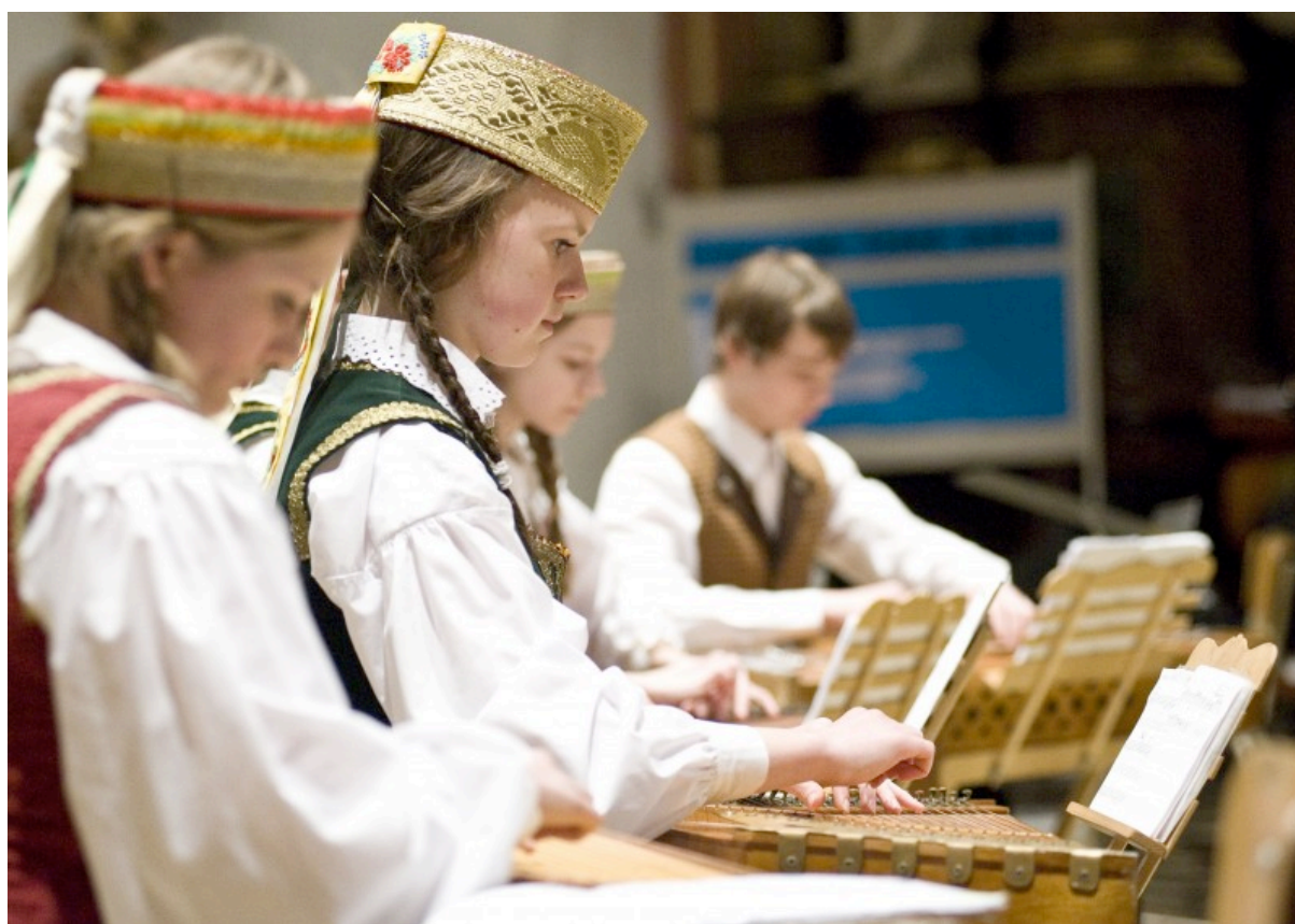
CHILDREN'S CHOIR OF VILNIUS MUSIC SCHOOL LYRA Litva, 2010.