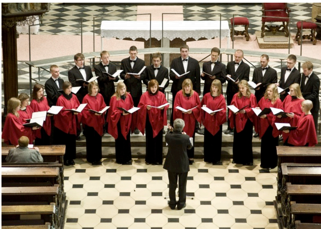
RESONANAS CON TUTTI ZABRZE Polsko, 2010.