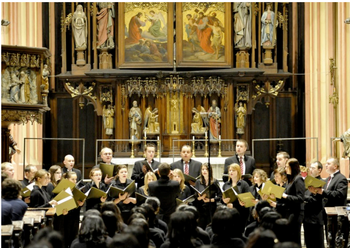
CHÓR KAMERALNY CANTO WYRZYSK Polsko, 2010.