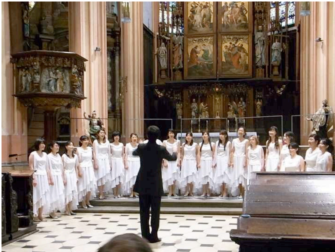
VOCES FIDELIS TOKYO Japan