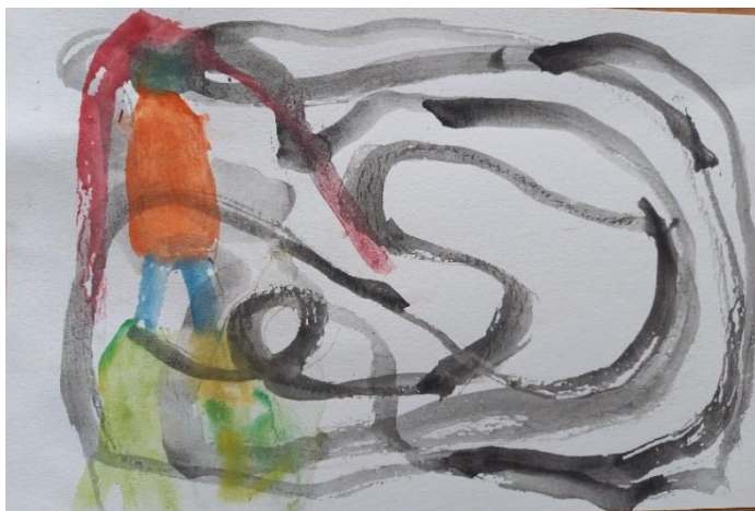
Obrázek č. 3 Krasobruslařka (A4, vodovky); Věk: 5;9 let; březen

Požádala jsem Lauru o ztvárnění své rodiny a Laura namalovala obrázek č. 4 . Je to zážitek ze setkání několik dní před kreslením, v období předvelikonoční atmosféry.