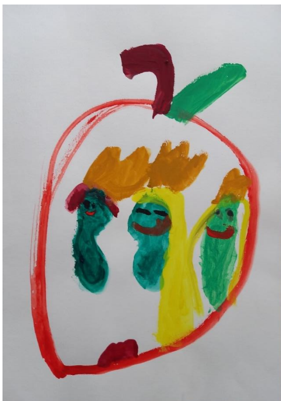
Obrázky č. 17: Červíková rodina v jablku (A3; tempere); Věk 6 let; červen

Požádala jsem Lauru, aby mi na obrázek č. 18 nakreslila něco ze školky, do které brzy přestane chodit.