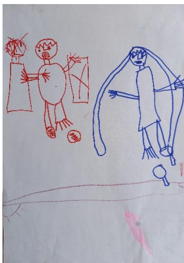
Obrázek č. 7 „Skica kluka a holky“ (A4; fixy) Věk: 5;10 let; duben

Kluci nemají boty a postavám schází prsty. Během tvoření jsem na to Lauru upozornila, a tak mi nakreslila na jiný papír skicu ( obrázek č. 7 ), jak umí zobrazit kluky a holky. Na obrázku, který dnes dělá, je ale chce nakreslit bez bot, s jednodimenzionálními končetinami a bez prstů.