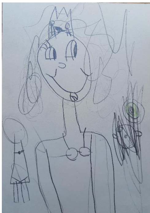
Obrázek č. 22, 23 Skicy mořské panny (A4, tužka); Věk: 6;2; srpen

Obrázek č. 22 , je skica, na které použila Laura pokročilejší zobrazování, jak v obličeji, tak těla. Řekla mi, že jí maminka naučila kreslit takový obličej. Mořskou pannu chtěla ztvárnit co nejlépe, a tak se rozhodla použít naučeného zobrazení od maminky. Snažila jsem se ji podpořit ke kreslení osobnějšího zobrazení jednotlivých částí obličeje. Chvíli jsme si prohlížely oči a nos v knize Anatomie pro výtvarníky 2 , zvláště jsme se zastavily na dvou stránkách, kde byly vykresleny jednotlivé typy očí, nosů a rtů v čínském zobrazování. Ještě na tomto papíru si začala zkoušet oči, které ale hned přeškrtnala. Na obrázku č. 23 pokračovala s experimentováním v zobrazení očí. A také si zkoušela, jak nakreslit tělo s ocasem.