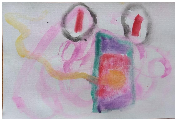
Obrázek č. 2: Koronavirus (A4, vodovky) Věk: 5;9 let; březen

Obrázek byl rychle hotový a Laura si chtěla ještě namalovat krasobruslačku. Vzpomněla si, jak si ve školce povídali o zimních sportech. Dívčí postava na obrázku č. 3 má na nohou brusle a černé linie jsou stopy po bruslích v ledu.