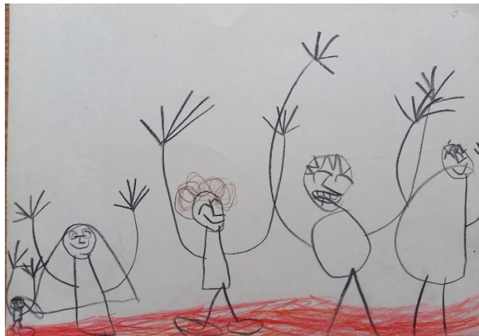
Obrázky 18: Ve školce I. (A4; pastelky); Věk 6 let; červen

Obrázek č. 19 nakreslila Laura poslední týden ve školce. Řekla mi: „ Takhle to tam přesně vypadá. Obrázek jsem kreslila podle skutečnosti. “ Razáková (1977) píše, že se děti na kreslený objekt můžou dívat, ale vůbec si ho nevšímají a dávají přednost kreslení z paměti, „ v kresbě zdůrazňují a uplatňují to, o co mají zájem a co se jim pro kresbu zdá závažné. “ (Razáková, 1977, s. 9)