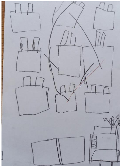
Obrázek č. 27: Ve škole (A4; tužka); Věk: 6,4 let; říjen

Obrázek č. 27 vznikl spontánně, když byly u mě Laura s maminkou na návštěvě. Laura si kreslila sama během toho, kdy jsme si s Lauřinou maminkou povídaly.