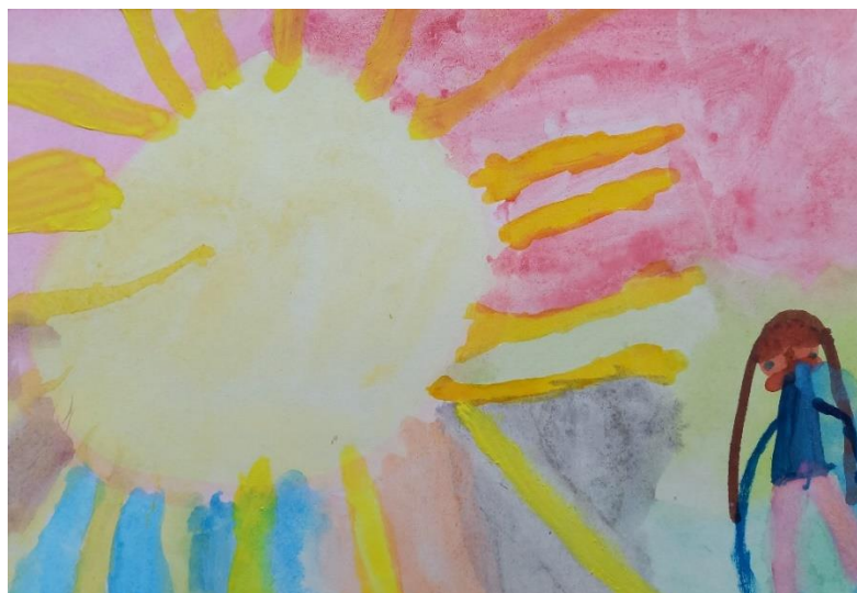
Obrázek č. 12 „Slunce a holčička“ (A4, vodovky, tuž, tempera); Věk 5, 11. květen

Paprsek na levé straně slunečního kotouče, který by nebyl vidět, kdyby vycházel směrem ven, nesměrovala Laura dovnitř. Tím vznikla v obrázku náhodně hloubka v prostoru, ve kterém se slunce otáčí směrem k holčičce.