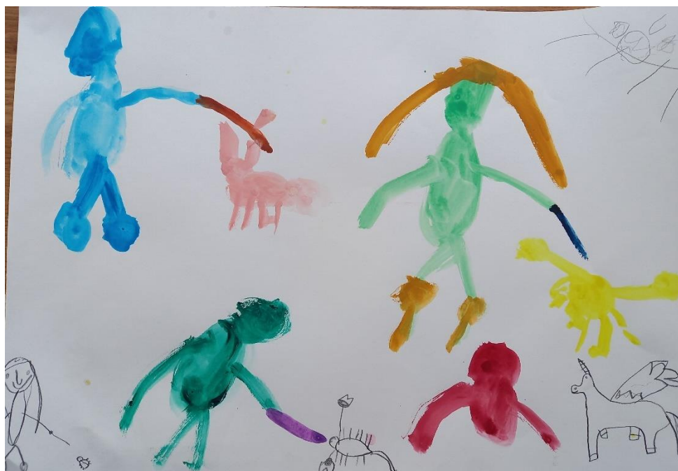
Obrázek 22 Začarovaná rodina (A3, tempera, tužka); Věk 6;1 červenec