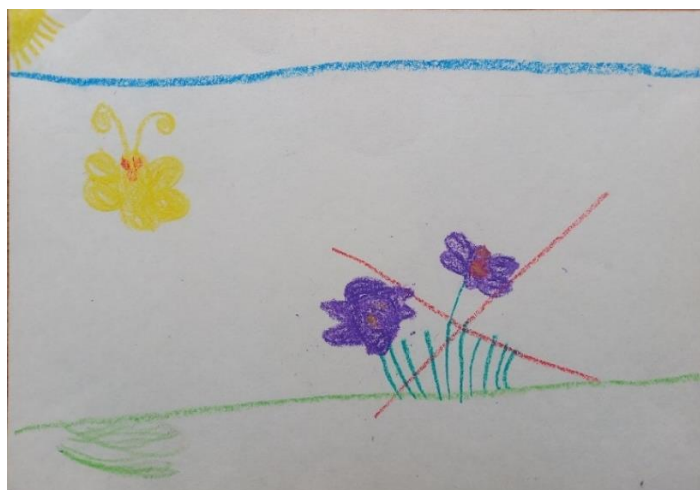
Obrázek č. 5 Žlutý motýl s fialkami (A4; voskovky); Věk 5;10 let; duben

Nové setkání proběhlo několik dnů po kresbě nezdařeného obrázku. Pobídla jsem ji, aby nakreslila něco jiného ze setkání s kluky, ze kterého měla takovou radost. Laura souhlasila a začala kreslit obrázek č. 6 , jak hráli na hřišti fotbal.