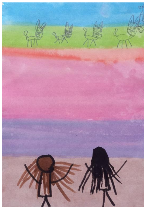
Obrázek č. 21: Bela jde do školy (A4, tuž, tužka); Věk: 6;1 let; červenec

Téma obrázku č. 22 je začarovaná rodina. Požádala jsem Lauru, aby malovala temperovými barvami. Řekla jsem jí, že si může představit, jak jednotlivé členy rodiny (tátu, mámu a Lauru) začaroval čaroděj do podoby zvířat. Na papír má potom namalovat proměněná zvířata.