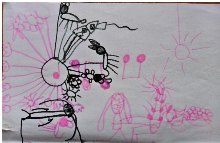
Obrázek č. 9 a obrázek č. 10: Narozeninové obrázky (A4; fixy) není datováno

Na základě těchto dvou výkresů mě oslovilo přísloví „v jednoduchosti je síla“. Laura si v kresbě zpracovávala těžká období a šlo o kresbu v obrysech. Mé další směřování v práci s Laurou tedy bude: Pokud bude chtít nechat obrázek pouze s obrysy, tak jí nebudu motivovat k vybarvení jednotlivých postav a objektů. Ukončení obrázku nechám v tomto ohledu na ní. Není vždy potřeba směřovat k náročnějším provedením.