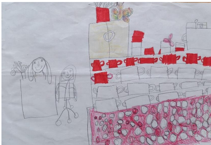
Obrázek č. 19: Ve školce II. (A4; pastelky, fixy); Věk 6 let; červen