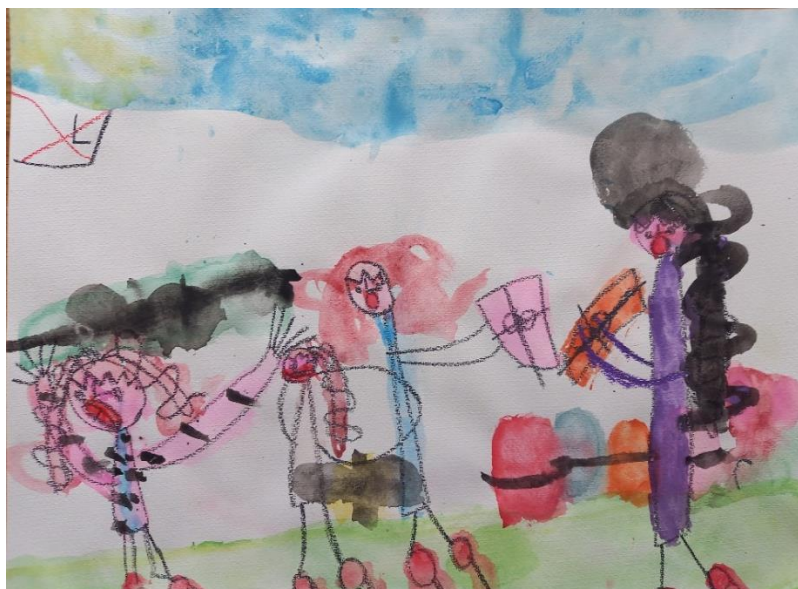
Obrázek č. 4 Moje rodina (A3; voskovka, vodové barvy); Věk: 5;11; duben

Laura strávila po měsíci a půl izolace doma pěkný den na hřišti se svými kamarády ze školky Honzíkem a Kubíkem. Obrázek č. 5 je pokus ztvárnit krásný zážitek z tohoto setkání. Na hřišti kvetly fialky a kolem nich létali dva žlutí motýli. Během tvoření ale zjistila, že se jí nevejdou uspořádat květy fialek na stonky, které si nakreslila předem a do květů nedokáže nakreslit žluté tůpky. Chtěla si vzít nový papír a začít od začátku.