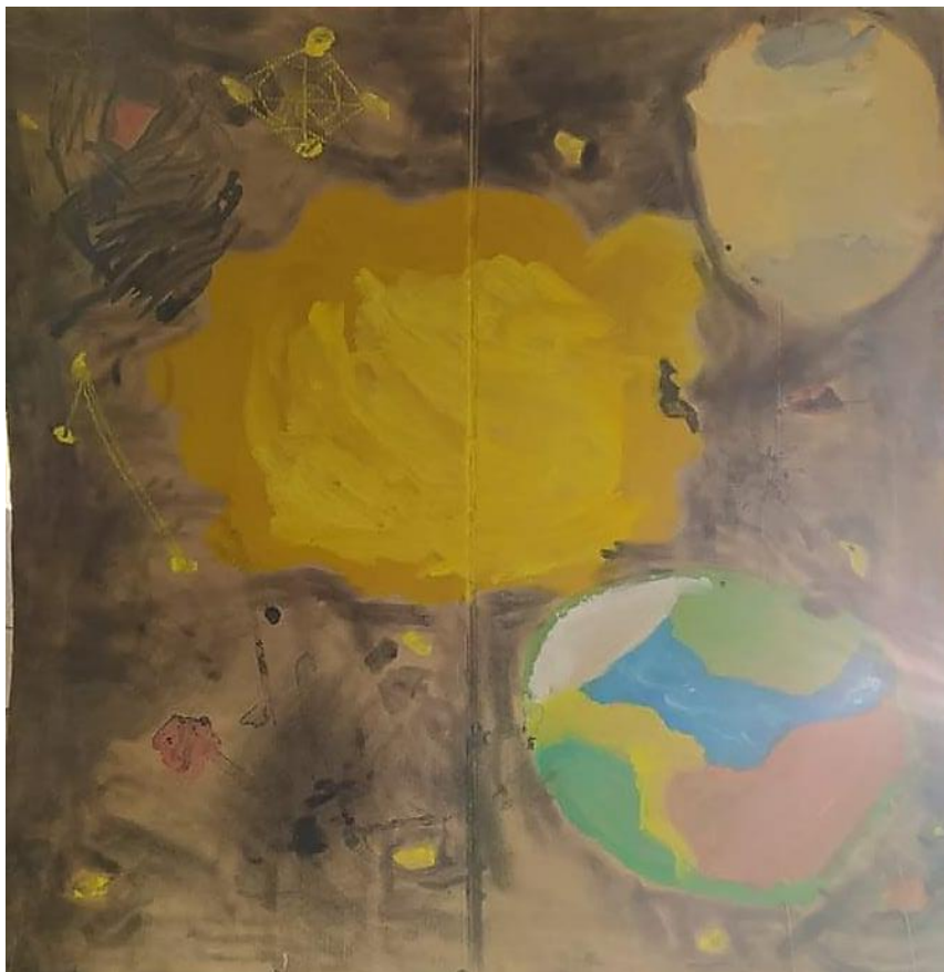
Obrázek č. 29 Vesmír (tempera, tuž, uhl, suchý pastel); Věk: 6;5 let listopad

Obrázkem č. 29 bych chtěla zakončit sběr artefaktů pro tuto případovou studii. V tomto obraze vidím naplnění naší metodické spolupráce v Laury životním období okolo vstupu do školy. S Laurou jsme spolu malovaly ještě další tři měsíce. K oficiálnímu ukončení našich setkávání nedošlo. Zatím byly pozastaveny na základ karantén a nemoci. Od září 2022 se s Laurou těšíme na další spolupráci.