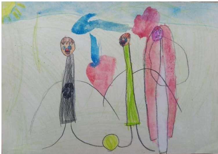
Obrázek č. 6: Sobota s Kubíkem a Honzíkem (A4; pastelky, vodovky); Věk: 5;10 let; duben

Kluci nemají boty a postavám schází prsty. Během tvoření jsem na to Lauru upozornila, a tak mi nakreslila na jiný papír skicu ( obrázek č. 7 ), jak umí zobrazit kluky a holky. Na obrázku, který dnes dělá, je ale chce nakreslit bez bot, s jednodimenzionálními končetinami a bez prstů.