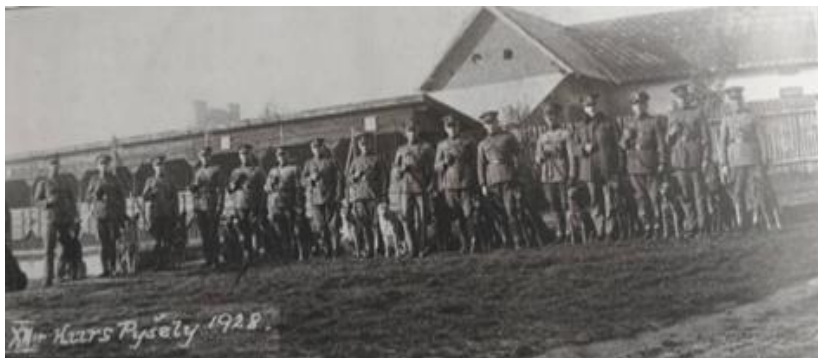
Obrázek 4- Výcvik služebních psů v Ústavu pro chov a výcvik služebních psů četnictva v Pyšelicích 48