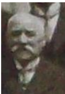
Hynek Gross, převzato a upraveno z: SOkA Český Krumlov, fond Čtenářské besedy v Českém Krumlově, písemná agenda, s označením S – 38.