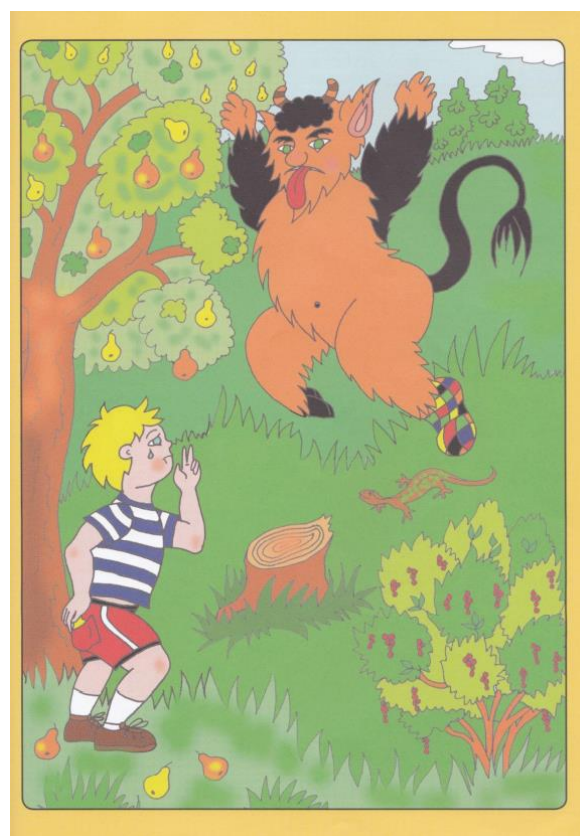
Obrázek 2: Nácvik hlásky R pomocí příběhu

Na tomto cvičení sledujeme několik oblastí. Nejprve se zaměříme na oblasti spojené se smyslovým poznáním, následně popíšeme jednotlivé jazykové či jiné roviny, které můžeme u cvičení sledovat.