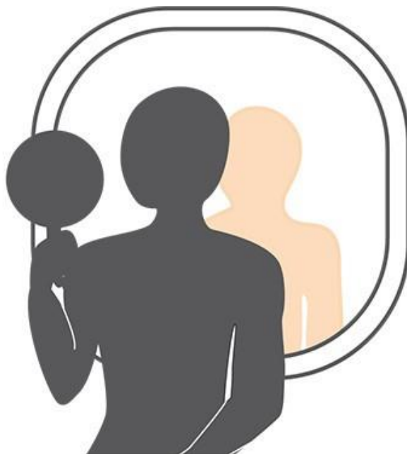
obr. 6: Samovyšetření kůže – krok 6