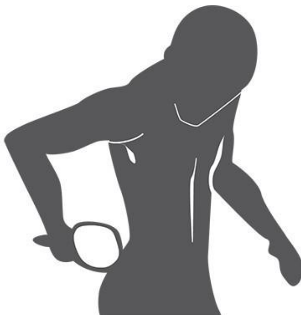
obr. 5: Samovyšetření kůže – krok 5