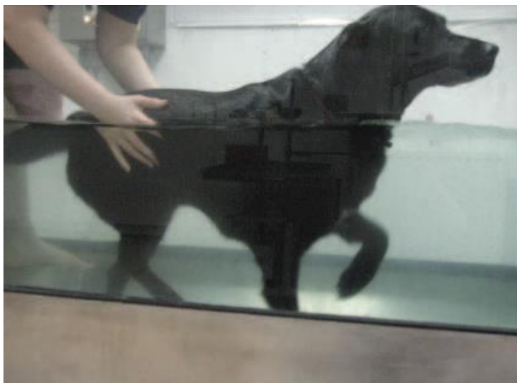
Obrázek V: Aquaterapie (Prankel 2008)

vyprazdňování se ve vodě, polykání velkého množství vody, dušení se, agresí či zvýšené únavě (Tomlinson 2012). Tento druh terapie se nedoporučuje u psů s teplotou, infekcí, epilepsií, srdečními či dýchacími poruchami, otevřeným zraněním nebo nedostatečně zhojenými chirurgickými ranami (McGowan et al. 2007). Dalšími kontraindikacemi jsou kožní onemocnění, průjem nebo celkové oslabení. Ke zvažení jsou též jedinci se strachem nebo nadměrnou úzkostí z vody a plavání (Prydie & Hewitt 2015). Psí aquaterapie je stále populárnější, jelikož stále více majitelů vyhledává alternativní terapie a metody rehabilitace, aby pomohli jejich mazlíčkům při zotavení a udržení zdraví (Waining et al. 2011).