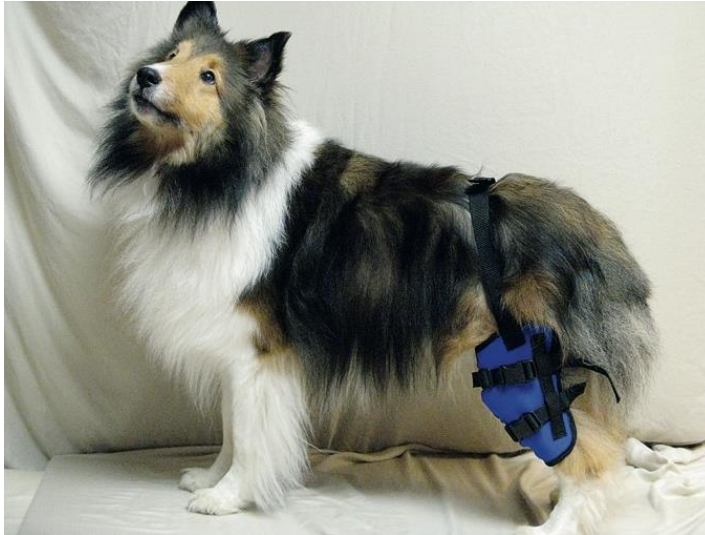
Obrázek IV: Jeden ze způsobů využití kryoterapie, kdy je studený zábal omotán kolem zadní končetiny psa (Millis & Levine 2014)