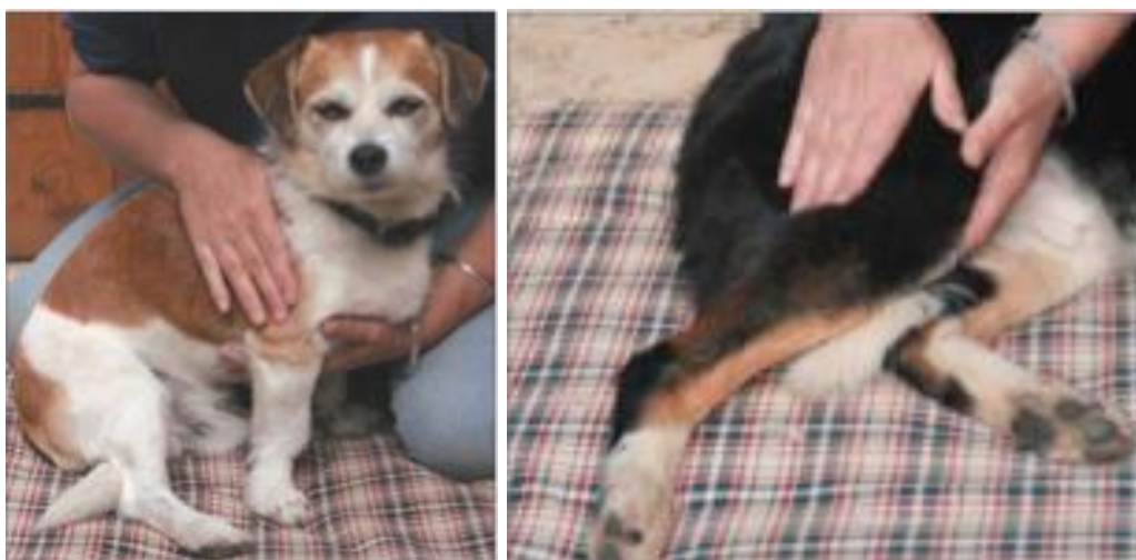
Obrázek I: Masáž psů (Robertson & Mead 2013)