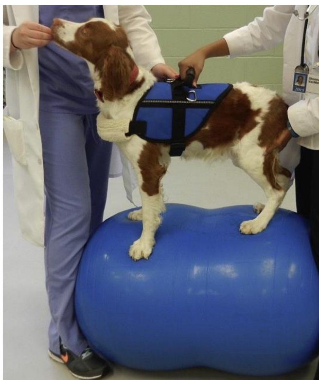
Obrázek II: Balanční cvičení na míči (Drum et al. 2015)

Balanční cvičení obsahují různé činnosti, které vyžadují rychlé reakce. Patří sem balanční podložky, trampolíny, hra s míčem a různé druhy cviků prováděných na speciálních balančních míčích. Psi s větší slabostí způsobené neurologickými či ortopedickými poruchami potřebují často pomoc při stání a chůzi v raných stádiích rekonvalescence jako jsou fyzioterapeutické válečky či závěsy (Sharp 2008). Je prokázáno, že balanční polštář podporuje nestabilitu v oblasti pánve a ramen, pokud je používán správně. Cílem této terapie je stimulace hlubokých svalů v pánevní nebo ramenní oblasti. Jejich tréninkem se napomáhá rozvoji k lepší rovnováze a držení těla (Robertson & Mead 2013). Trénink rovnováhy by měl simulovat různé a neočekávané situace, ke kterým dochází v běžných činnostech jedince (Maki & McIlroy 1996).