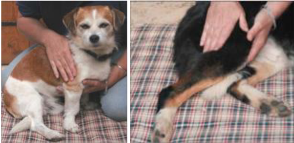
Obrázek I: Masáž psů (Robertson & Mead 2013)