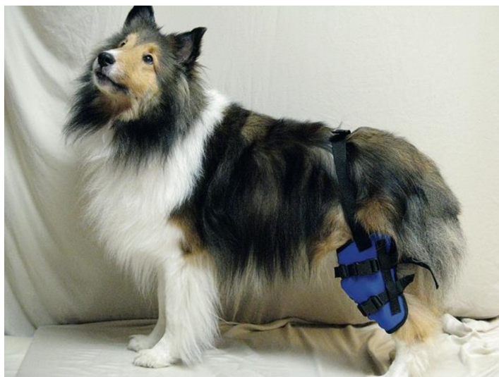
Obrázek IV: Jeden ze způsobů využití kryoterapie, kdy je studený zábal omotán kolem zadní končetiny psa (Millis & Levine 2014)