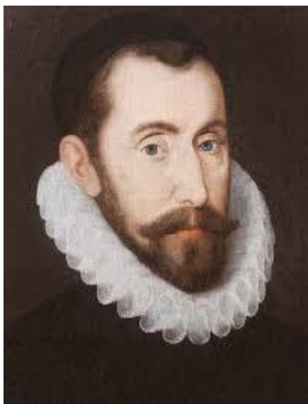
Obrázek 1: Francis Walsingham

Mnoho moderních metod špionáže bylo ustanoveno Francisem Walsinghamem v alžbětinské Anglii. Walsinghamův personál v Anglii zahrnoval kryptologa Thomase Phelippese, který byl odborníkem na luštění písmen a padělání a Arthura Gregoryho, který byl zručný při lámání a opravování pečetí bez jakékoliv detekce druhé strany. Od roku 1585 byla Marie Stuartovna v zajetí sira Amiasa Pauleta, jednoho z dalších agentů Francise Walsinghama, který měl za úkol získat všechny tajné korespondence Marie. Paulet Marii podvedl tím, že přes své agenty dal Marii důvod věřit, že cokoliv, co se od ní vynášelo tajně v pivním soudku, bylo v bezpečí. Marie byla podvedena, když si myslela, že její tajné dopisy byly v bezpečí, zatímco ve skutečnosti byly dešifrovány Walsinghamovými agenty. Podařilo se jim zachytit dopisy, které naznačovaly spiknutí s cílem sesadit Alžbětu I. 5