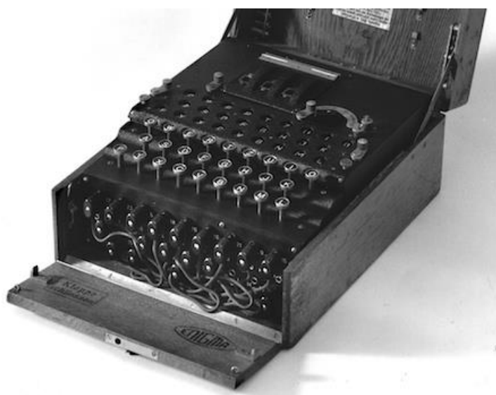
Obrázek 2: Šifrovací stroj Enigma

Enigma byl automatický stroj na šifrování a dešifrování zpráv. V posledních asi 30 letech si získal velkou mezinárodní publicitu, když vyšlo najevo, že spojenci kryptoanalytici za druhé světové války rozluštili německý tajný klíč. Mnozí britští a američtí historici se domnívají, že díky tomuto mimořádnému počínu spojeneckých tajných služeb, který se dařilo držet pod pokličkou až do sedmdesátých let minulého století, je možné, že byla druhá světová válka zkrácena až o dva roky než bývala mohla původně trvat.