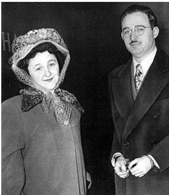
Obrázek 7: Julius a Ethel Rosenbergerovi

Julius a Ethel Rosenberg byli američtí komunisté, kteří byli popraveni za předávání jaderných tajemství Sovětskému svazu. Setkali se Komunistického svazu mládeže v roce 1936, kde byl Julius vedoucím. Julius byl rekrutován KGB v roce 1942 a byl považován za jednoho z nejlepších špiónů, jaké KGB měla. Přeposílal sovětům utajované informace, včetně takových, které později vedli k sestřelení amerického špionážního letounu U-2 v roce 1960.