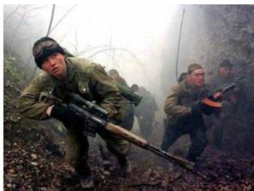
Obrázek 5: Specnaz GRU