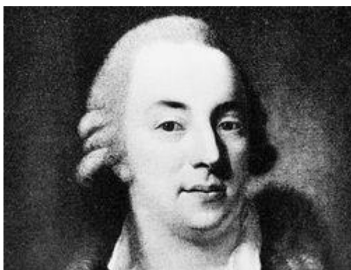
Obrázek 9: Giacomo Casanova

Posledním špiónem, kterému se budu v této kapitole věnovat, je Giacomo Casanova. Znám je především pro svou lásku k ženám a knize Dějiny mého života , která nám dává možná nejlepší obrázek o životě v 18. století, který dnes máme k dispozici. Díky finanční podpoře od své matky herečky mu bylo umožněno chodit do školy a získat velmi dobré vzdělání. To mu umožnilo aby se stal právníkem.