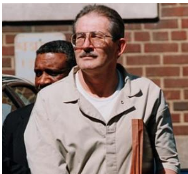
Obrázek 8: Aldrich Ames

Ames je bývalý důstojník CIA, který byl v roce 1995 odsouzen za špionáž pro Sovětský svaz. Při své první misi jakožto důstojník byl poslán do turecké Ankaty, kde bylo jeho úkolem lokalizovat sovětské důstojníky tajné služby a získat je na stranu USA. Kvůli finančním problémům v osobním životě způsobeným závislostí na alkoholu a mrháním peněz začal Ames plnit tajné úkoly ve službách Sovětského svazu v roce 1985, když vešel do sovětské ambasád ve WASHINGTONU aby nabídl tajemství za peníze.