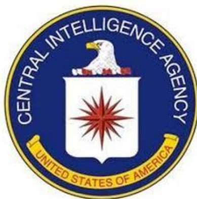
Obrázek 3: Znak CIA

Central Intelligence Agency (CIA, Ústřední zpravodajská služba ) je civilní, zahraniční zpravodajská služba vlády Spojených států amerických, která má za úkol shromažďování, zpracování a analýzu bezpečnostních otázek z celého světa. Jako jeden z hlavních členů americké zpravodajské služby je CIA podřízena řediteli Národní zpravodajské služby a je zaměřena především na poskytování zpravodajských služeb pro prezidenta a vládu.