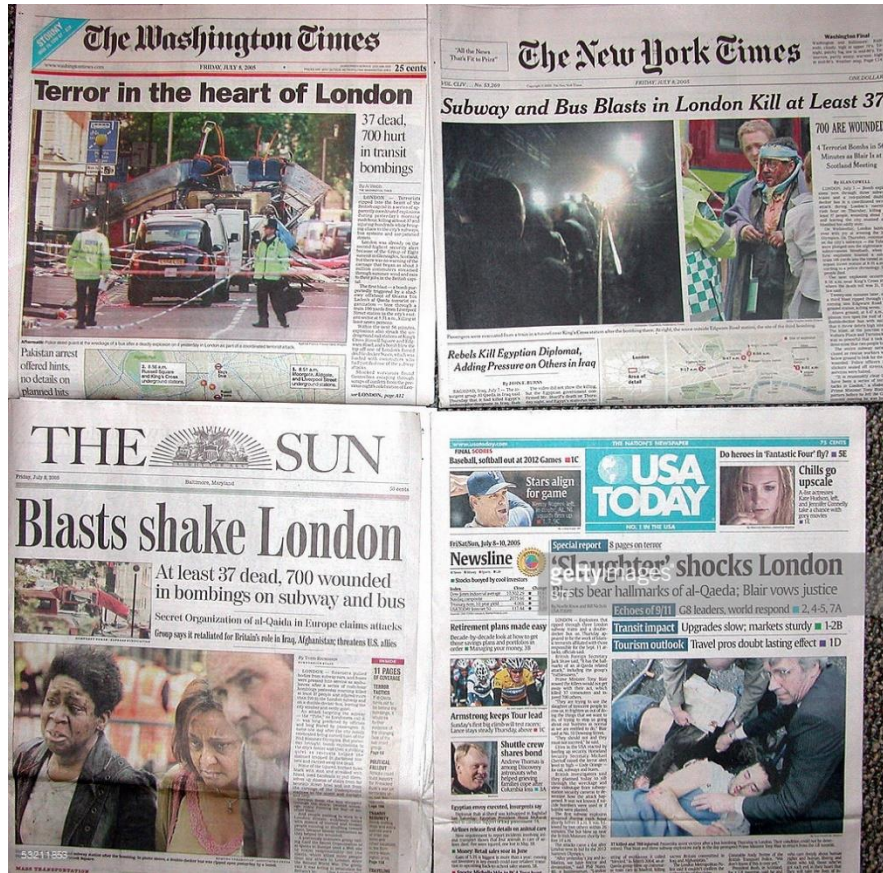
Příloha 1: Novinové titulky po bombových útocích v Londýně