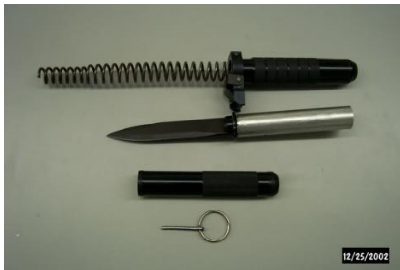
Obrázek 6: Speciální balistický nůž vytvořen pro Specnaz

Specnaz používají pro bojové akce nůž, který byl navržen speciálně pro jejich jednotky. Je jím balistický nůž, který využívá pružinu instalovanou uvnitř rukojeti, což umožňuje, aby se čepel vysunula dostatečně silně na to, aby se dala použít jako účinná zbraň.