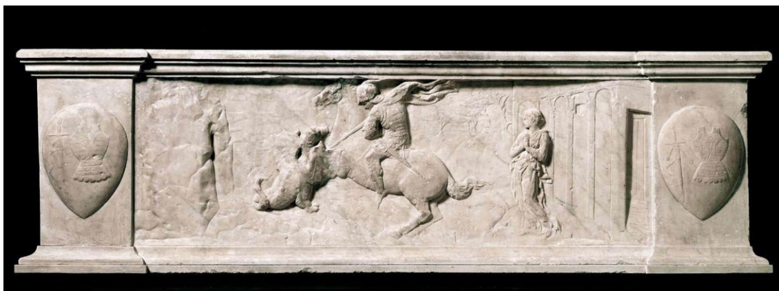
Obr.2 Donatello (r.1417)