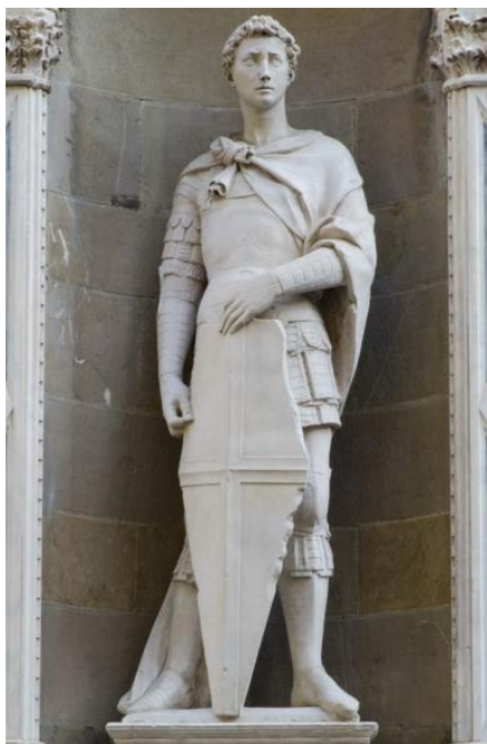
Obr.1 Donatello (r.1416)