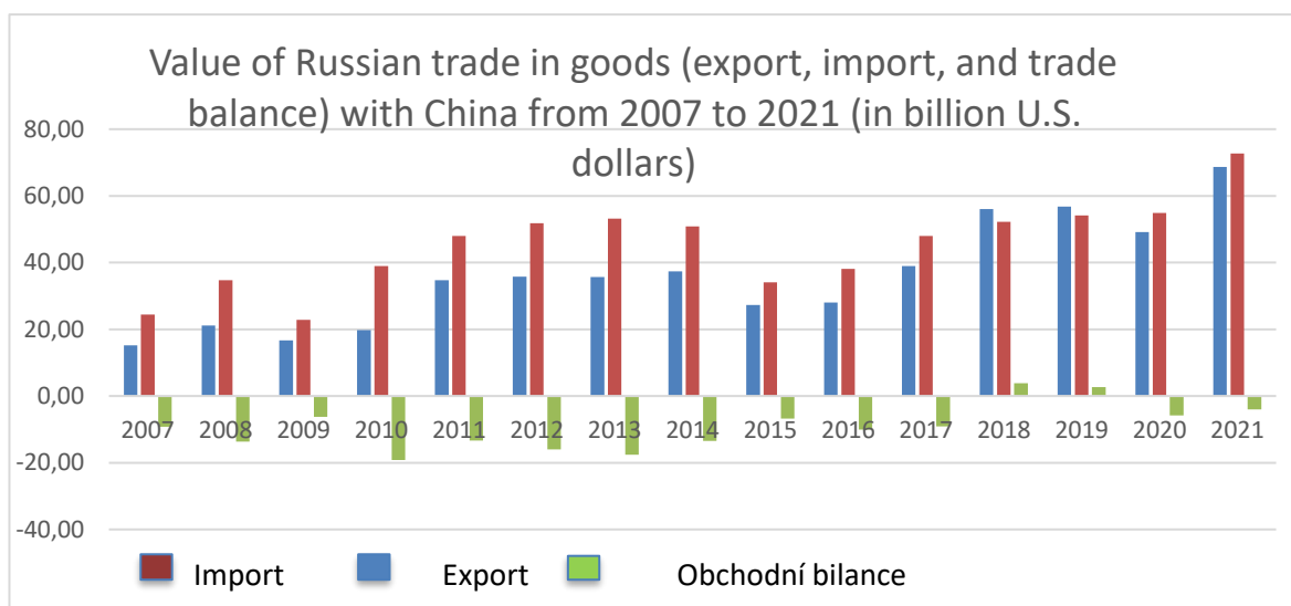
Graf 1 – Hodnota ruského obchodu s Čínou mezi lety 2007-2021 (Trade Map 1, 2023).

V prvním grafu je patrný postupný nárůst obchodu mezi Ruskem a Čínou od roku 2015, tedy rok po uvalení sankcí. Celé sledované období převyšoval import ruského zboží do Číny. Zlom přišel v roce 2018, kdy až na jeden výpadek vykazoval téměř vyrovnaný export a import. Mezi lety 2018-2019 byla obchodní bilance také z pohledu Ruska v kladných číslech.