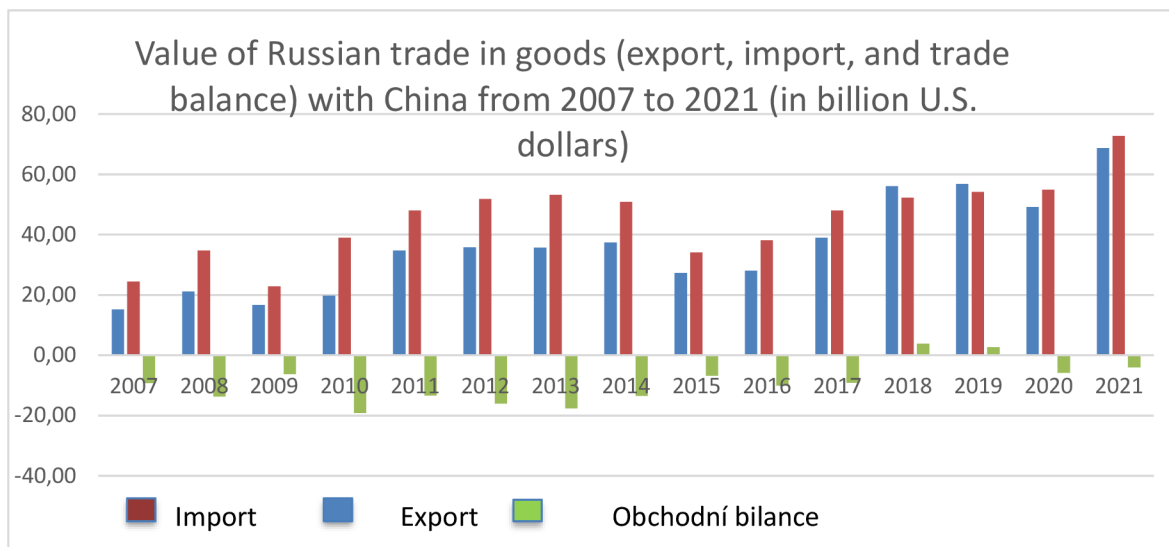
Graf 1 – Hodnota ruského obchodu s Čínou mezi lety 2007-2021 (Trade Map 1, 2023).

V prvním grafu je patrný postupný nárůst obchodu mezi Ruskem a Čínou od roku 2015, tedy rok po uvalení sankcí. Celé sledované období převyšoval import ruského zboží do Číny. Zlom přišel v roce 2018, kdy až na jeden výpadek vykazoval téměř vyrovnaný export a import. Mezi lety 2018-2019 byla obchodní bilance také z pohledu Ruska v kladných číslech.