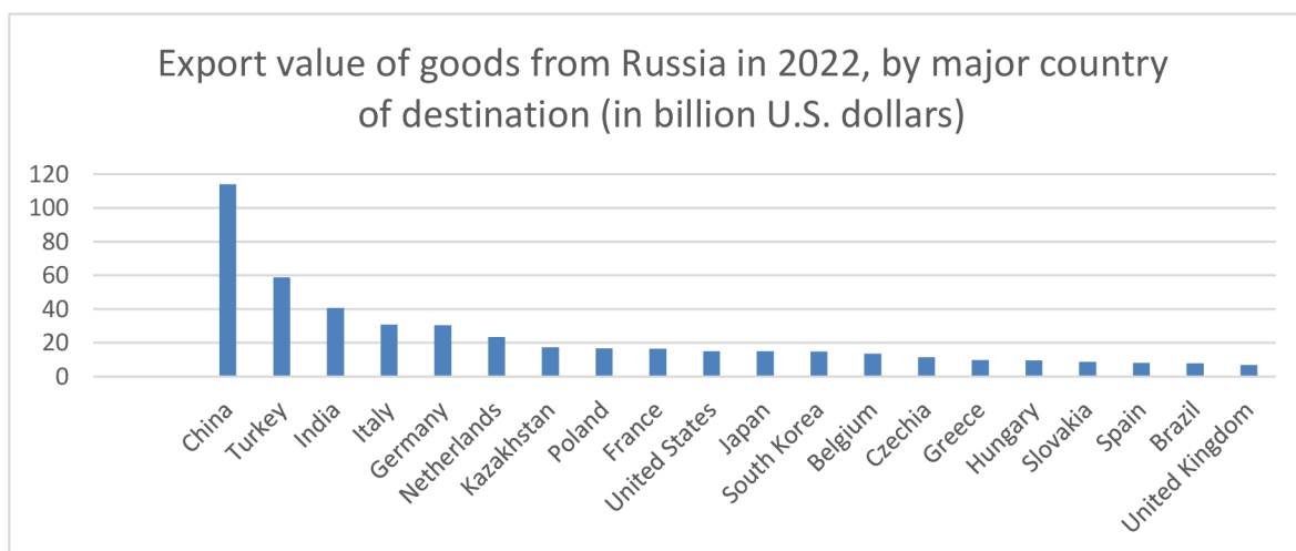
Graf 4 – Hodnota exportu ruského zboží v roce 2022, podle cílové země (Trade Map 4, 2022).

V třetím grafu, na křivce zobrazující hodnotu zboží exportovaného z Ruska do Číny je patrný konstantní nárůst s výjimkou období pandemie covid-19, kdy během roku 2020 export poklesl. V případě importu šlo také o nárůst s mírnou stagnací během roku 2020. V obou případech je na vině pandemie, která v roce 2020 dosahovala vrcholu. Pokles v roce 2015 byl ovlivněn globální situací, kdy kromě uvalení sankcí na Rusko, klesaly ceny nerostných surovin, a navíc také došlo ke problémům s uzavíráním nových bilaterálních smluv mezi Ruskem a Čínou. To se negativně projevilo na celkové hodnotě ruského obchodu s Čínou (Gabuev, 2016).