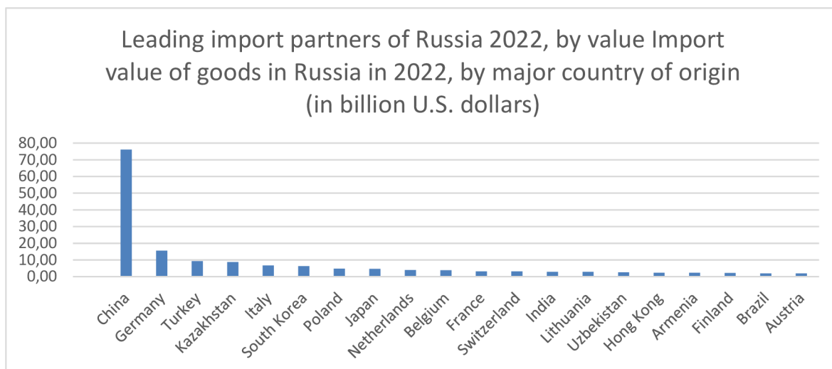
Graf 3 – Hodnota importu zboží do Ruska v roce 2022 podle země původu (Trade Map 3, 2023).

V třetím grafu, na křivce zobrazující hodnotu zboží exportovaného z Ruska do Číny je patrný konstantní nárůst s výjimkou období pandemie covid-19, kdy během roku 2020 export poklesl. V případě importu šlo také o nárůst s mírnou stagnací během roku 2020. V obou případech je na vině pandemie, která v roce 2020 dosahovala vrcholu. Pokles v roce 2015 byl ovlivněn globální situací, kdy kromě uvalení sankcí na Rusko, klesaly ceny nerostných surovin, a navíc také došlo ke problémům s uzavíráním nových bilaterálních smluv mezi Ruskem a Čínou. To se negativně projevilo na celkové hodnotě ruského obchodu s Čínou (Gabuev, 2016).