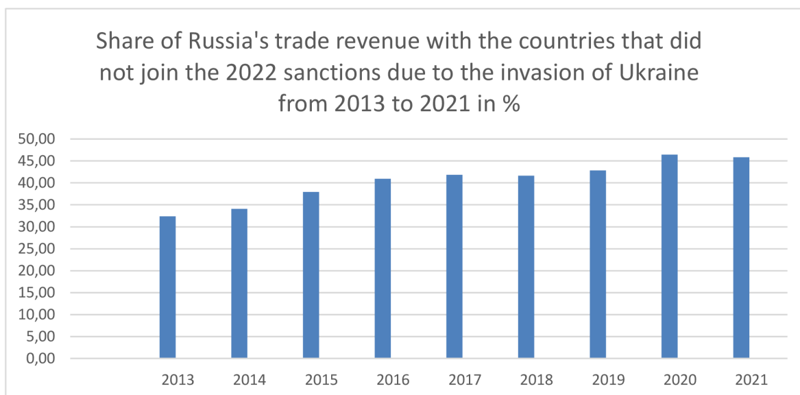
Graf 5 – Podíl příjmů z obchodu se zeměmi, které neuplatňují sankce proti Rusku v letech 2013–2021 (Finexpertiza, 2022).

Čtvrtý graf, který ukazuje země, kam mířil ruský export podle hodnoty exportovaného zboží. Pozorujeme, že v případě první Číny to je téměř dvojnásobek, co druhé Turecko. Ukazuje to tak na tvrzení Alexandera Gabueva již z roku 2019, že se Čína stává hlavním ruským obchodním partnerem (Gabuev 2019).