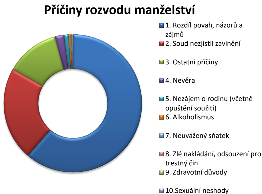
Graf č. 1

V následujícím grafu jsou zobrazeny příčiny rozvodu manželství v roce 2017 v České republice, které byly uváděny v návrzích na rozvod manželství.