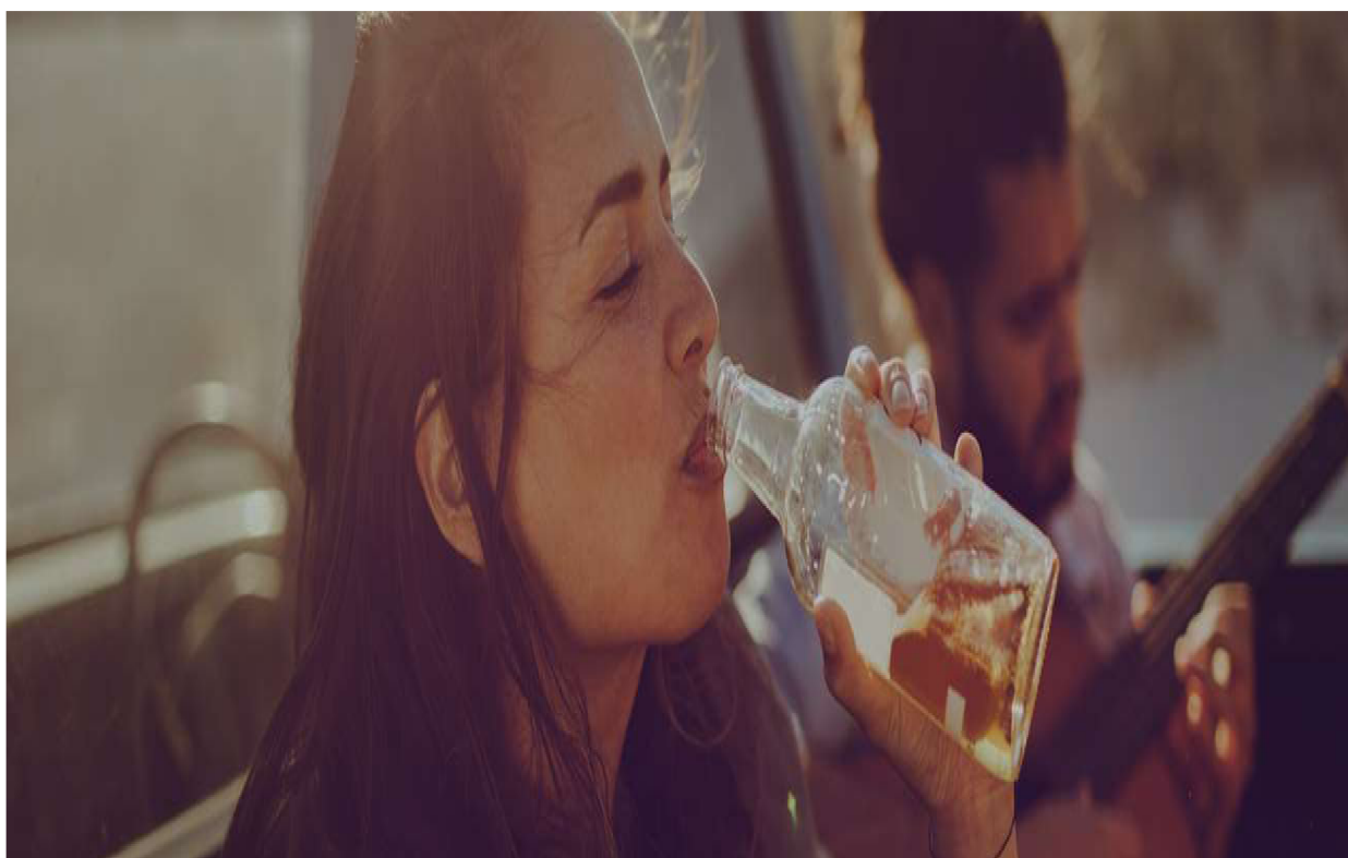
Obrázek č. 4.

Národní monitorovací středisko pro drogy a závislosti