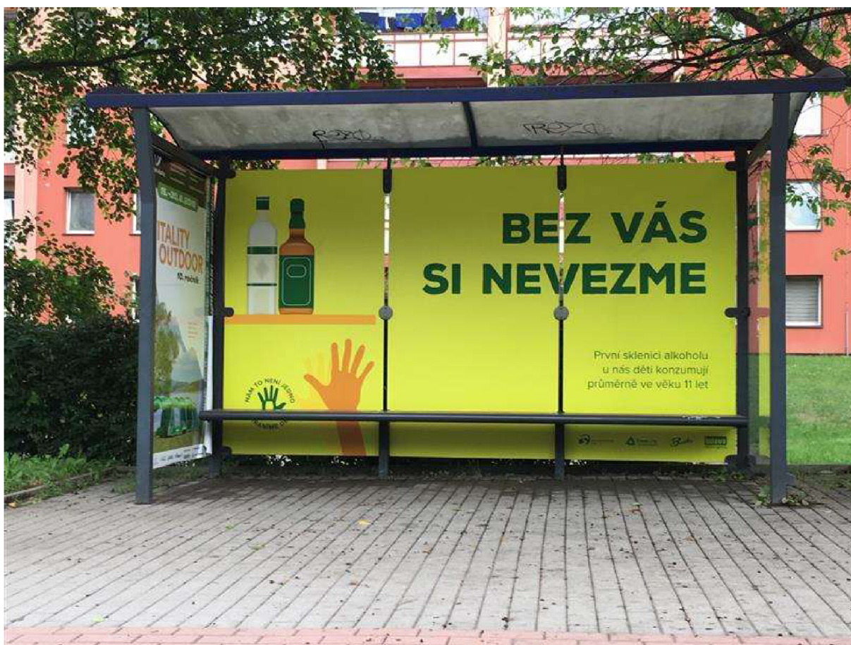
Obrázek č. 2.

Věděli jste, že podle statistik u nás děti zkonzumují první sklenici alkoholu průměrně ve věku 11 let? A že každý druhý školák ve věku 13–15 let u nás zkouší kouřit? Nám to není jedno. Proto se odbor sociálních věcí Magistrátu města Třince ve spolupráci s Bunkrem o.p.s. pustil do stejnojmenné osvětové kampaně proti prodeji a podávání alkoholu a tabákových výrobků mladým lidem ve věku do 18 let.