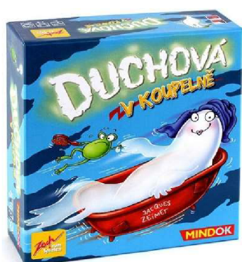
Obrázek č. 17. Duchové v koupelně