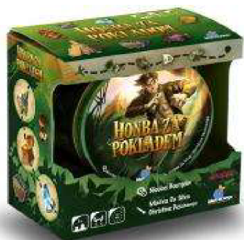
Obrázek č. 18. Honba za pokladem