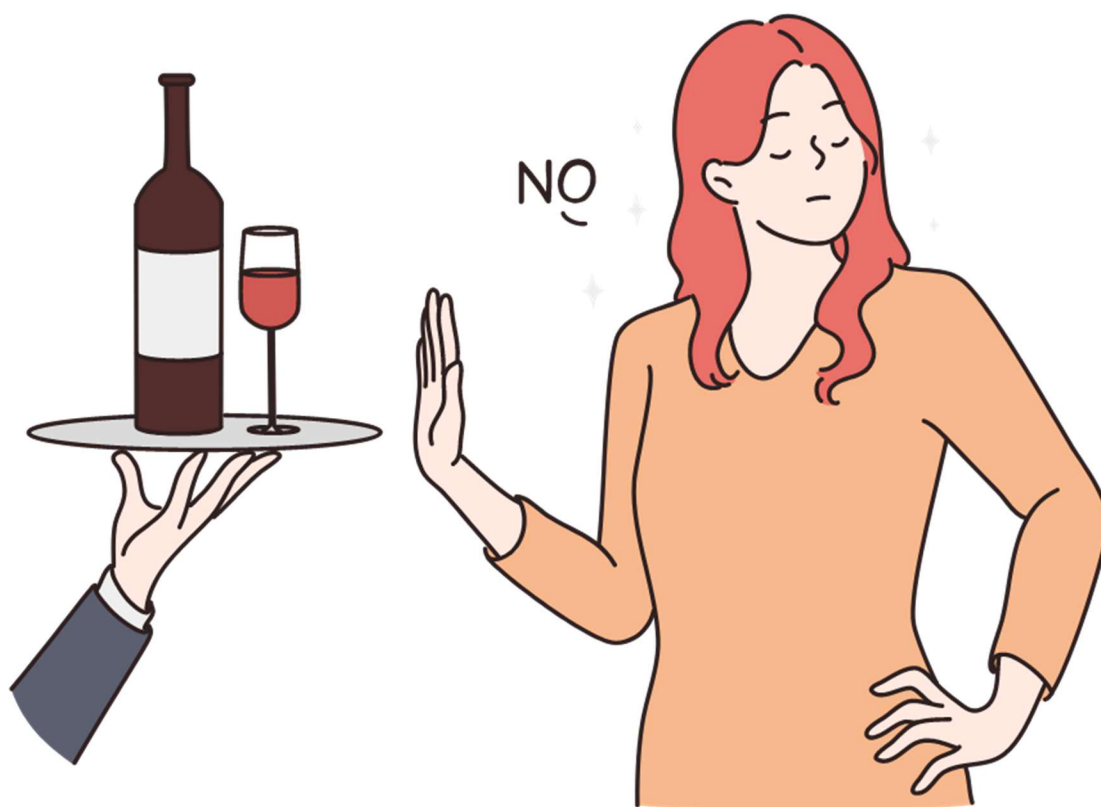
Obrázek č. 3.

Přinášíme vám ověřené informace o alkoholu z Kliniky adiktologie.