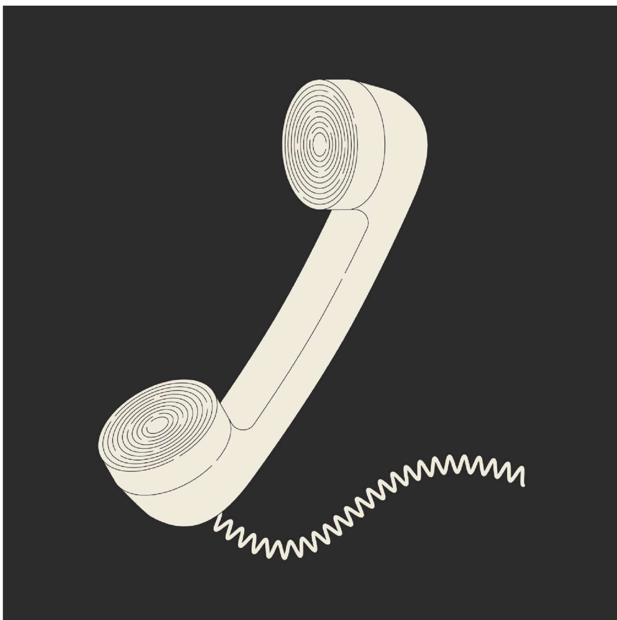
Obrázek č. 5.