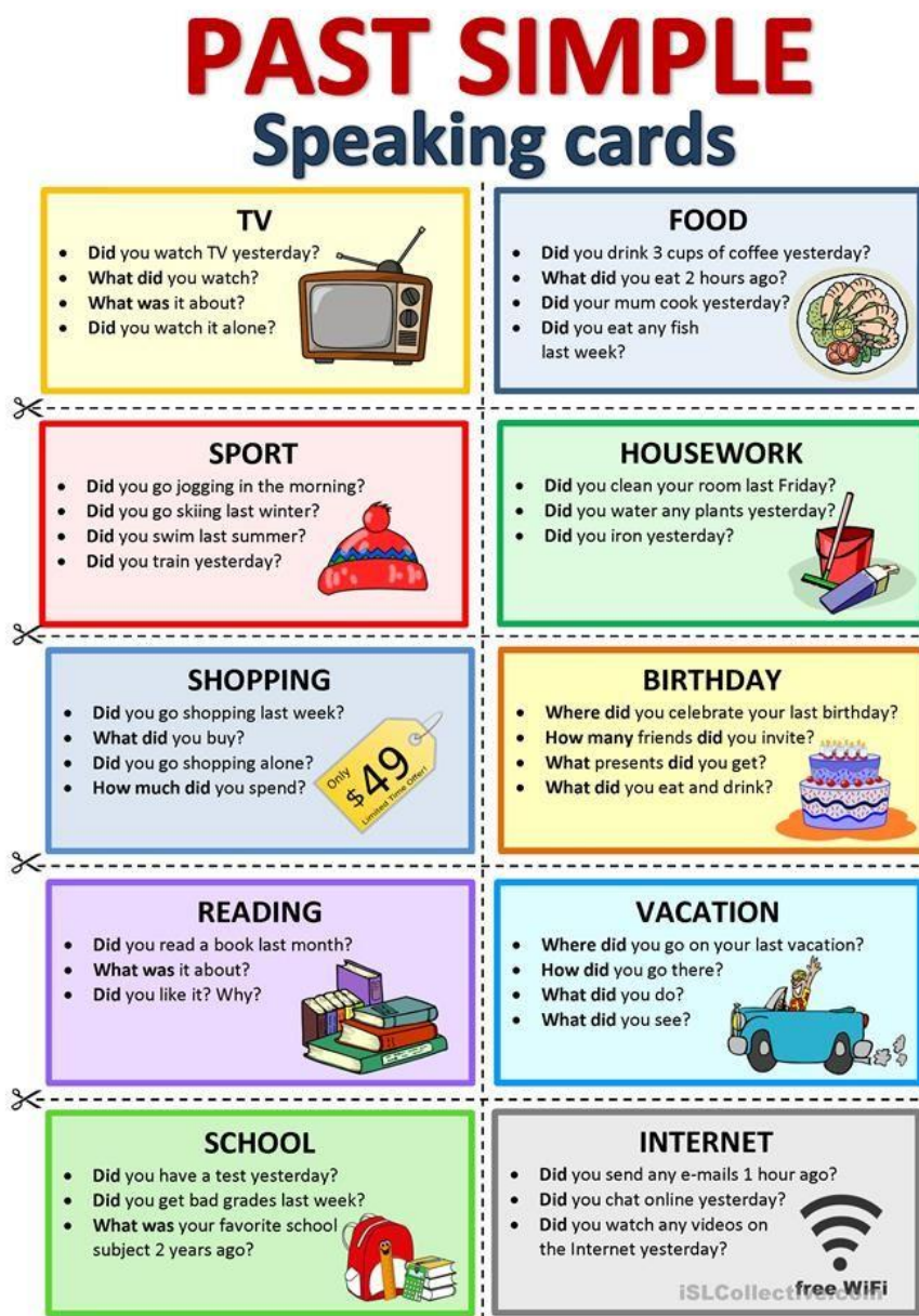
Obrázek 1: Připravená aktivita do hodiny

Učitelé anglického jazyka mohou na Pinterestu najít připravené kartičky na opakování a procvičování v hodině, viz. Obrázek č. 1.