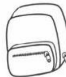
Obrázek 2: Procvičování