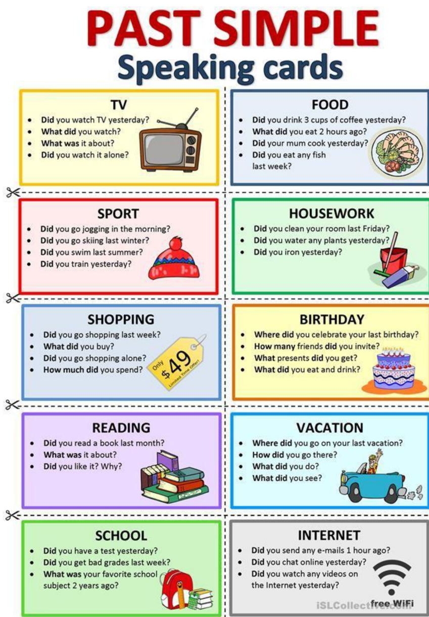
Obrázek 1: Připravená aktivita do hodiny

Učitelé anglického jazyka mohou na Pinterestu najít připravené kartičky na opakování a procvičování v hodině, viz. Obrázek č. 1.