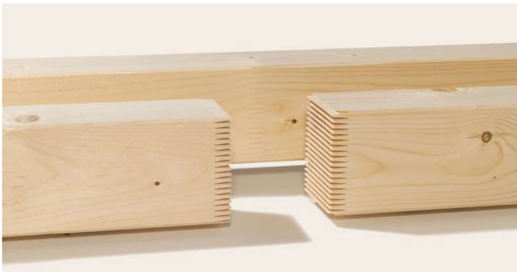
Obrázek 4. Cinkovaný spoj KVH (KVH)