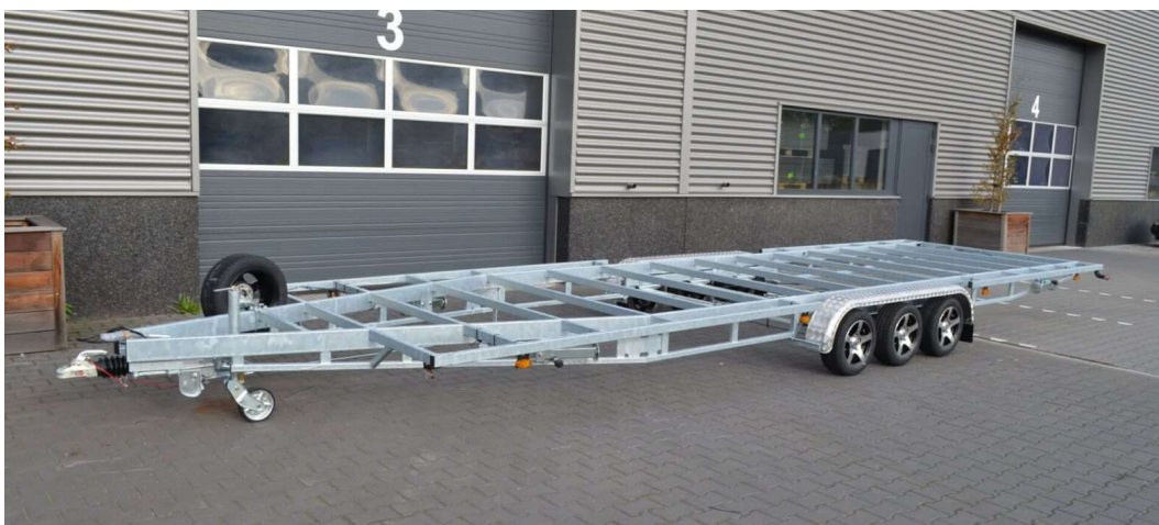
Obrázek 2. Přívěs Vlemmix (Vlemmix, 2023)