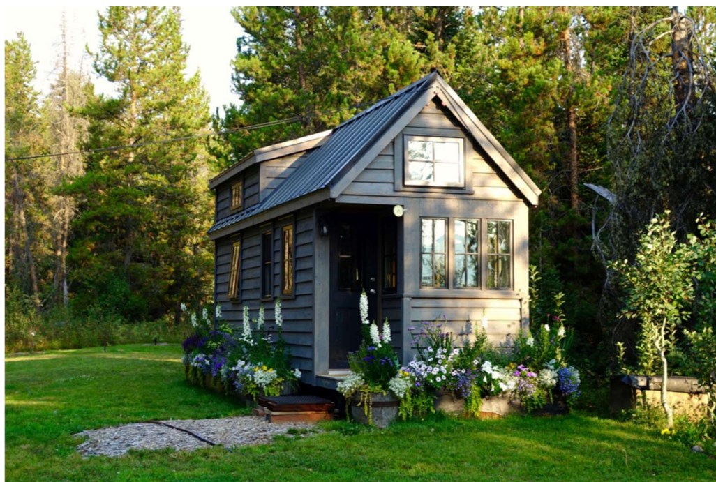
Obrázek 1. Mobilní dům (Toder, 2021)

Mobilní domek lze využívat i jako doplněk ke stávajícímu domu pro přespaní návštěvy při oslavách nebo ho lze pronajímat online (Toder, 2021).