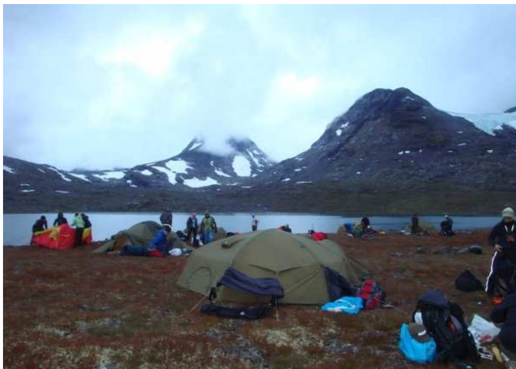
Obrázek 10. Tábor u jezera (Autor, 2009)

Je druhý den ráno (Obrázek 10), pátek 28.8, probouzíme se do deštivého počasí. Po celém dni mám totálně promočené boty, roztrhala se mi pláštěnka a bunda už také není voděodolná. Je mi stále zima, pořád prší, jediná záchrana je můj spacák, to je jediné místo, kde se můžu zahřát. Přes den jsme chytali ryby, učili jsme se pokládat sítě na ryby, které jsme večer snědli, a také jsme vypustili malé rybičky do jezera.