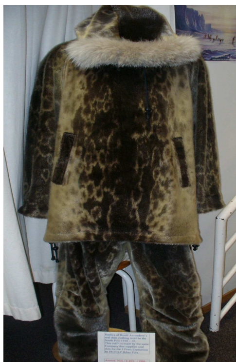
Obrázek 3. Replika Amundsenova obleku v expedici na jižní pól, šitá z tulení kůže stejnou společností jako šila originální oblek (Autor, 2009)