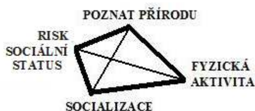
Obrázek 7. Charakteristika OA

Outdoorové aktivity jsou často motivované v potěšení z činnosti a sociálního postavení. Aktivity mají pozitivní charakter pro jednotlivce a budou často dobře vnímány v sociálním spojení, ale mohou být problematické z ekologického hlediska. OA jsou odlišné od FLL a NL ve smyslu, že OA nejsou prováděny na přírodní půdě, neboť příroda je pouhá oblast pro klienty zaměřující se na drahé vybavení a dlouhé a finančně náročné cestování. OA se týkají činností a sportů v přírodě. OA charakterizuje poznání přírody, fyzická aktivita, socializace, ale na vrcholu trojúhelníku je risk, za účelem sociálního statusu (Obrázek 7).