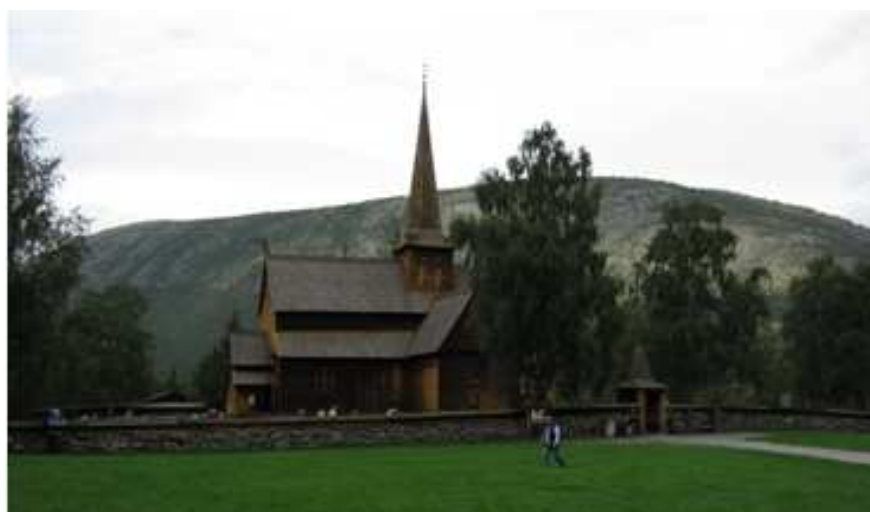
Obrázek 9. Kostel v Lom

První survival se konal 27. 8. – 2. 9. v Národním parku Jotunheimen neboli v domově obrů, kam jsme se dopravili vlakem z Oslo do Otta . Poté jsme pokračovali autobusem do Lom , kde jsme mohli vidět slavný barokní kostel (Obrázek 9), který byl postavený ve 12. století. Dodnes je to jeden z nejlépe zachovaných typických dřevěných kostelů, který stále slouží svému účelu.