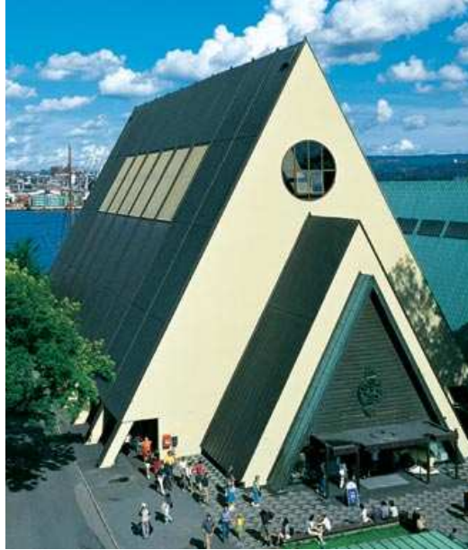
Obrázek 1. Fram museum v Oslo ( http://fram.museum.no )