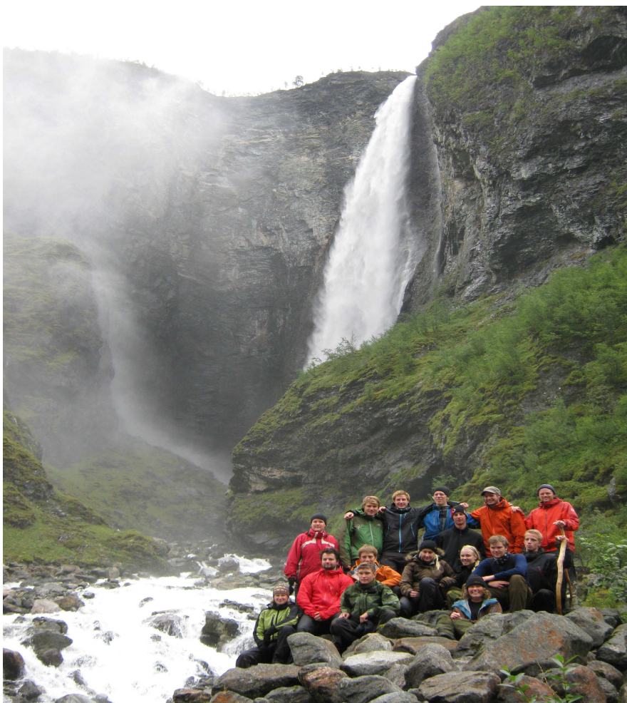
Obrázek 12. U vodopádu Vettisfossen (Autor, 2009)

Ve středu 2.9 máme sraz v 9h ve Vetti Gard , kde mám přednášku o pryskyřníku a o kontryheli. V průběhu celého kurzu mají všichni nachystanou přednášku o nějaké zajímavosti z oblasti. Z Vetti Gard se vyrážíme podívat na jeden z největších vodopádů Norska, Vettisfossen , který má 275m (Obrázek 12).