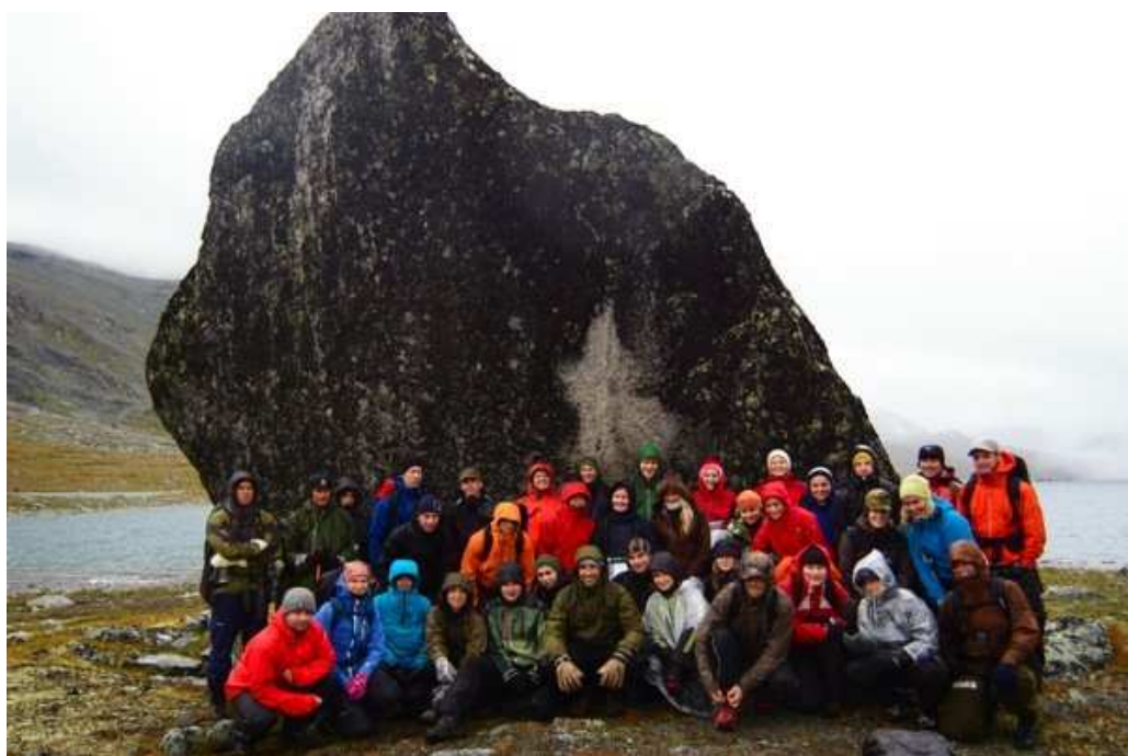
Obrázek 11. Obrázek celé třídy (Autor, 2009)

„Je neděle 30.8, dnes ráno jsme sbalili stan a vydáváme se směrem na chatu Olavsbu , kde máme nedaleko přenocovat. Terén je velmi obtížný. Přes den jsou 3 – 4°C, v noci se pak pohybují teploty pod bodem mrazu okolo tří stupňů. Večer jsme šli spát s pohledem na ledovec, který byl ráno celý zasněžený, u nás v údolí přes den samozřejmě prší“.