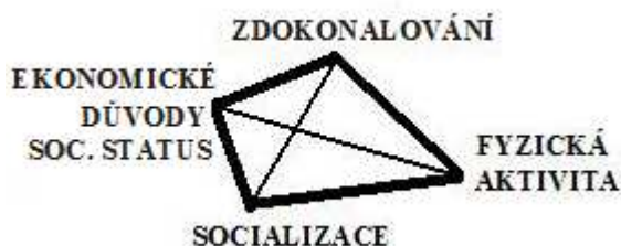
Obrázek 8. Charakteristika sportu

Obrázek 8. charakterizuje sport, to znamená soutěžení a trénování. Sport má stejné motivy jako je fyzická aktivita, socializace, člověk se více předvádí a zdokonaluje se v jednom sportu, pak dalším, člověk se stane známým, zvýší se mu sociální status, také ekonomické důvody nejsou zanedbatelné.