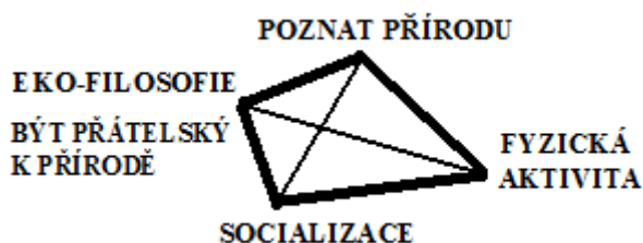
Obrázek 4. Charakteristika FLL

Pokud se podíváte na motivy FLL (Obrázek 4), máme tři oblasti. Socializace, fyzická aktivita a poznání přírody. Ale pokud se podíváme na obrázek jako na pyramidu, na vrcholu můžeme vidět norské eko-filosofické myšlení, měli byste být venku v přírodě, přátelsky se k přírodě chovat, cítit harmonii s přírodou, to je cíl pobytu v přírodě. Takže filosofie je následující: lidé se mají v přírodě cítit šťastní, mají se o přírodu starat, z toho plyne environmentální vzdělávání.