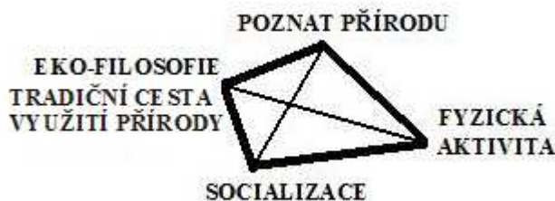
Obrázek 6. Charakteristika NL