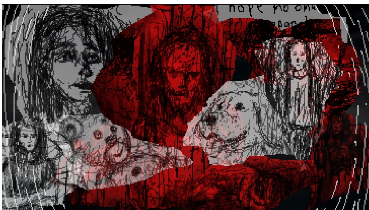
Střet se špatnými a dobrými vzpomínkami