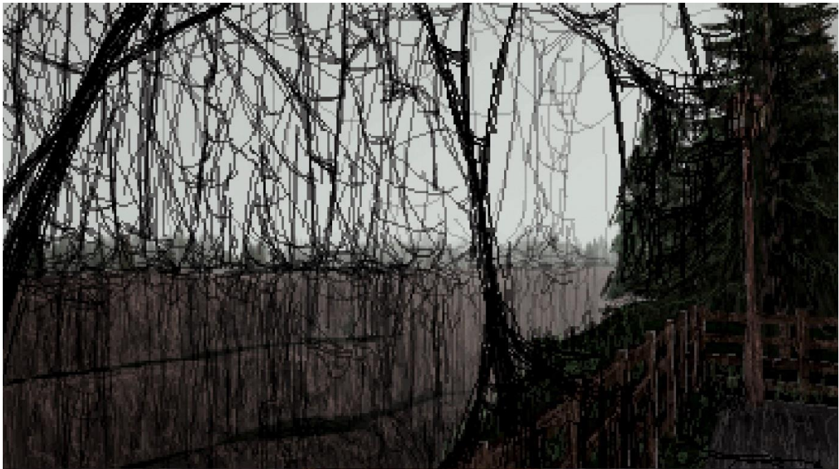
Vizualita vnitřního hlasu, který získává kontrolu nad hrou