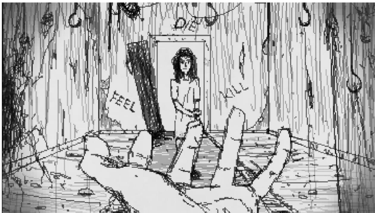
Druhý akt, virtuální galerie, snová sekvence hlavní postavy