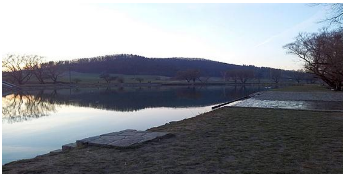
Příloha: 2 Kuřim - Rybník Srpek