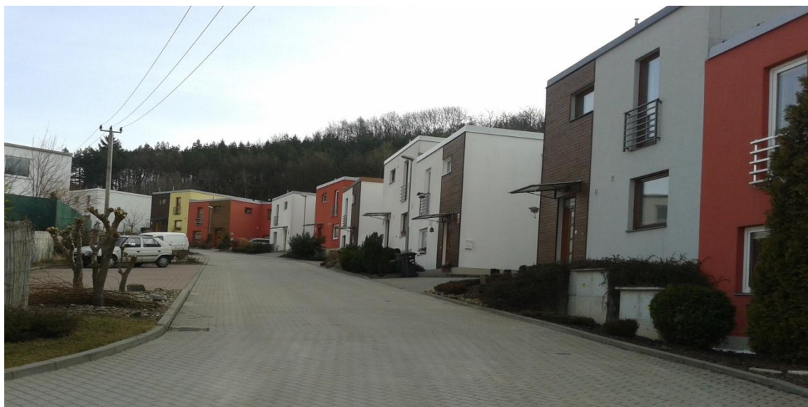
Příloha: 3: Kuřim – Kolébka (suburbanizace)