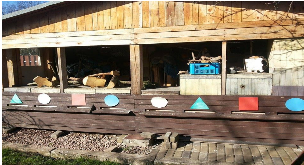
Příloha 5: včelnice