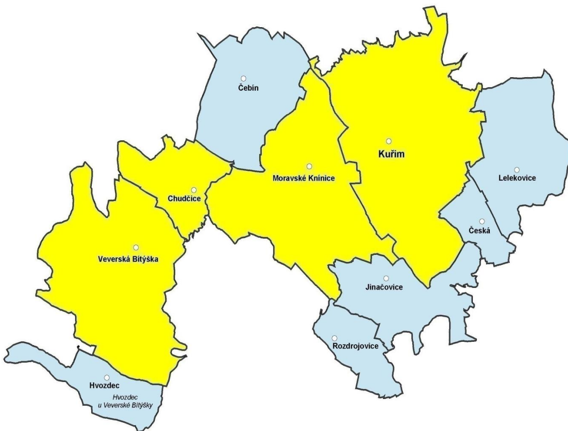
Obrázek 1: Správní obvod mikroregion Kuřimka