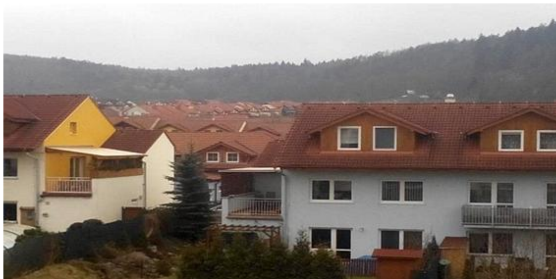
Příloha: 1 Kuřim - Díly za Sv. Jánem (suburbanizace)