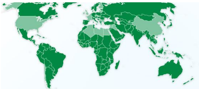
Obrázek 2: Působnost společnosti Agroad

Z osobní návštěvy asistentky ředitele jsem se dozvěděla, že firma zaměstnává 23 pracovníků, kteří převážně dojíždějí z Brna. Mezi výhody podnikání řadí kvalitní produkty za dobré ceny a poprodejní servis. Nevýhodami je nedostatek kvalitních a kvalifikovaných obchodníků, kteří se dokáží oddat plně firmě a svým klientům. Do budoucna chtějí expandovat do dalších zemí a rozšířit nabídku produktů a služeb.