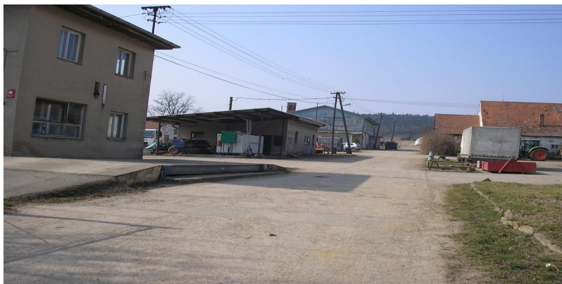
Příloha: 4: Zemědělské družstvo Moravské Knínice