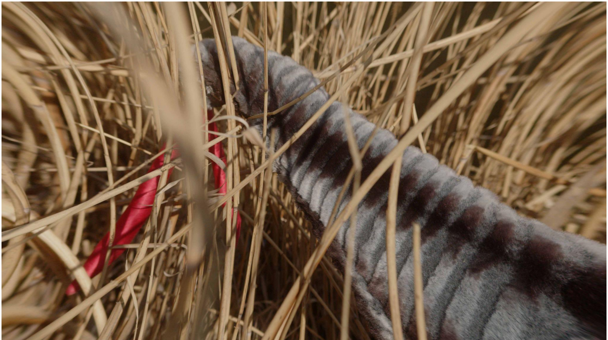
D-SEED I., 02:10 min, still from the video, Martin D. Kratochvíl