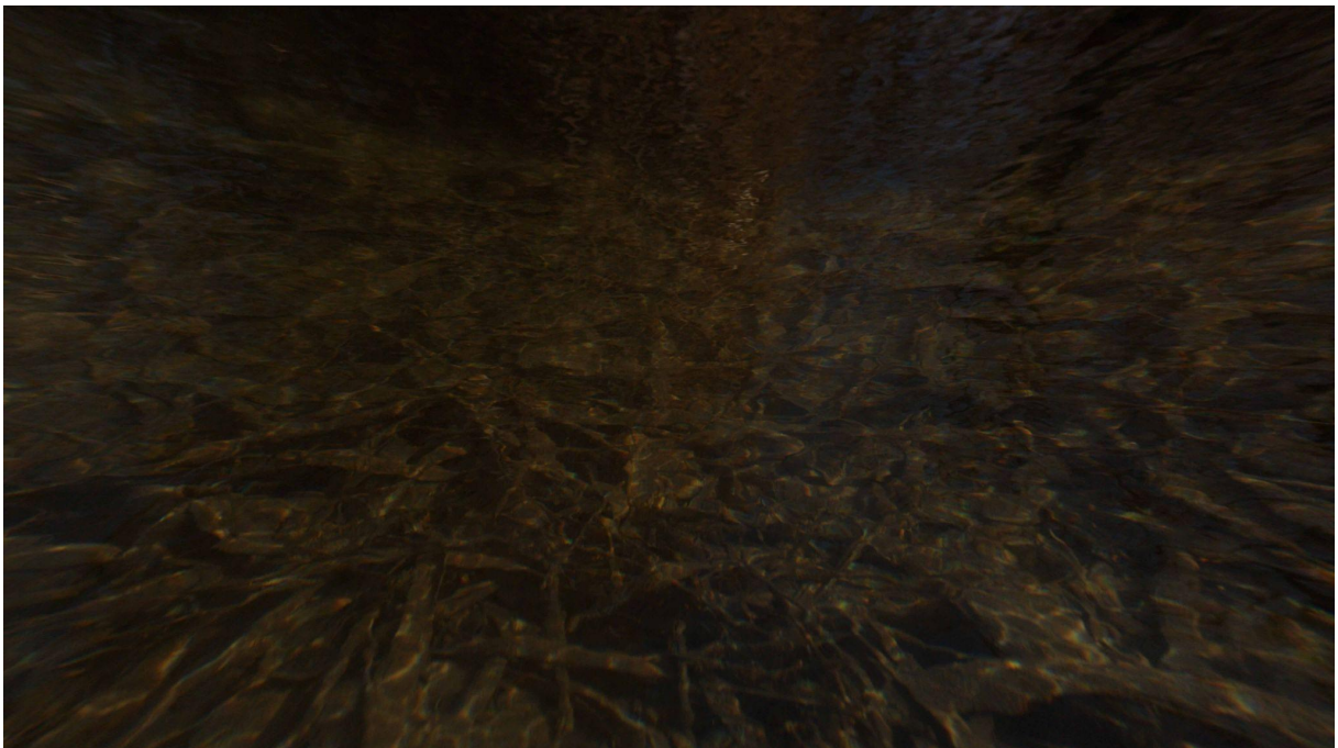
D-SEED I., 03:29 min, still from the video, Martin D. Kratochvíl