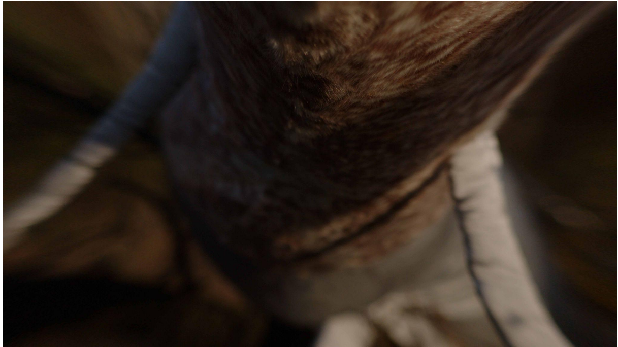
D-SEED I., 04:40 min, still from the video, Martin D. Kratochvíl