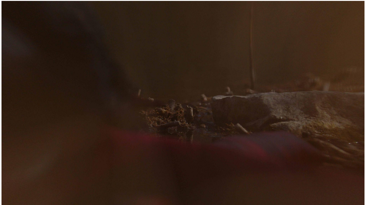
D-SEED I., 00:35 min, still from the video, Martin D. Kratochvíl