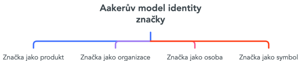
Obrázek 1: Aakerův model identity značky

Již zmíněný Aakerův model se skládá z několika prvků, které může značka použít i k definování identity své značky. Tím může značka přizpůsobit svůj produkt nebo službu.