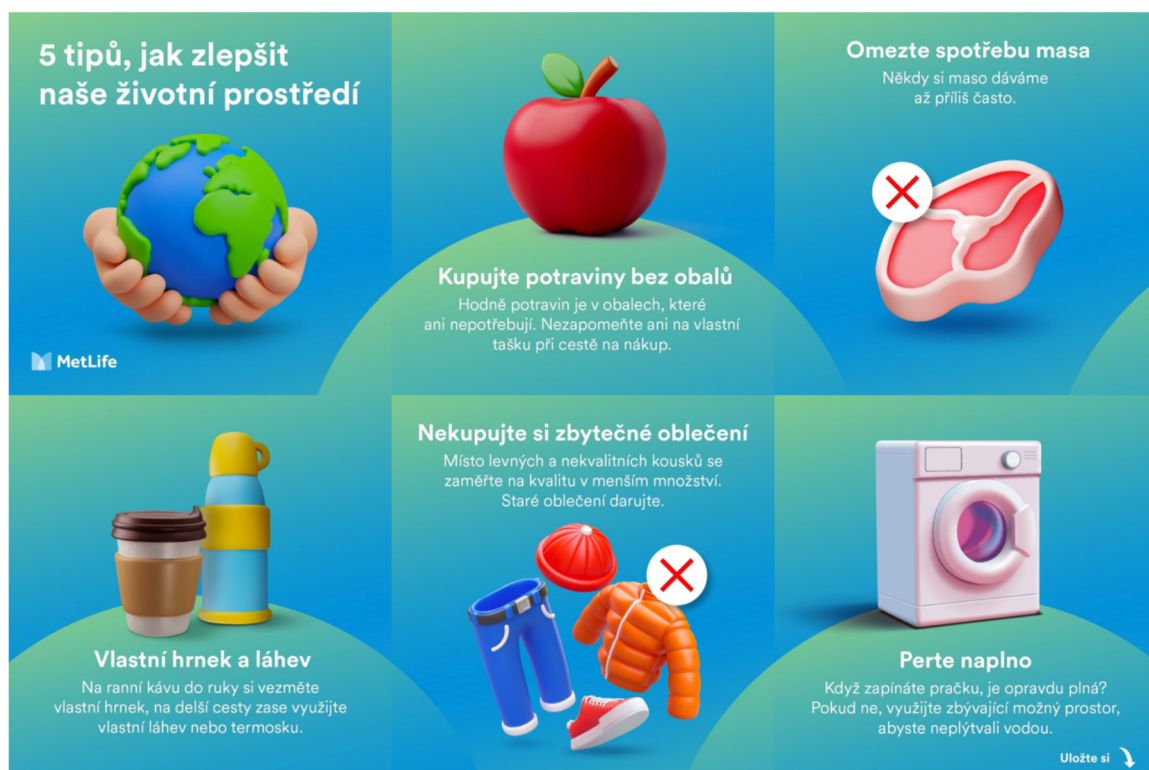
Obrázek 4: Instagramový příspěvek MetLife

Vzdělávací obsah na Instagramu: Společnost MetLife sdílí aktivně na svém Instagramovém profilu příspěvky, které vzdělávají jejich sledující v různých směrech nejen v tom pojišťovacím. Jedním z příkladů může být příspěvek, který se zabývá tipy, jak zlepšit naše životní prostředí. Vzdělává tak sledující ohledně problematiky životního prostředí a nabízí způsoby, jak jej zlepšit. Viz obrázek č. 4.