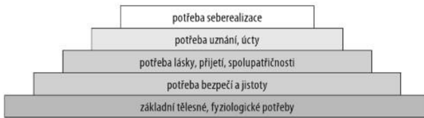
Obrázek 1.: Maslowova pyramida potřeb

představitelem této oblasti se stal americký psycholog Abraham Maslow a jeho pyramida potřeb.