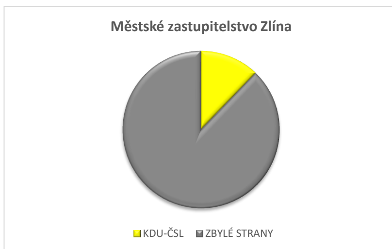
Graf 2: Zastoupení KDU-ČSL v městském zastupitelstvu Zlína dle výsledků komunálních voleb

Zlínská KDU-ČSL získala ve volbách do městského zastupitelstva v letech 1990–2018 průměrně 5 mandátů. Výšečový graf č. 2 dokládá, jaké bylo obsazení této strany v městském zastupitelstvu Zlína a jakého vlivu se straně dostalo. Graf je sestaven na aktuální počet městských zastupitelů, který činí 41.