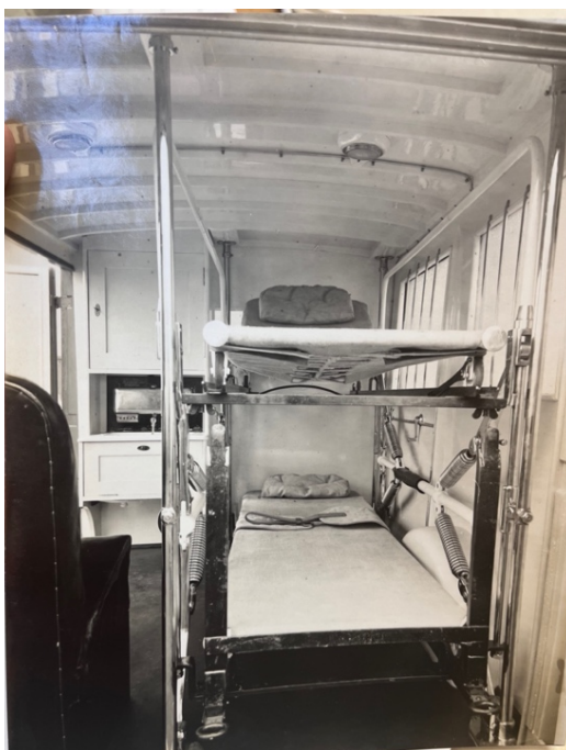
Obrázek 1 Vybavení sanitního vozu