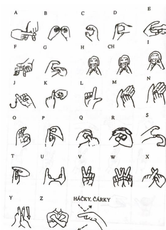
Obr. č. 2: Česká dvouruční prstová abeceda (převzato: Kraulcová, 2002, s. 229)