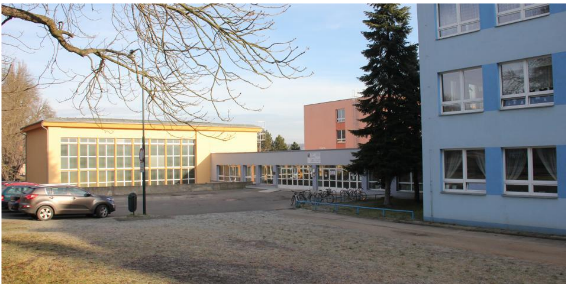
Příloha 4: ZŠ J.A. Komenského Lysá nad Labem