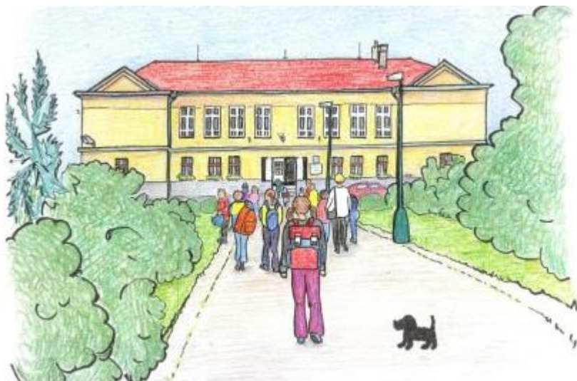
Priloha 1: Logo ZŠ T.G.Masaryka Litol