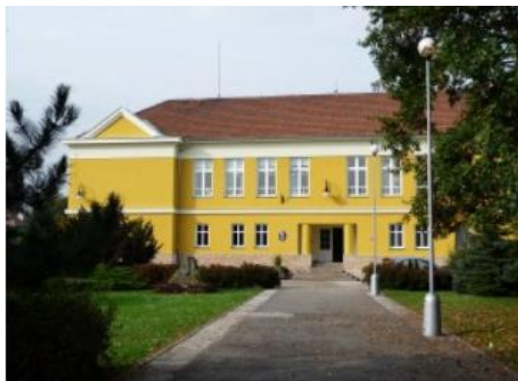
Priloha 2: ZŠ T.G.Masaryka Litol