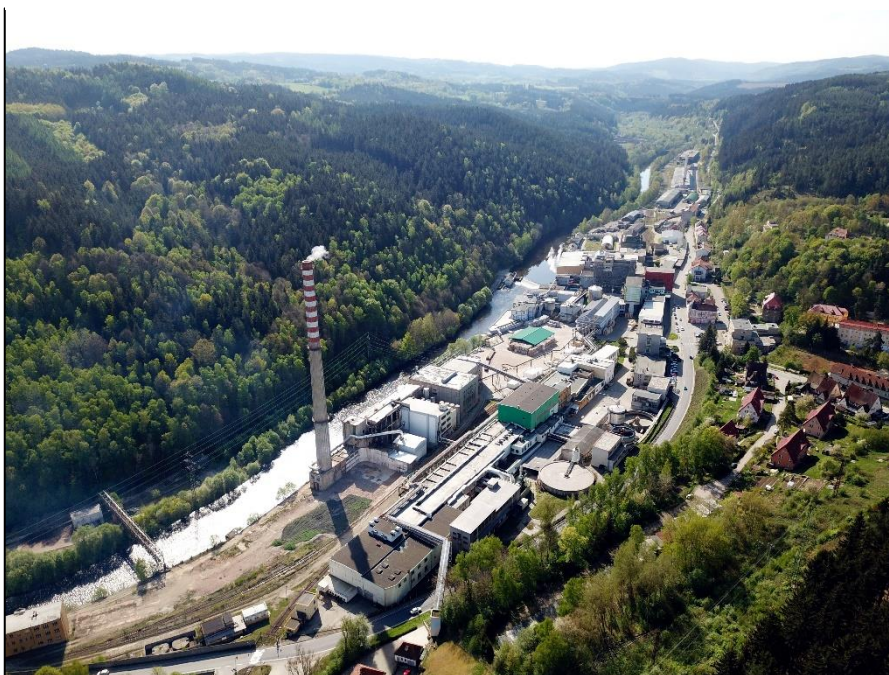
Obrázek 1 - Fotografie společnosti JIP – Větrní, a.s.