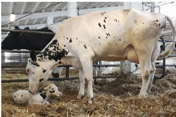
Obrázek 2.1: Čerstvě narozené tele

Dalším důležitým krmivem v době stání na sucho je seno, které musí být hygienicky nezávadné a správně nařezané.