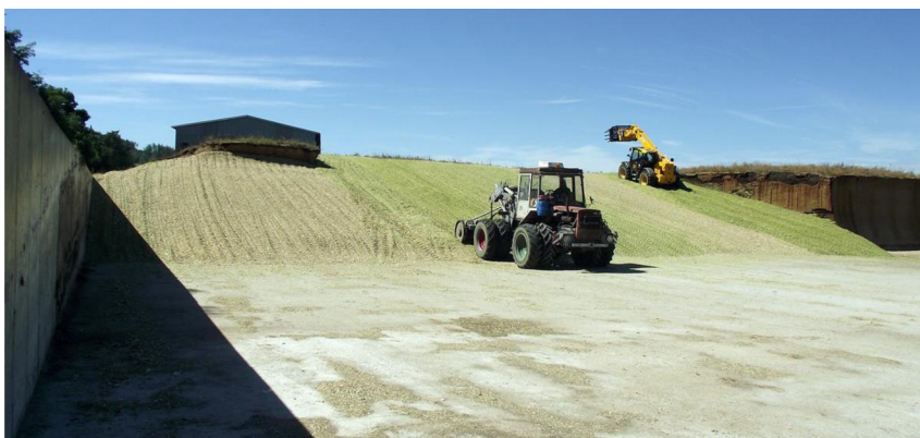
Obrázek 1.2: Silážní jáma (Krátký, 2012)

Podle Thomsona et al. (2018) krmení vojtěškou namísto kukuřičnou siláží, zmírní riziko acidózy, pravděpodobně v důsledku nižší koncentrace škrobu vojtěšky, vyšší účinné koncentrace vlákniny a vyšší pufrovací kapacity vojtěšky ve srovnání s kukuřičnou siláží.