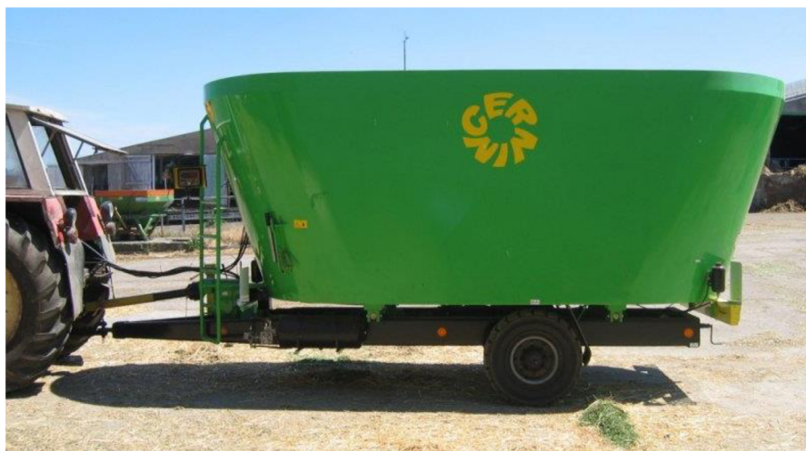
Obrázek 1.3: Krmný vůz (Cernin s.r.o., 2010)

Když krmný vůz vyloží krmivo, mělo by se zvednout a jít žrát minimum krav. Pokud se zvedne více než 60 % krav, svědčí to o nedostatečném přísunu kvalitní TMR na krmný stůl (Rytina, 2015).