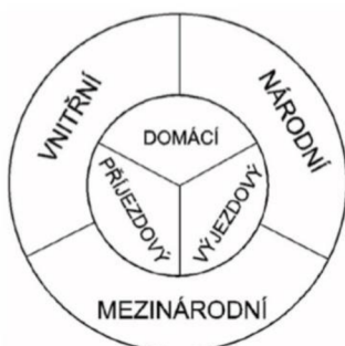
Obrázek 1: Druhy cestovního ruchu podle místa realizace

Podle vztahu k platební bilanci na domácí – cestování uvnitř země s trvalým bydlištěm bez překračování hranic. Z hlediska platební bilance se jedná o domácí spotřebu; zahraniční – cestování, při kterém dochází k překračování hranic jednoho či více států; dělí se na aktivní (příjezd cizinců do destinace) a pasivní (výjezd domácích turistů do zahraničí); tranzitní – průjezd cestujících přes území státu za účelem příjezdu do jiné cílové země, anebo pohyb cestujících v prostoru letiště z důvodu mezipřistání letadla.