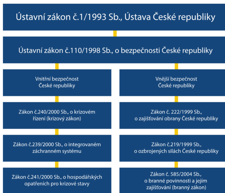
Obrázek 3 - Legislativní architektura krizového řízení 54

V předchozích kapitolách mé diplomové práce popisují především ústavní zákon č. 110/1998 Sb., o bezpečnosti České republiky, dále zákon č. 239/2000Sb., o integrovaném záchranném systému a zákon č. 240/2000Sb., o krizovém řízení. Vyzdvihují tyto tři zákony především z toho důvodu, že je považují za stěžejní pro pochopení obecné problematiky krizového řízení. Zákon o IZS je stěžejní pro pochopení mimořádné situace a systému IZS, který je hlavním řešitelem těchto situací. Zákon o krizovém řízení vymezuje jednotlivé práva a povinnosti orgánů krizového řízení, které také definuje. A nakonec, ústavní zákon o bezpečnosti jistým způsobem zastřešuje veškeré zákony, které se krizového řízení týkají. Pro větší přehlednost právního rámce níže přikládám obrázek, který popisuje legislativní architekturu krizového řízení v České republice.