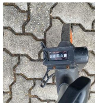
Obrázek č.9 - Krokoměr s minimální hodnotou 10cm na měřícím kolečku