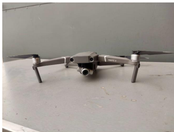
Obrázek č.6 - Klasicky používaný Dron DJI Mavic 2