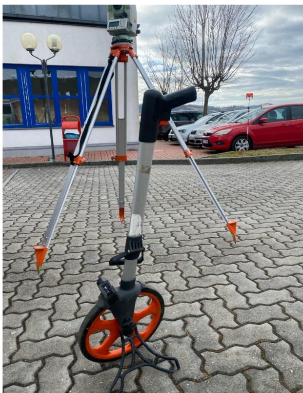
Obrázek č. 7- Mechanické měřící kolečko v porovnání s TMS

Po každém měření a zapsání míry do náčrtku se míra na krokoměru pomocí stisknutí tlačítka vynuluje, aby bylo možné provést další měření