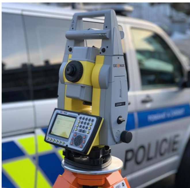
Obrázek č.3 - Robotická totální stanice

Hlavní rozdíl v měření je potřeba k operování stanice pouze jedné osoby. Tudíž po sestavení stanice si pracovník vezme tyč s odrazným hranolem, který je všesměrový a 360 stupňový. Na tyč je možné připojit držák s tabletem nebo jiným displejem dle volby ovladače (kontrolérů). Místo tabletu lze též využít například osobního mobilního telefonu, jelikož stanice je vybavena i Bluetooth připojením. Na displeji ovladače připojenému k tyči s hranolem si pak pracovník sám dokáže zaznamenat vzdálenosti a uložit je.