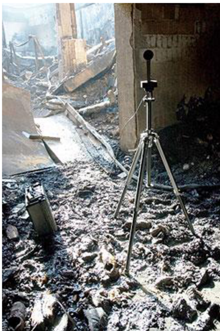
Obrázek č. 1 - Sférická kamera Spheron VR

Po úspěšném snímku sférické fotografie se snímek exportuje se všemi daty na CD nebo DVD disk, které se mohou vložit do počítače bez potřeby žádného speciálního programu na jeho otevření. 45