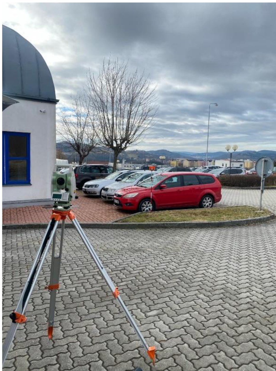
Obrázek č.12 - Měření vzdálenosti k autu za pomoci TMS

Flash disk se vloží do počítače a otevře se v programu (bitmapové programy sloužící k vytvoření plánku jako PC crash nebo PC draw), které jsou k tomu uzpůsobené. V programu se zobrazí body na bílém pozadí a u většiny případů se vyhledá na mapě místo situace a podle mapy se postupně plánek s vyměřenými body zakreslí. Tyto programy jsou též schopné vygenerovat různé předměty, jako dopravní značky, auta podle modelů a další značení.