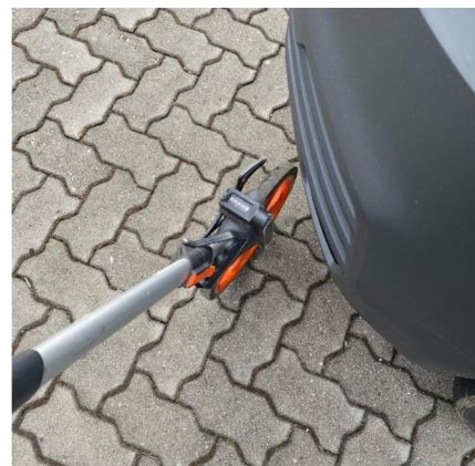
Obrázek č.8 - Nepříznivý tvar kolečka při měření k vozidlu