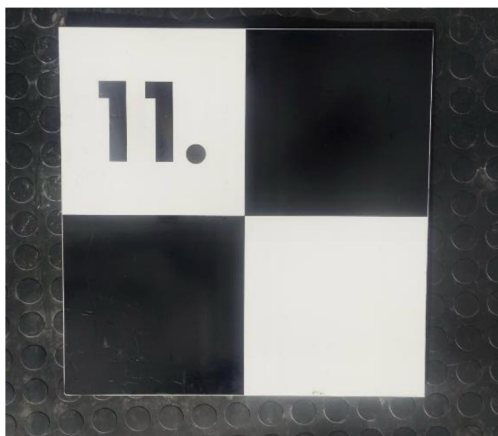
Obrázek č. 5 - Čtverec pro potřeby zaměření dronů na dopravních nehodách

Pro pyrotechnickou službu policie je výhodné využít dronů ve smyslu průzkumu - vyhledat viditelné a termovizní části spektra elektromagnetického záření a zahoření okolí výbuchu. 67