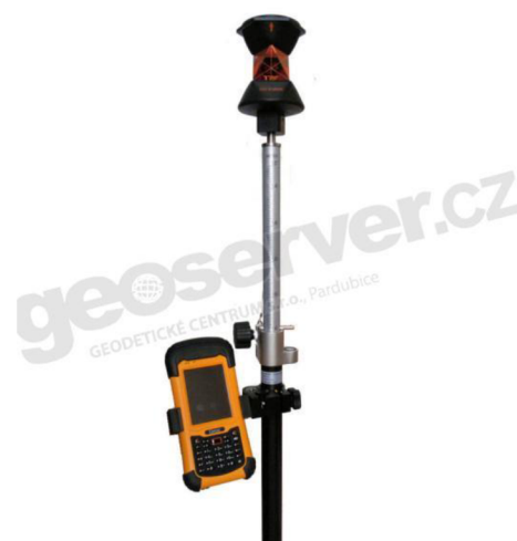
Obrázek č.4 - 360° hranolová tyč s držadlem na mobilní zařízení, tablet a jiné