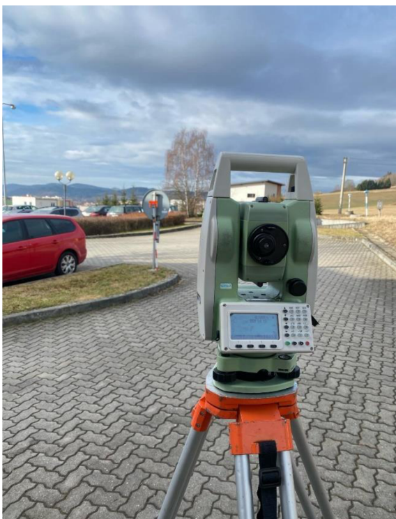
Obrázek č. 10 - Totální měřicí stanice po sestavení, směřující laserovým paprskem na hranolovou tyč