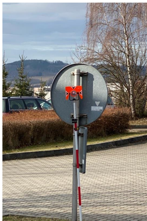
Obrázek č. 11 - Hranolová tyč s odrazným zrcátkem zarytá v zemi před dopravní značkou

Postupně se zaměřují další body, počet bodů většinou záleží na místě a situaci, která se vyšetřuje. Kromě pomocných bodů v prostředí se zaměřují i různé stopy, nalezené na místě. To mohou být různé rýhy, brzdné stopy, kusy nebo celé předměty zanechané na místě a v některých případech i mrtvá těla osob nebo stopy krve, oblečení či helmy nebo jiné předměty. Tyto stopy se také jinak očísloují a často, např. u dopravních nehod, se nejdříve okolo stopy udělá barevným sprejem značení, aby se místo a stopy mohly odklidit a měření poté bylo možné podle sprejových označení. Auta se zpravidla měří pomocí středu kol a zpravidla při nehodách hlavně z přístupné strany. V zatáčkách nebo obloukovitých tvarech se doporučuje dělat více bodů, aby bylo srozumitelné, o jaký tvar objektu se jedná.