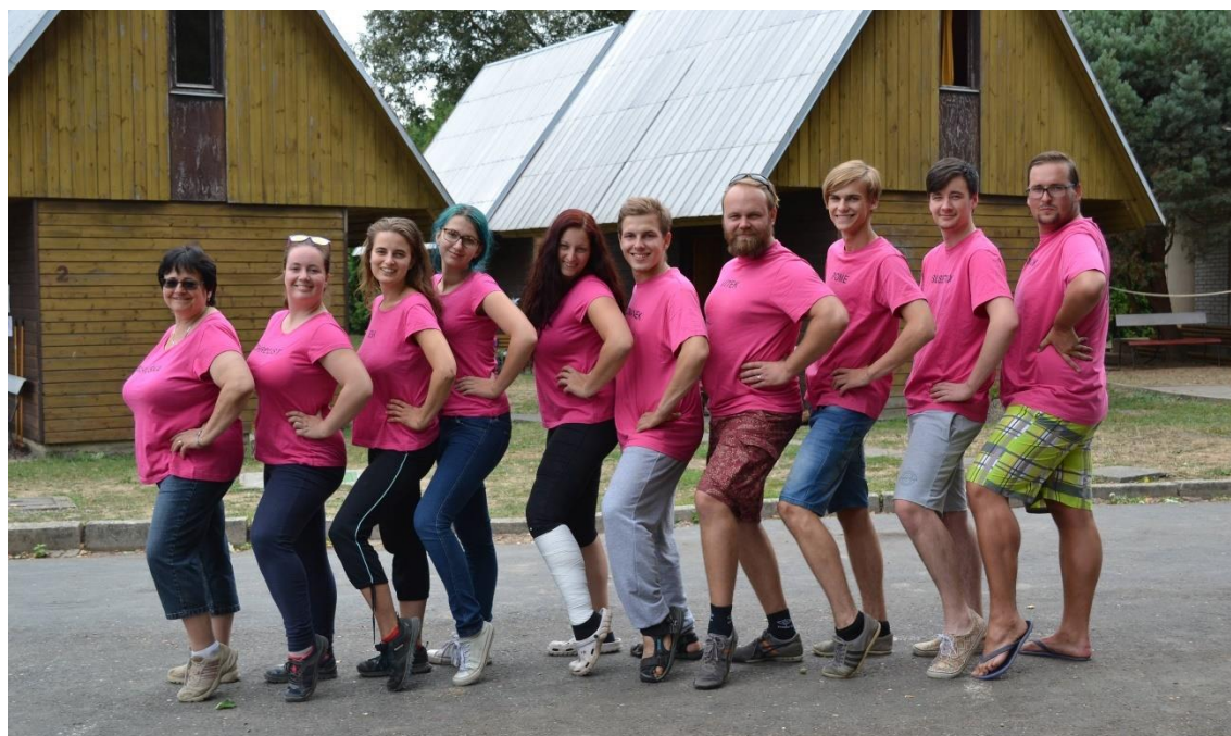
Obrázek 11: Realizační tým Frajerů, poslední sezona 2018/2019.