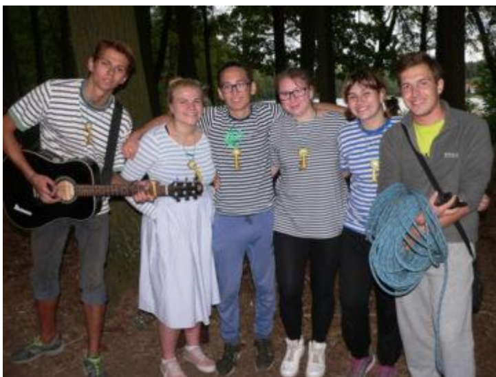
Obrázek 7: Paklíči ve hře Zbýšovyard s koordinátorem.