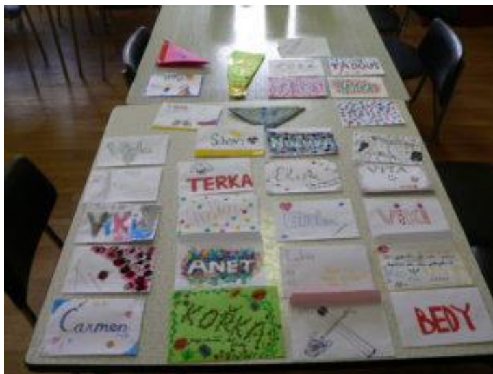
Obrázek 6: Tvorba obálek pro psanička.