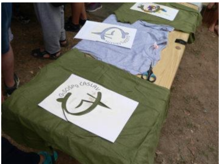
Obrázek 5: Tvorba triček.

Fotografie z adaptačních kurzů (zdroj: archiv Gymnázia a SOŠPg Čáslav).