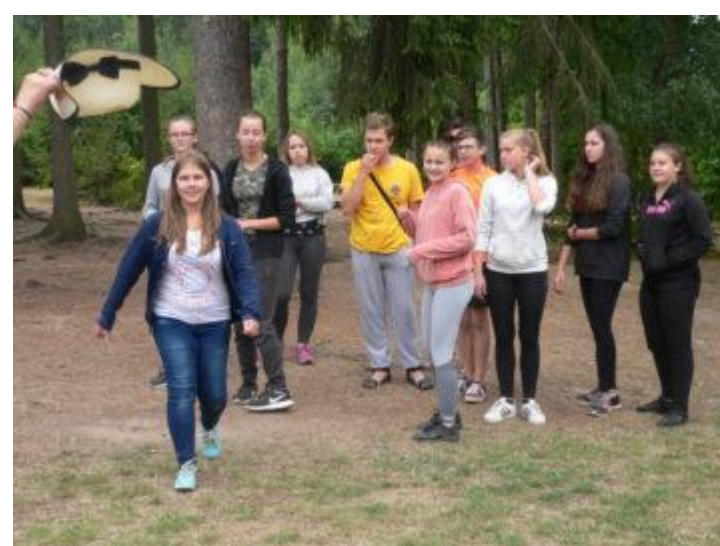
Obrázek 10: Ukázka z psychohrátek: hra Bomba.