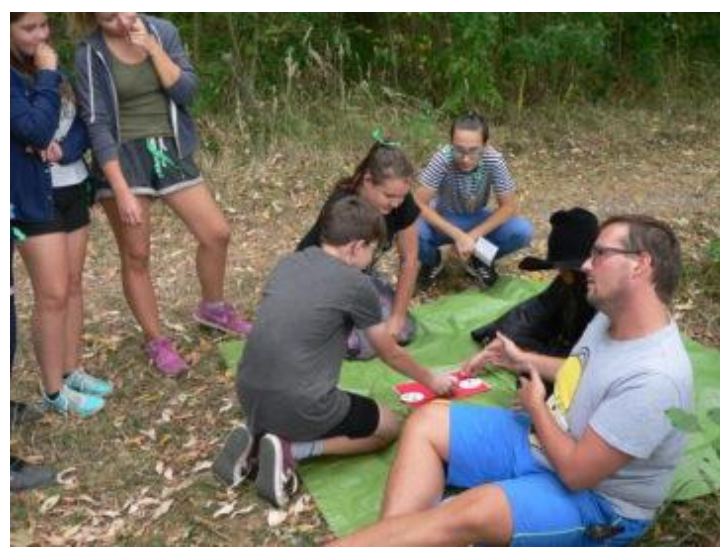
Obrázek 8: Dílčí disciplína ve hře Zbýšovyard: Turnaj s Černou paní.