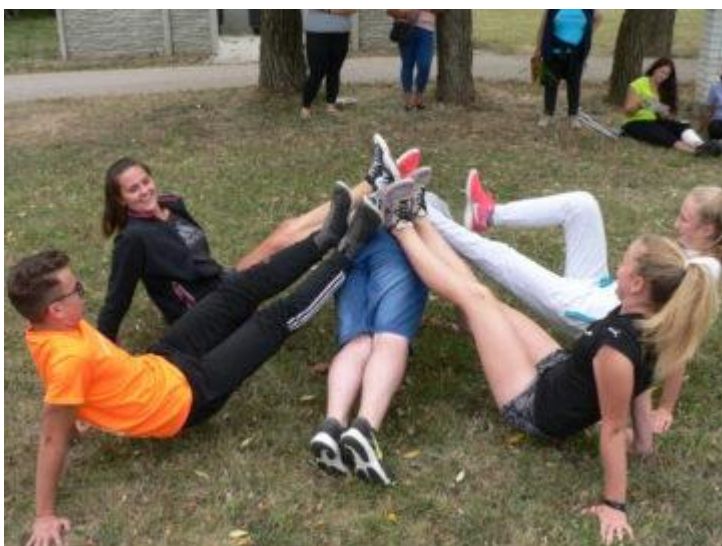
Obrázek 9: Hra ruce, nohy, tělo.