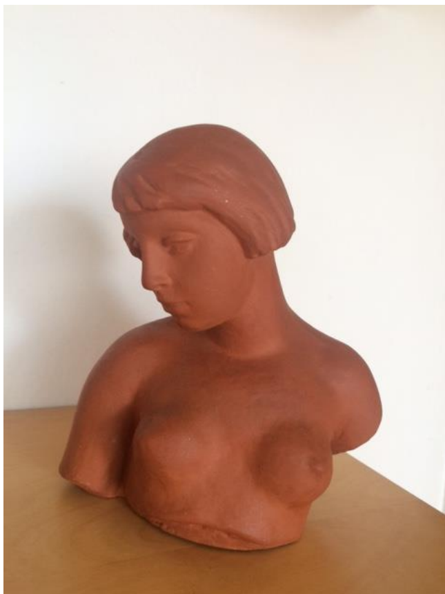
Obrázek 4, Gabriela Poláková - torzo, žákovská práce, 50 cm, 1929, SA rodiny Váchových