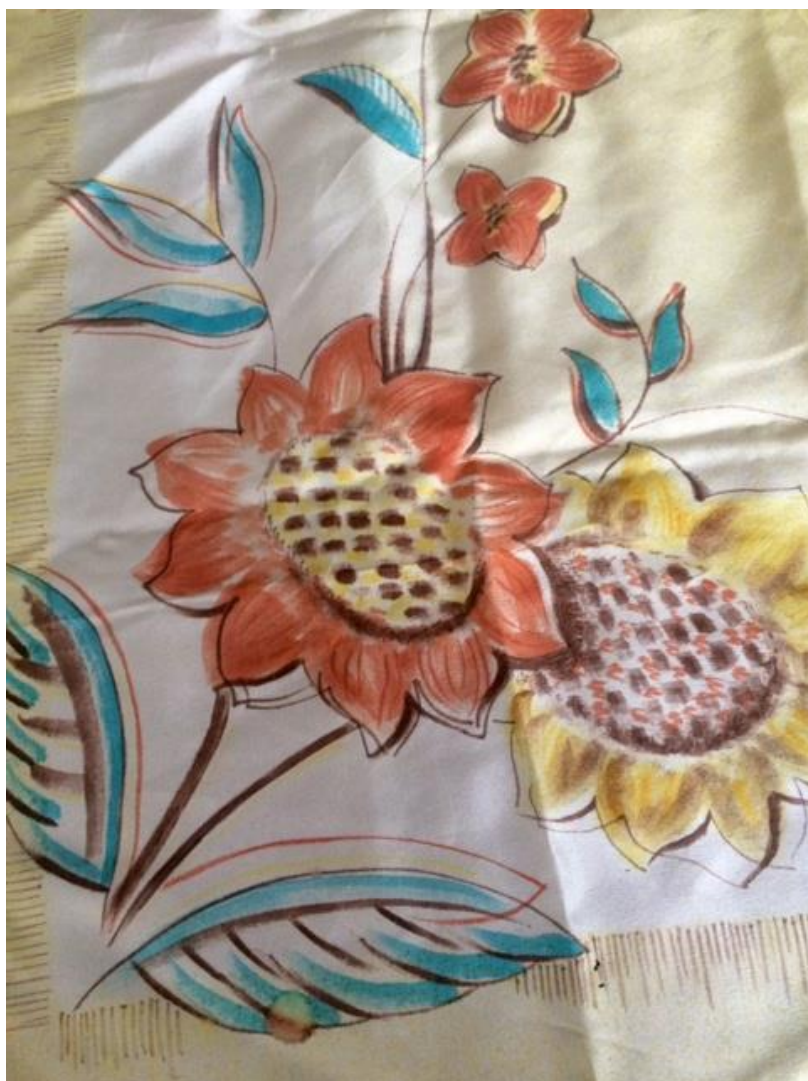
Obrázek 5, Gabriela Poláková - malba na hedvábí, 140 x 100 cm, 1940, SA rodiny Váchových, Foto: I. Vácha.