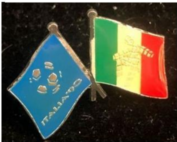
OBRÁZEK 26: jeden ze speciálních odznaků ze šampionátu