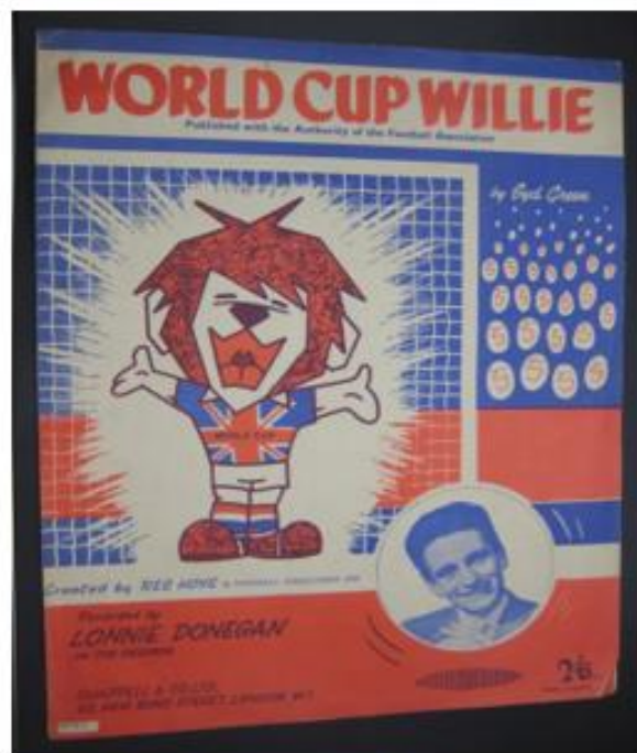
OBRÁZEK 6: obal na desku