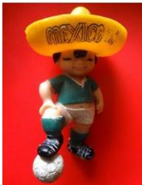
OBRÁZEK 11: přívěsek Juanito