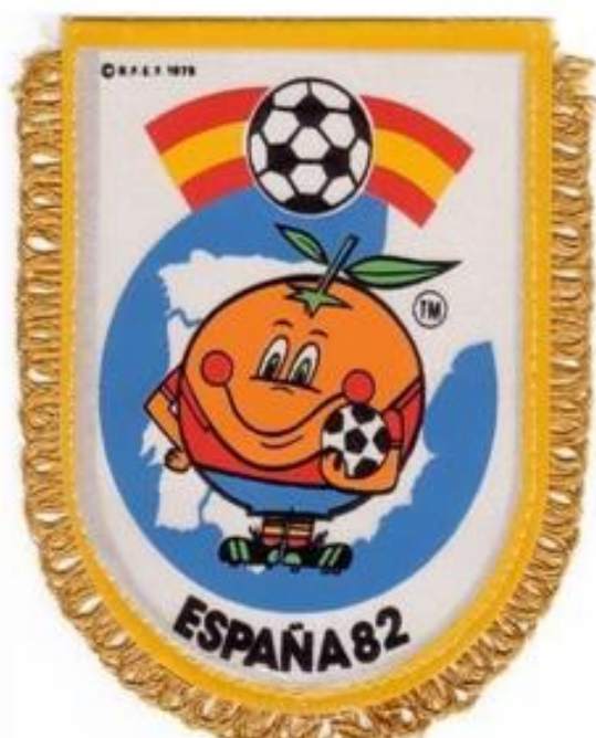
OBRÁZEK 21: vlajka s maskotem šampionátu