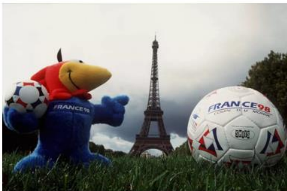
OBRÁZEK 34: maskot šampionátu s míčem