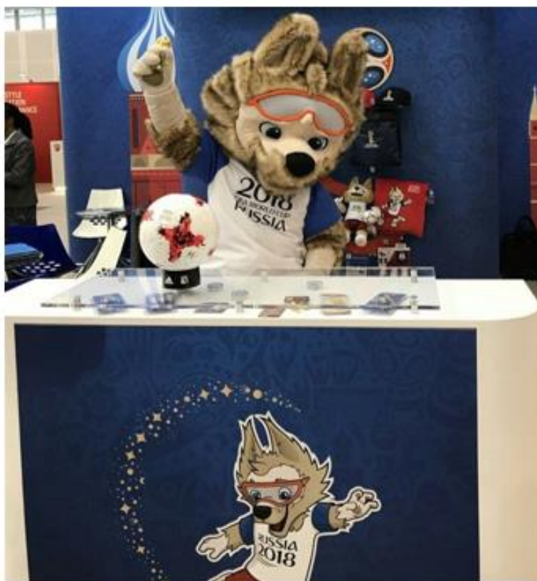
OBRÁZEK 48: maskot s míčem a suvenýry