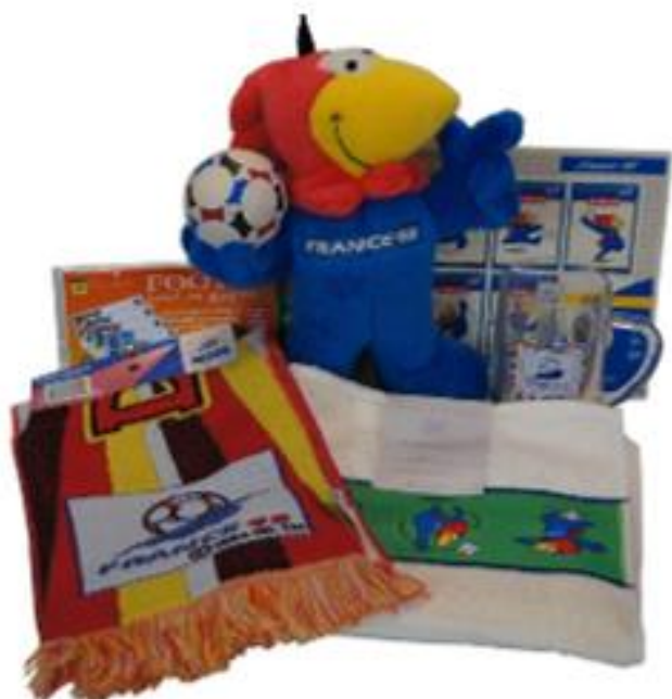
OBRÁZEK 32: suvenýry s maskotem šampionátu