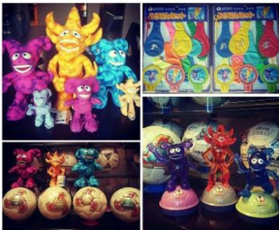
OBRÁZEK 37: suvenýry s maskoty