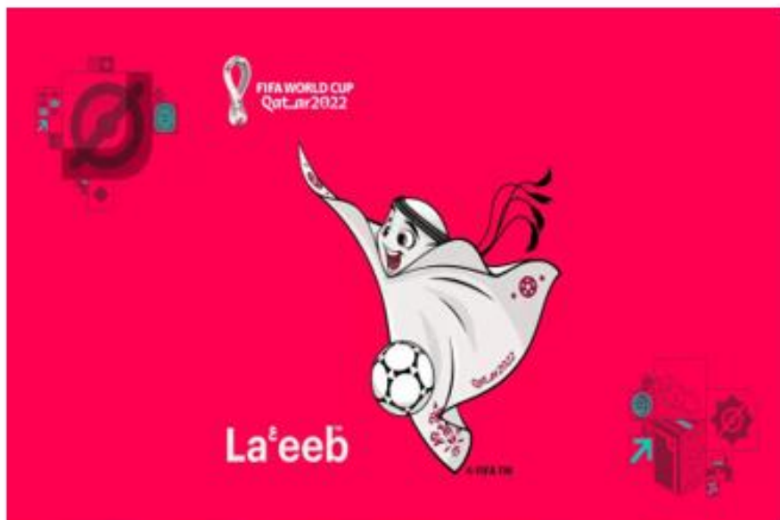
OBRÁZEK 50: maskot La'eeb