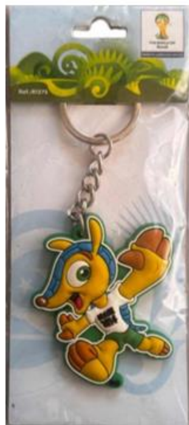
OBRÁZEK 45: přívěsek s Fulecem