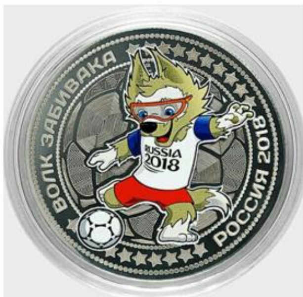
OBRÁZEK 49: maskot Zabivaka na pamětní minci