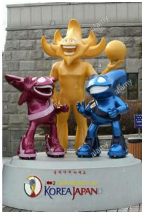
OBRÁZEK 36: sochy maskotů šampionátu