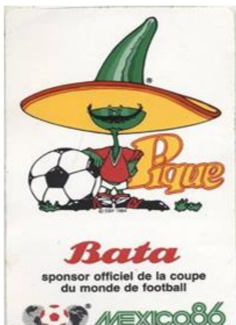
OBRÁZEK 24: prospekt se sponzorem šampionátu