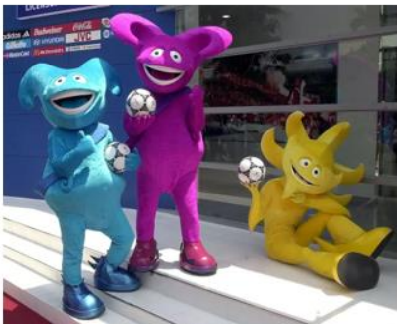
OBRÁZEK 35: maskoti šampionátu s míčem