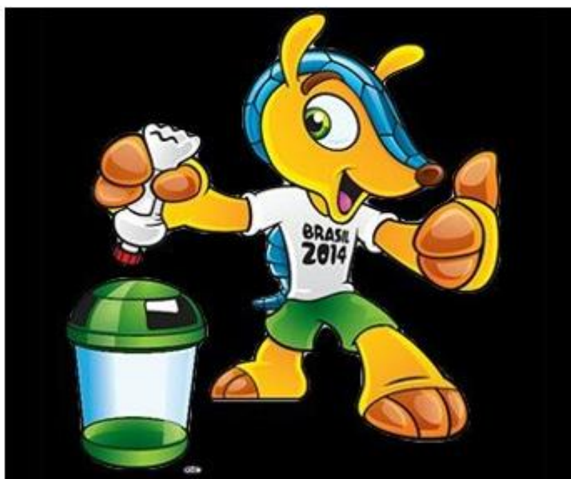
OBRÁZEK 46: Fuleco vybízí k třídění odpadků