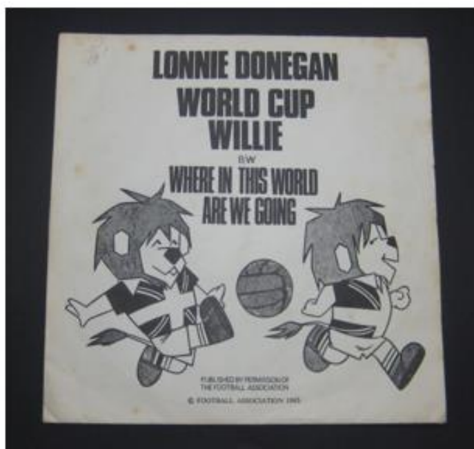
OBRÁZEK 8: oficiální píseň maskota