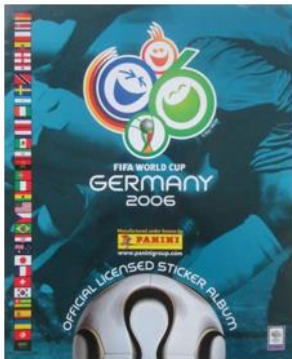
OBRÁZEK 39: album s logem šampionátu