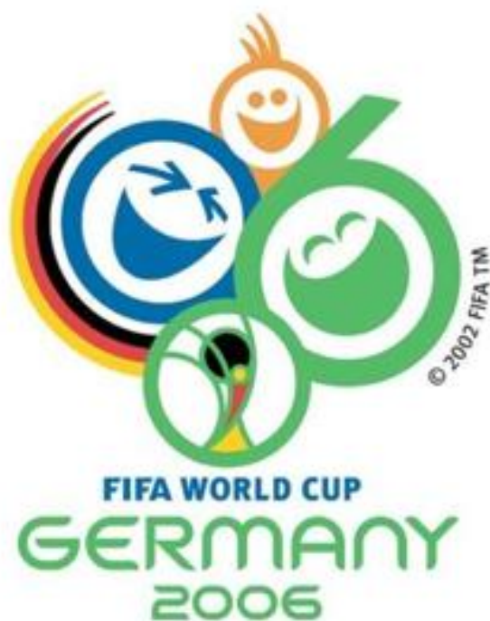
OBRÁZEK 40: maskot s logem šampionátu