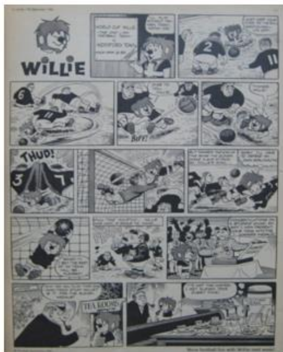
OBRÁZEK 5: komiks věnovaný Willimu