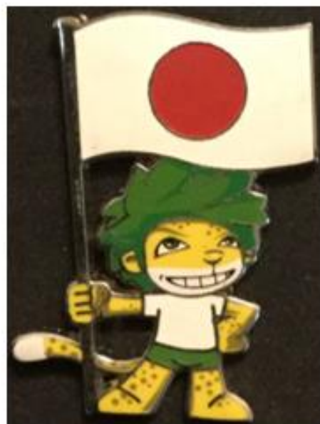
OBRÁZEK 42: odznak Zakumi s vlajkou