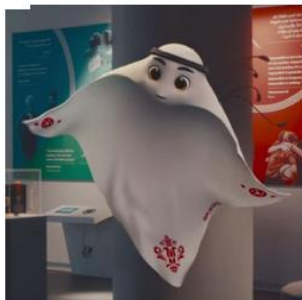
OBRÁZEK 51: La'eeb v expozici

ZDROJ: https://uk.pinterest.com/pin/248120260712594539/