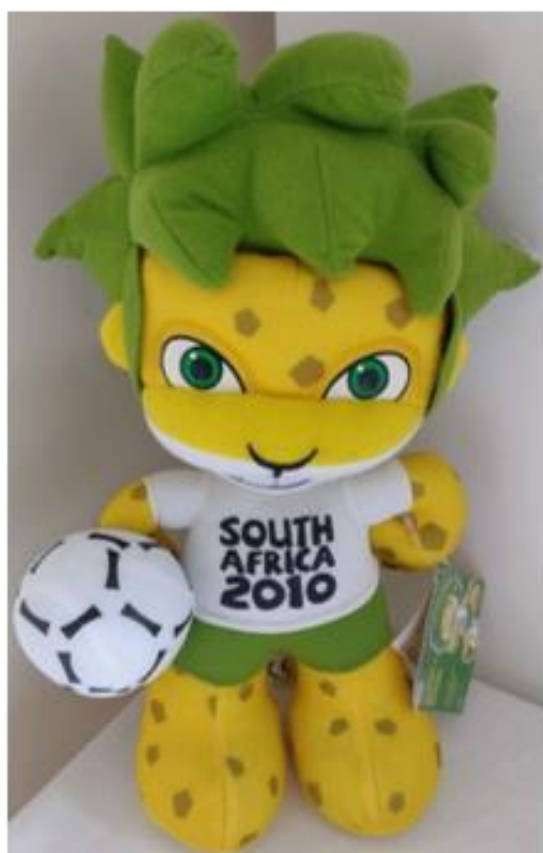
OBRÁZEK 43: suvenýr plyšák Zakumi