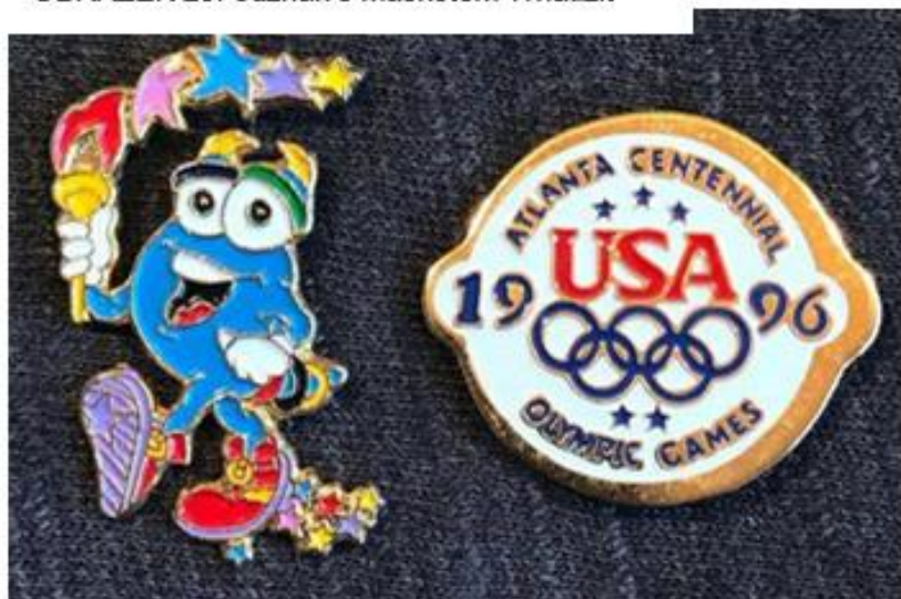
OBRÁZEK 29: odznak s maskotem Whatizit