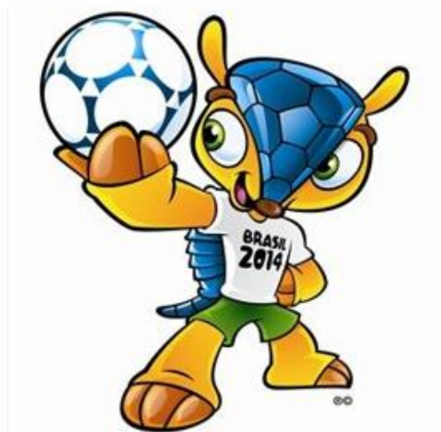
OBRÁZEK 44: maskot Fuleco s míčem