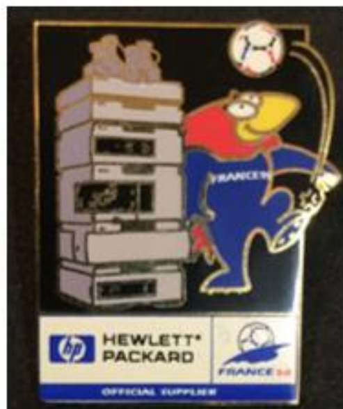
OBRÁZEK 33: odznak s maskotem