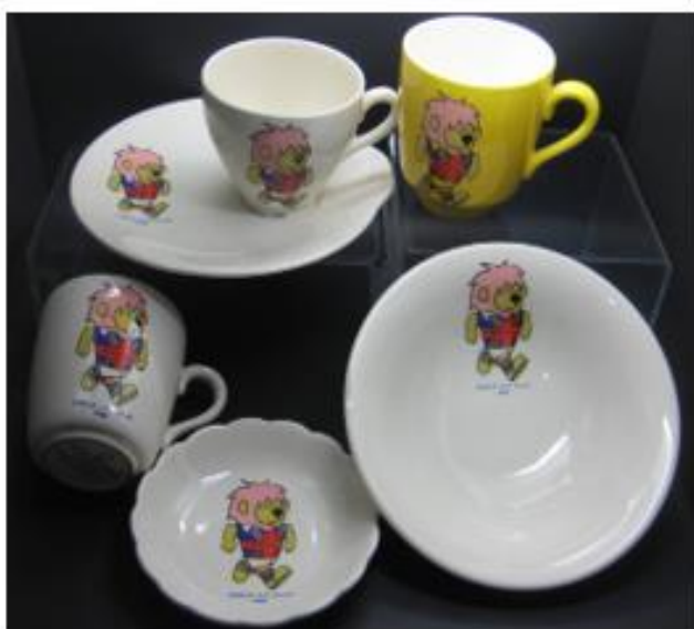
OBRÁZEK 3: talíře a hrnky s Willim