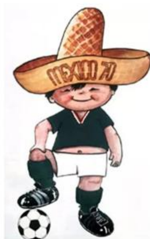
OBRÁZEK 10: maskot Juanito