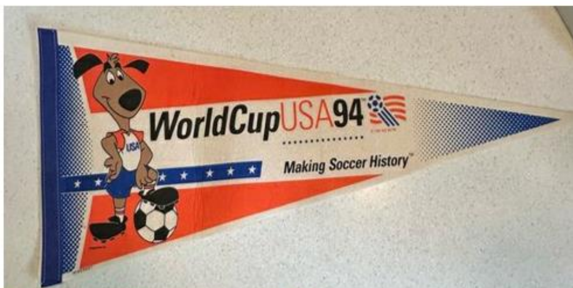
OBRÁZEK 31: suvenýr šampionátu