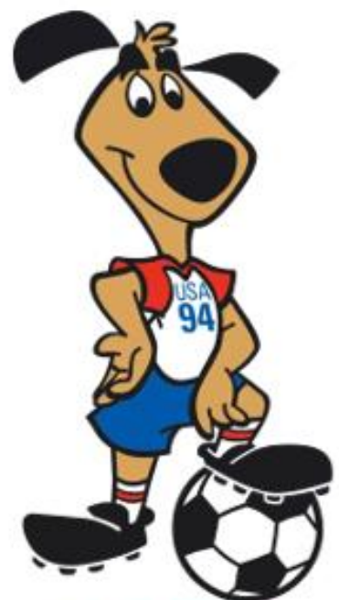
OBRÁZEK 30: maskot Striker