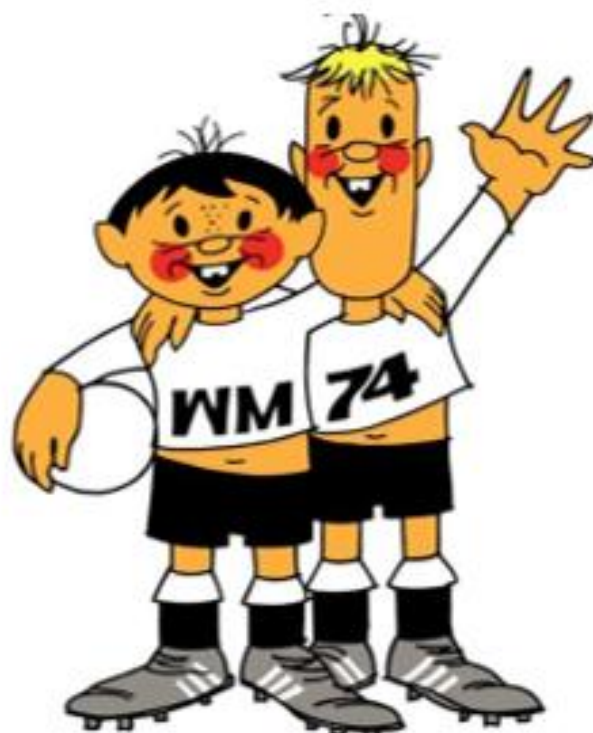
OBRÁZEK 13: maskoti Tip a Tap

ZDROJ: https://www.fifa.com/en/articles/world-cup-mascots-in-history