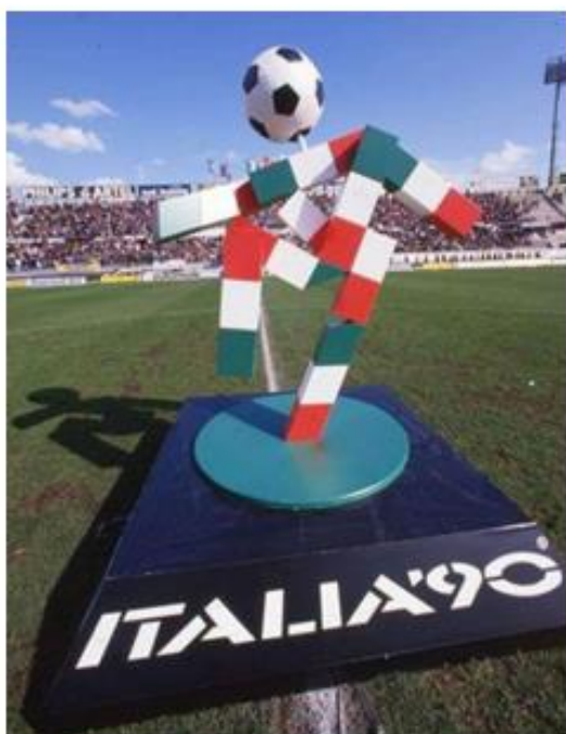
OBRÁZEK 28: socha maskota na stadionu