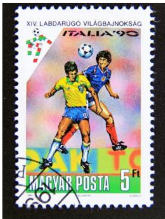
OBRÁZEK 27: známka s motivem šampionátu