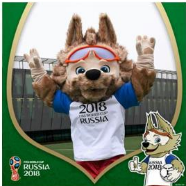
OBRÁZEK 47: maskot Zabivaka