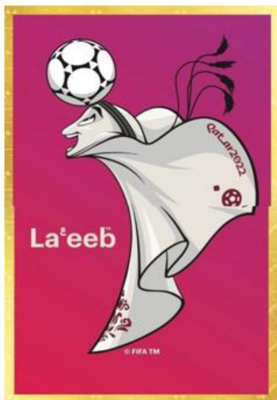
OBRÁZEK 52: La'eeb s míčem u hlavy