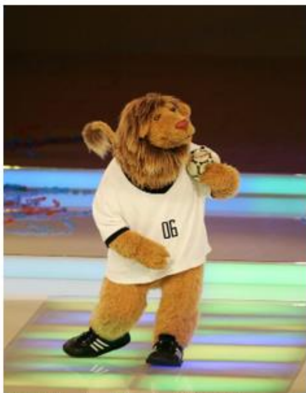
OBRÁZEK 38: maskot šampionátu