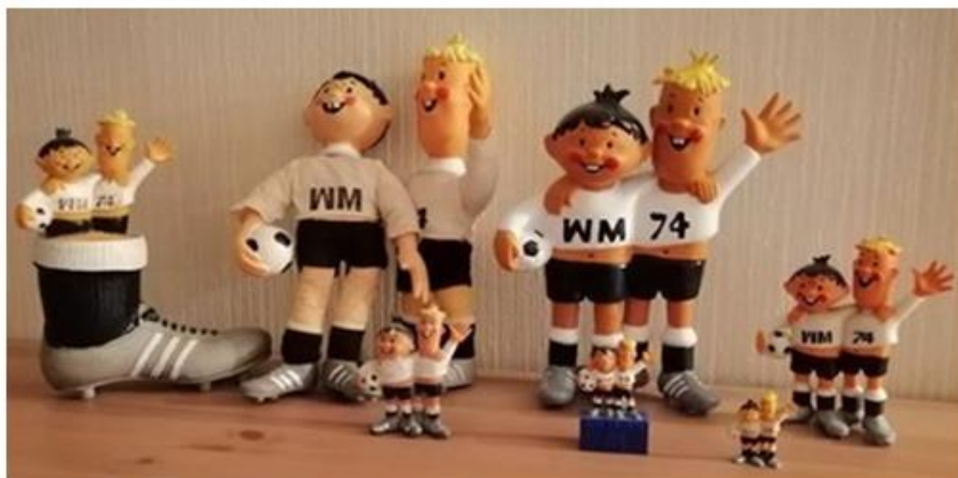
OBRÁZEK 14: figurky s Tipem a Tapem