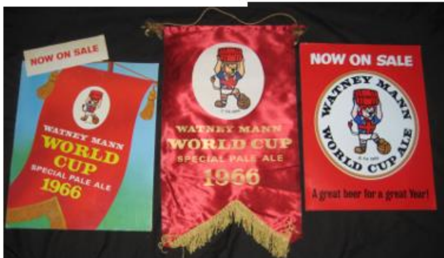
OBRÁZEK 2: vlajky s Willim