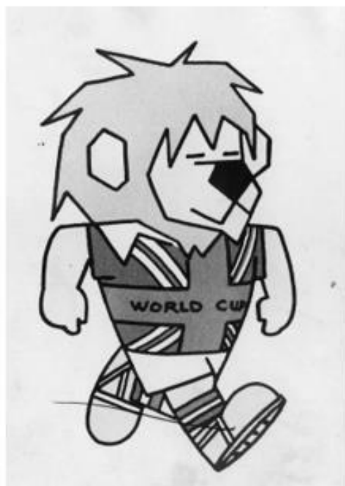
OBRÁZEK 7: maskot Willie