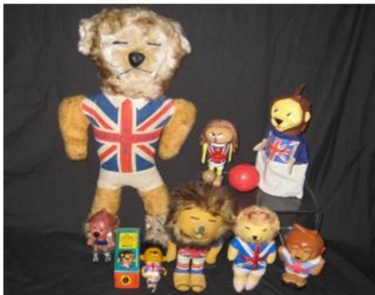
OBRÁZEK 4: figurky a plyšáci v podobě Williho