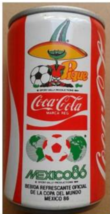
OBRÁZEK 22: plechovka Coca Coly