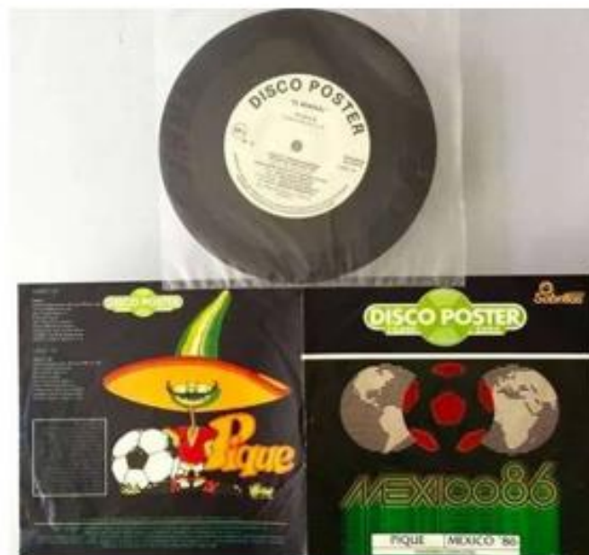
OBRÁZEK 25: deska s hymnou šampionátu