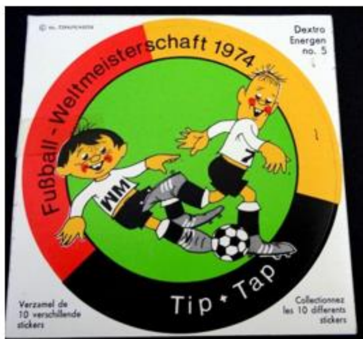
OBRÁZEK 12: samolepky s Tipem a Tapem