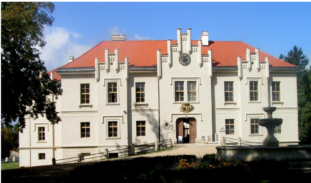
Obrázek 9: Zámek Hradiště u Blovic