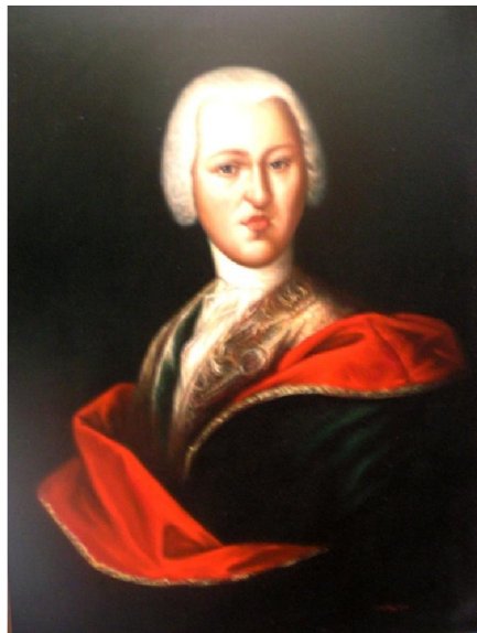
Obrázek 2: Prokop Krakovský z Kolovrat