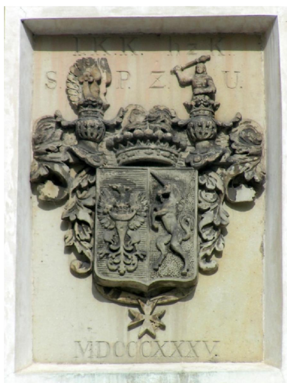
Obrázek 8: Sdružený erb Kolovratů a Jeníšků nad vstupní branou zámku Březnice