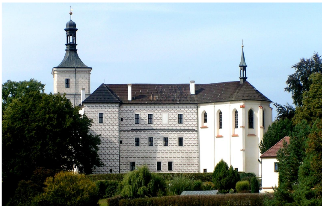
Obrázek 7: Zámek Březnice