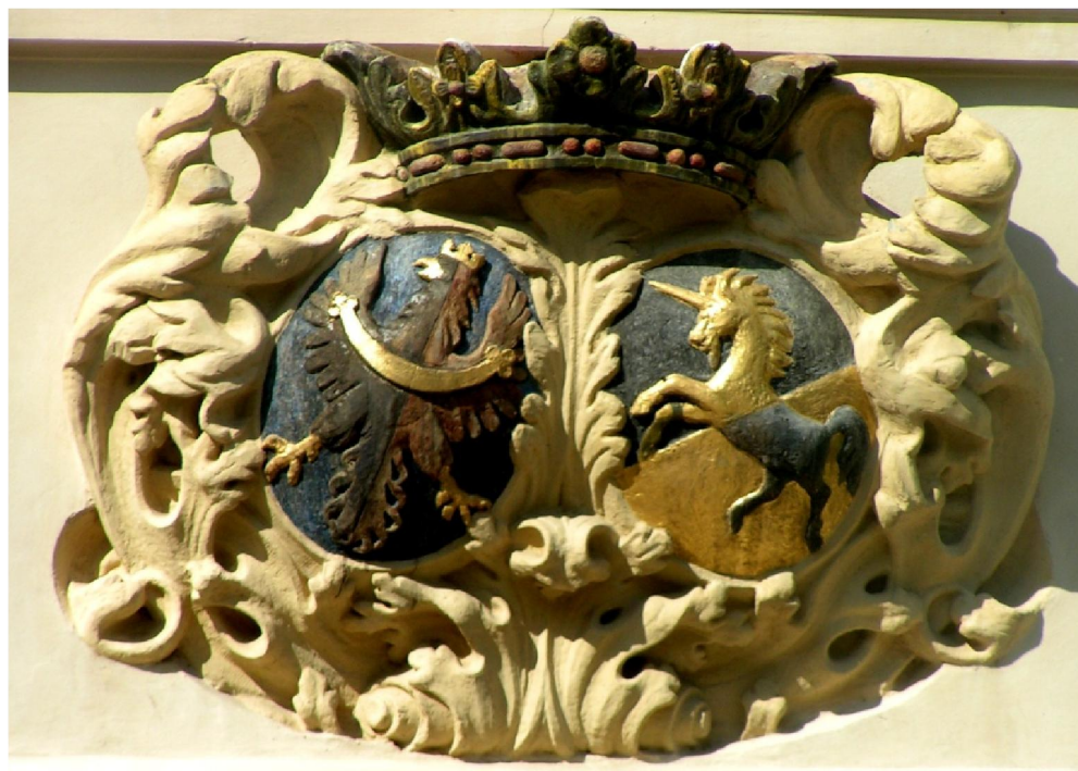
Obrázek 10: Sdružený erb Kolovratů a Jeníšků nad vstupem do zámku Hradiště u Blovic