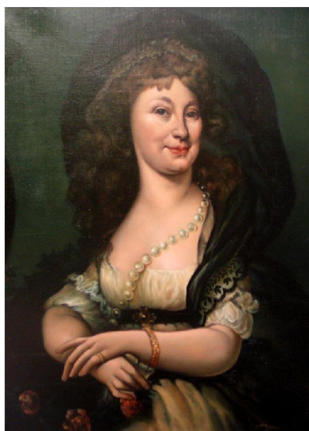
Obrázek 4: Walburga Krakovská z Kolovrat