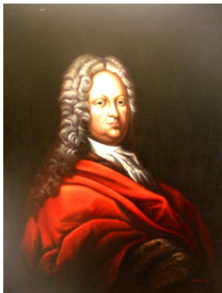
Obrázek 1: Vilém Albrecht Krakovský z Kolovrat