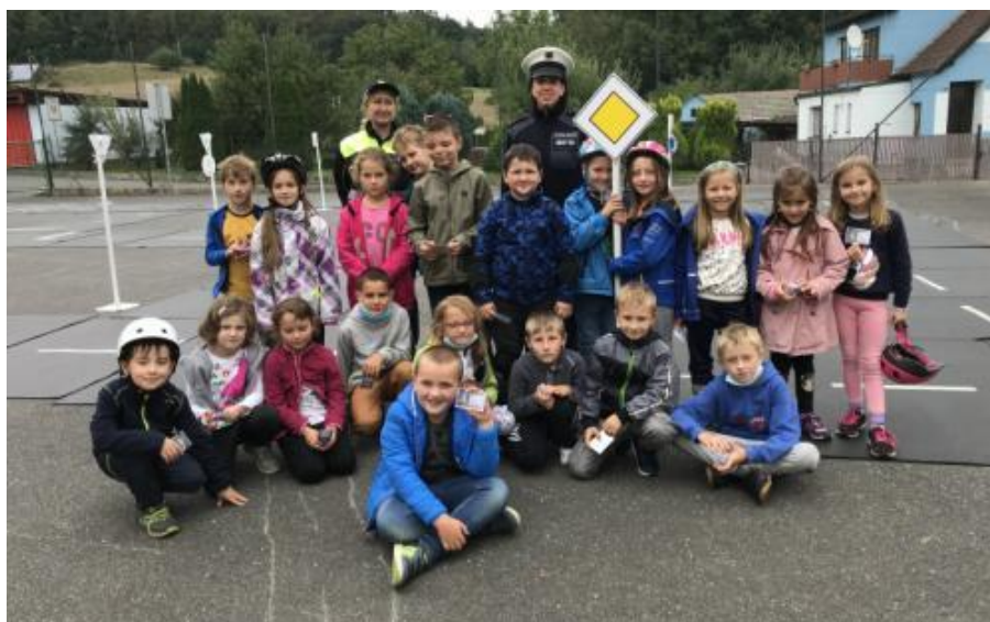
Obr. 2: Dopravní chaos na hřišti. Byla to bombastická akce! 29

Obrovskou výhodou těchto hřišť je navození dopravních situací jako za skutečného provozu. Tyto prostory mají vlastní křižovatky, semaforey, dopravní značky a přechody pro chodce. Děti si vyzkouší opravdový dopravní stav jako ve skutečnosti. Menší děti opět vítají situaci, kdy se rozdělí na policisty a účastníky silničního provozu a „policisté“ s pomocí preventistek a strážníků sledují své kamarády, zastavují je, udělují jim pokuty a podobně. Tyto akce se konají minimálně dvakrát ročně. Po celodenním zápolení se střídajícími se školami jsou prý preventistky obvykle „vyřízené“, ale zájem dětí jim dodává chuť do další práce.