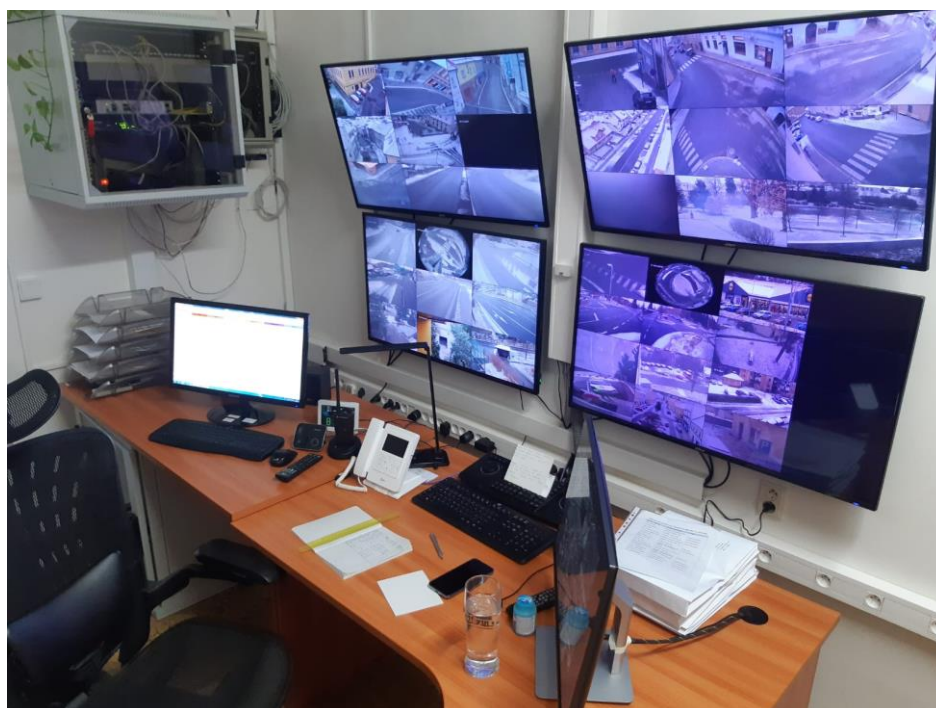
Obr. 6: Městský kamerový systém Vimperka 38