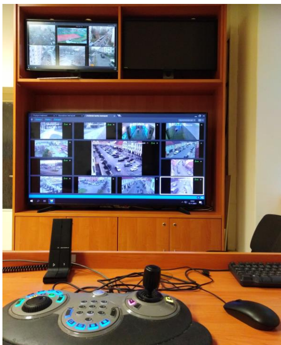
Obr. 5: Městský kamerový systém města Písek 35

Dalším zajímavým pomocníkem byla stanovená funkce osoby Domovník. Jejím úkolem je neustále monitorovat chod na tomto sídlišti, komunikovat s lidmi zde žijícími. Navštěvuje společné prostory v těchto domech, kontroluje kočárkárny, sklepy, upozorňuje občany na noční klid, nepořádek v okolí této lokality. Spolupracuje s asistenty prevence a samozřejmě se strážníky Obecní policie Písek.