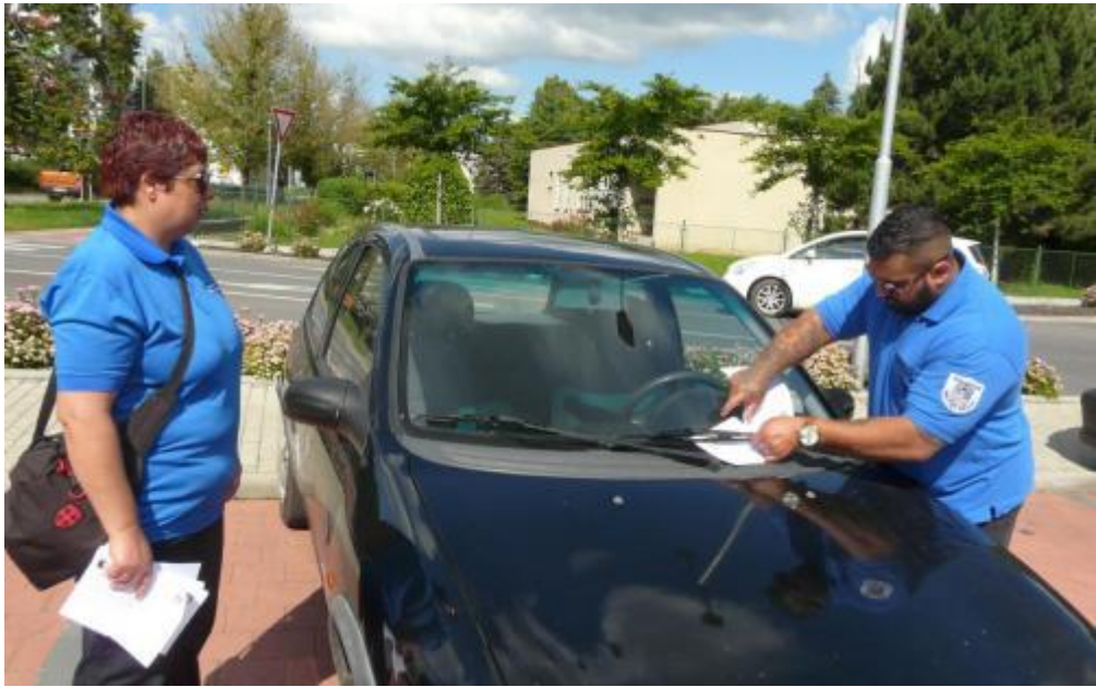
Obr. 4: Letní kampaň asistentů. Najdete lupiče nebo omalovánky? 32