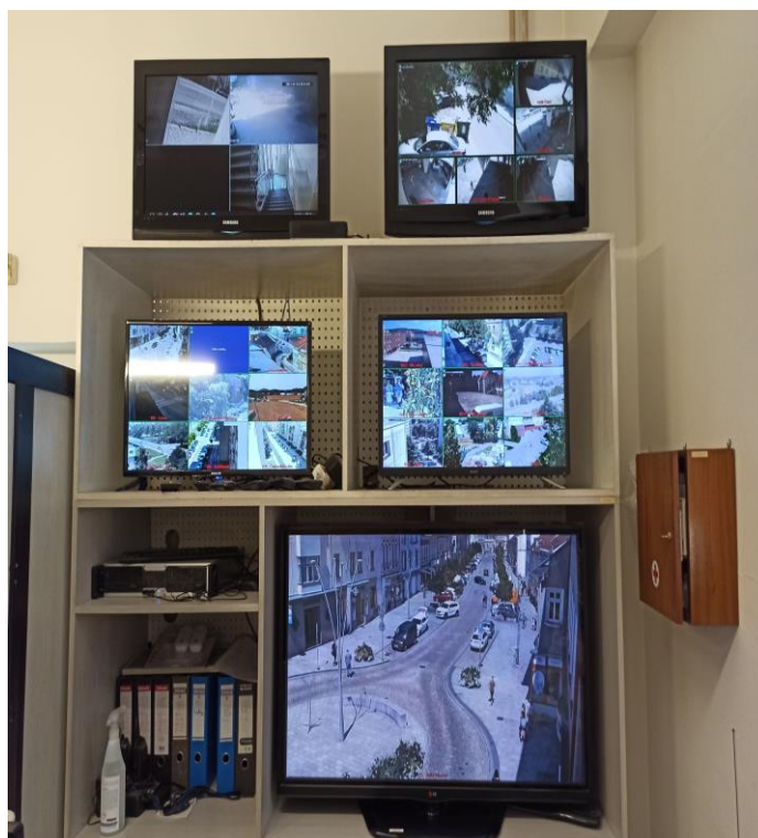
Obr. 3: Kamerový systém MP Strakonice 30

Nahrávky jsou k dispozici 9 dní zpětně a jsou využívány pro příslušné orgány jako důkazní materiál. Kamerový systém je udržován a provozován z prostředků rozpočtu města. Za dobu provozu jsou prováděny potřebné opravy, některé výměny kamer a kompletní obnova všech monitorů. Jednou ročně navíc systém prochází pravidelnou revizí.