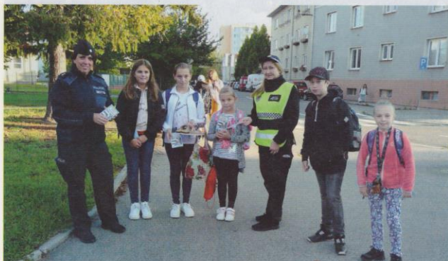
Policisté a strážníci se vrátili na přechody v blízkosti škol