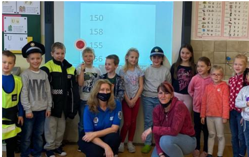
Obr. 1: Už prvňáčci by měli vědět, kde číhá nebezpečí 28