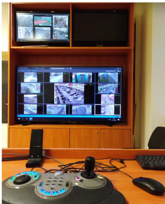
Obr. 5: Městský kamerový systém města Písek 35

Dalším zajímavým pomocníkem byla stanovená funkce osoby Domovník. Jejím úkolem je neustále monitorovat chod na tomto sídlišti, komunikovat s lidmi zde žijícími. Navštěvuje společné prostory v těchto domech, kontroluje kočárkárny, sklepy, upozorňuje občany na noční klid, nepořádek v okolí této lokality. Spolupracuje s asistenty prevence a samozřejmě se strážníky Obecní policie Písek.