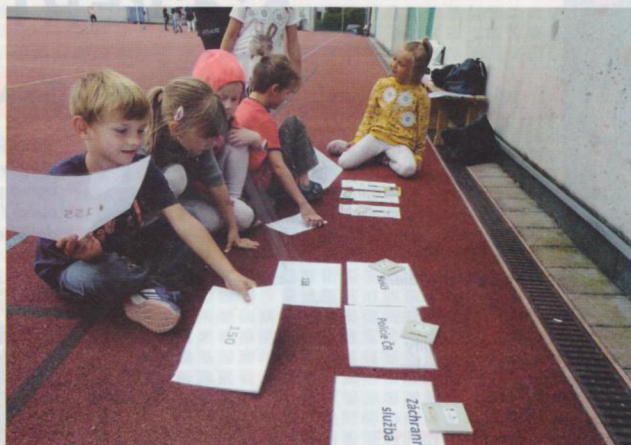
O tom, jak správně a bezpečně přecházet silnici, jsou besedy šité na míru prvňáčkům

V prvních třídách je beseda o bezpečnosti v provozu doplněna ještě o jednu vážnou situaci, s níž se mohou děti venku setkat. Na závěr besedy, aniž by děti dopředu tušily, o co půjde, sehraje preventistka společně s nimi divadelní skeč – ve třídě pohodí injekční stříkačku a začne se divit, co že to je. Reakce dětí jsou ve skrze povzbudivé. Jen v několika případech chtěly na nalezenou stříkačku sahat a zkoumat ji. Většinou ale po chvíli přijdou s nápadem, že musí informovat paní učitelku. Ta zavolá