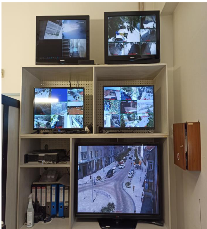
Obr. 3: Kamerový systém MP Strakonice 30

Nahrávky jsou k dispozici 9 dní zpětně a jsou využívány pro příslušné orgány jako důkazní materiál. Kamerový systém je udržován a provozován z prostředků rozpočtu města. Za dobu provozu jsou prováděny potřebné opravy, některé výměny kamer a kompletní obnova všech monitorů. Jednou ročně navíc systém prochází pravidelnou revizí.