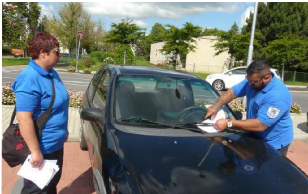
Obr. 4: Letní kampaň asistentů. Najdete lupiče nebo omalovánky? 32