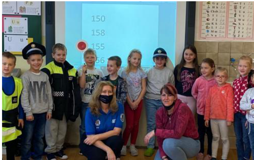
Obr. 1: Už prvňáčci by měli vědět, kde číhá nebezpečí 28