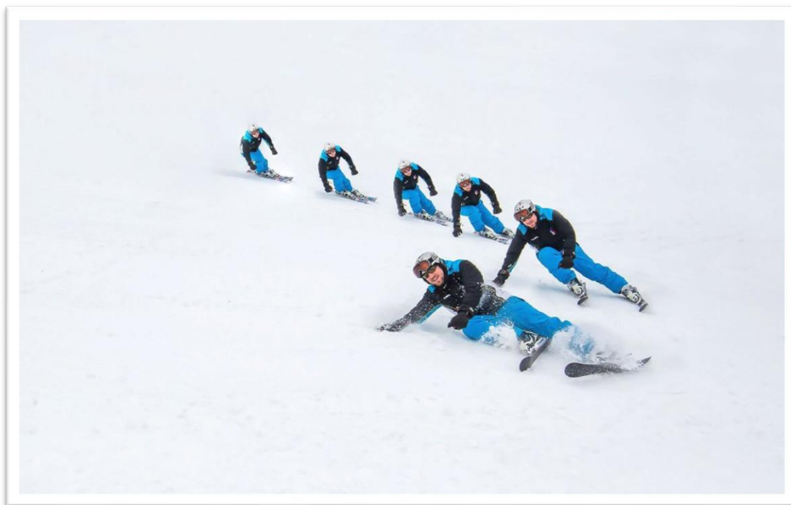
Obrázek 3 - kinogram fun carvingového oblouku (ABC, 2006)

Chyby projevující se při fun carvingových obloucích, týkající se postavení lyží, jsou podobné jako u předchozích oblouků. Největším rozdílem zde je jízda bez holí se snahou o dotyk se sněhem, ze kterých vznikají chyby jako příliš velký náklon sjezdaře, nebo snaha o dotyk ruky se sněhem při příliš nízké rychlosti, kdy odstředivá síla nedosahuje požadovaných hodnot.