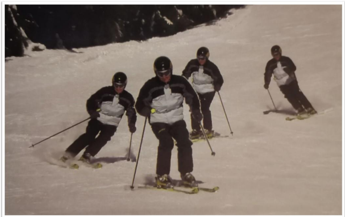
Obrázek 1 - Kinogram paralelního oblouku (Štumbauer, Vobr, 2005, s. 67)

Paralelní oblouky podle techniky APUL se liší pouze v zapichování hole, ke kterému dochází až na konci zdvihu těla.