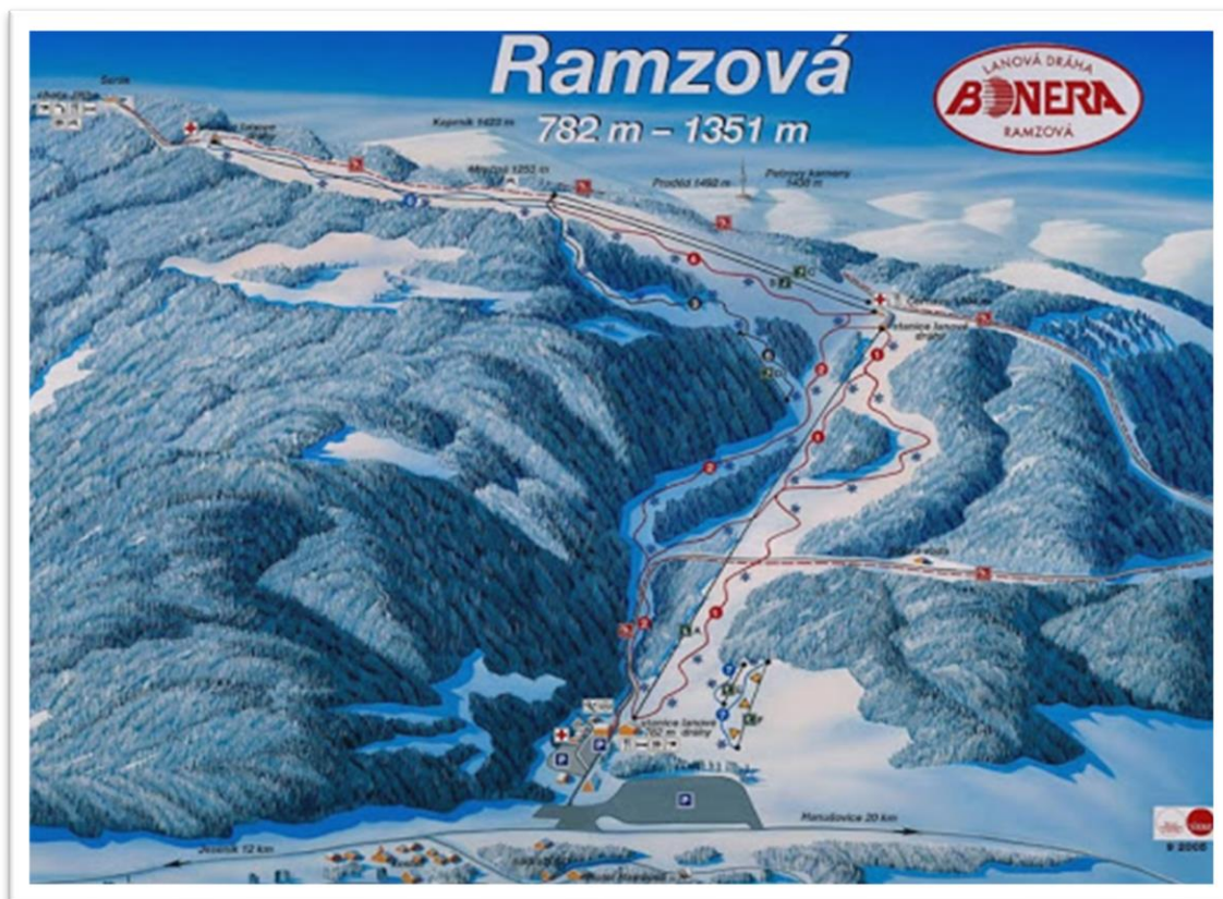
Obrázek 6 Mapa skiareálu Ramzová

kapacitou 500 osob za hodinu o celkové délce 1880 m. Převážná kapacita se tak zvýší na 3 190 osob za hodinu. Středisko disponuje středně širokými bezpečnými sjezdovými tratěmi, které jsou v celku odkloněné. Sjezdové tratě, které zde nalezneme, jsou vhodné pro všechny vyznavače lyžování, skialpinismu a snowboardingu, ale vyznavači carvingu si to zde, z mého skromného pohledu příliš neužijí.