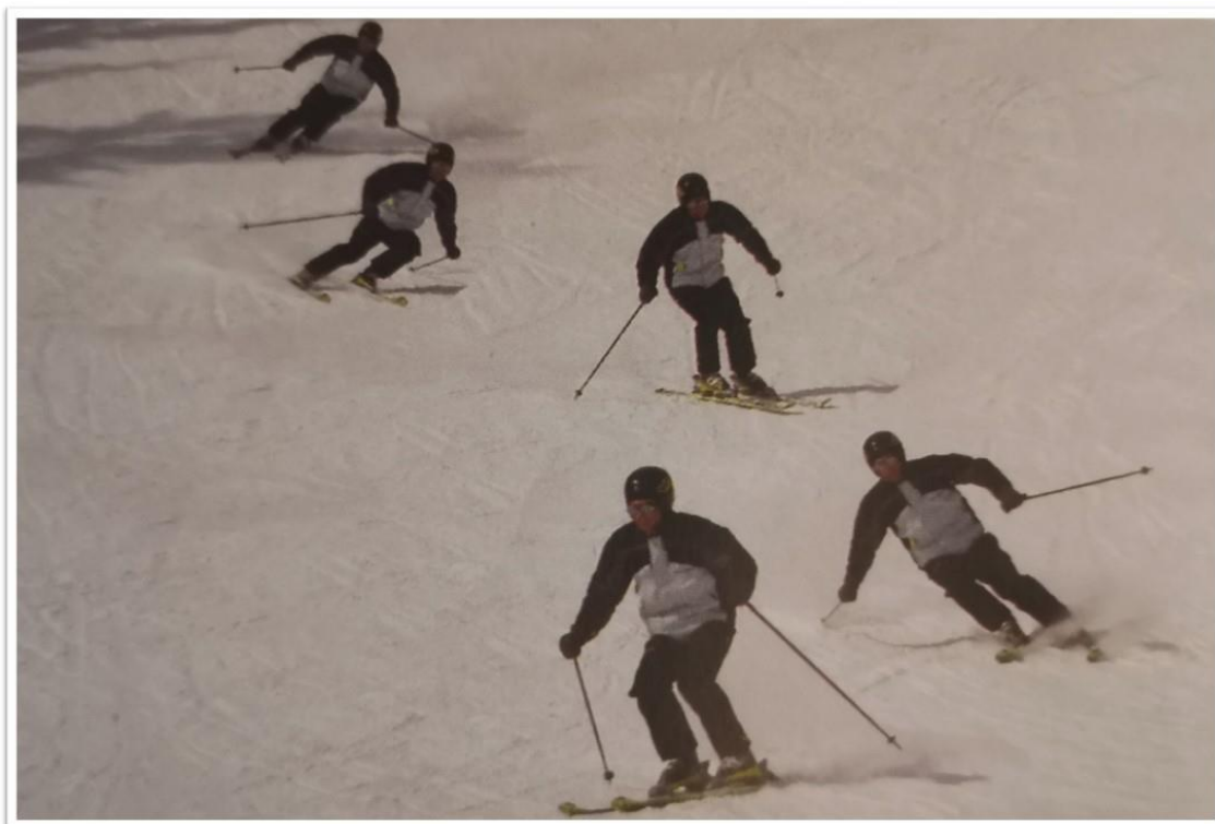
Obrázek 2 - Kinogram základních carvingového oblouku (Štumbauer, Vobr, 2005, s. 90)