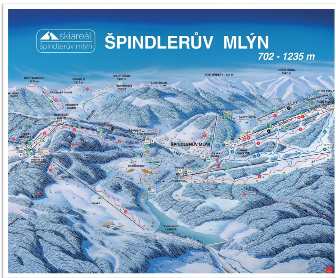
Obrázek 4 Mapa skiareálu Špindlerův mlýn ( www.skiareal.cz )