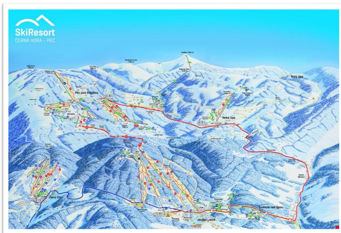
Obrázek 5 Mapa skiresortu Černá hora – Pec ( www.skiresort.cz )