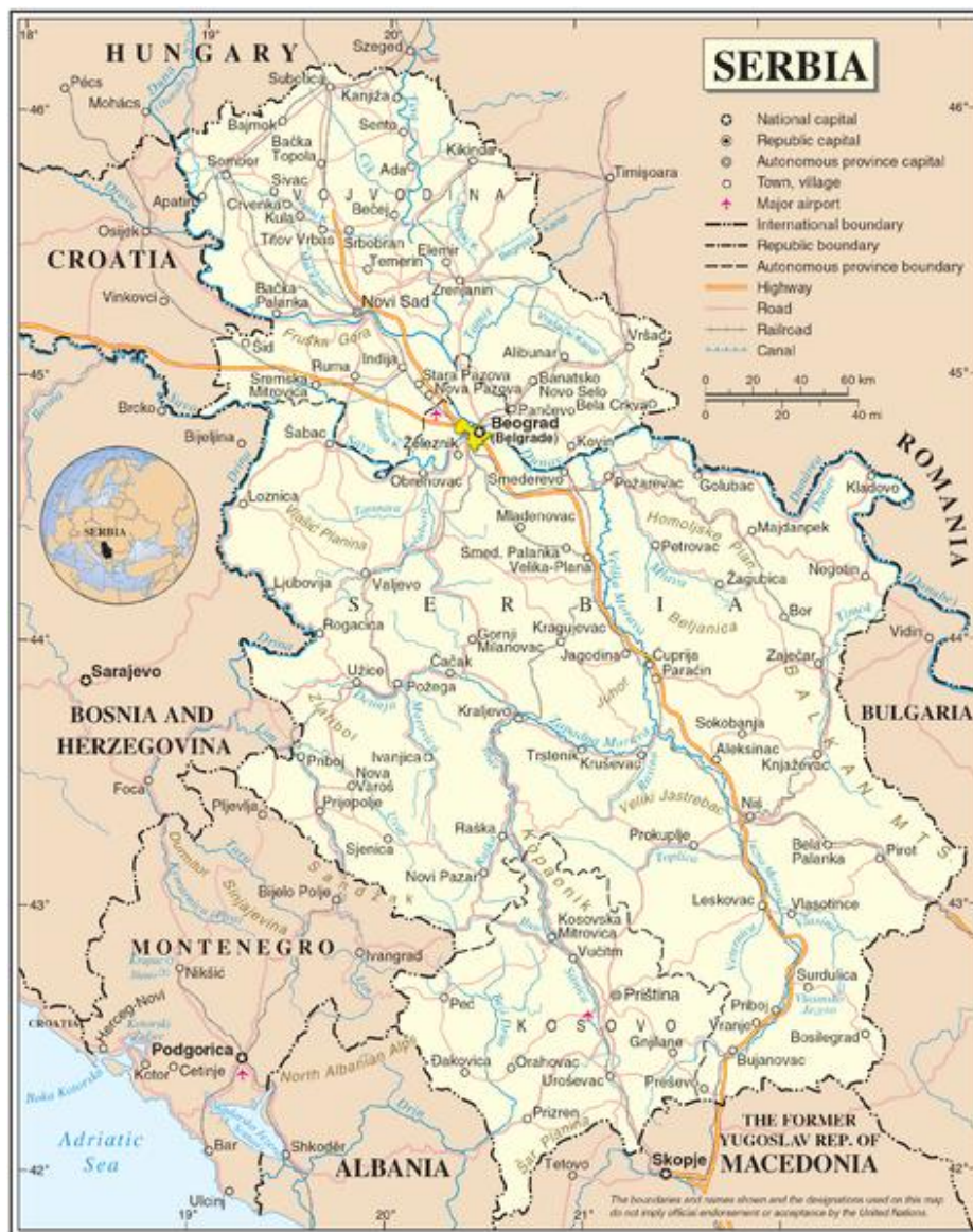
Obr. 4 Srbsko s Kosovom