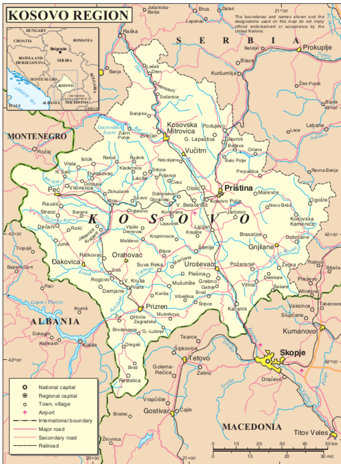
Obr. 7 Kosovo