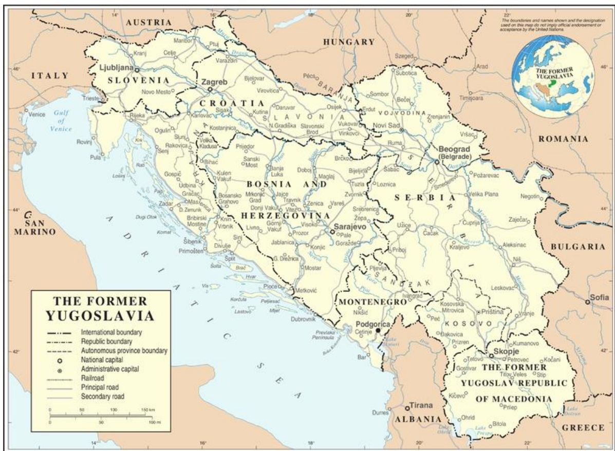
Obr. 3 Bývalá Jugoslávie