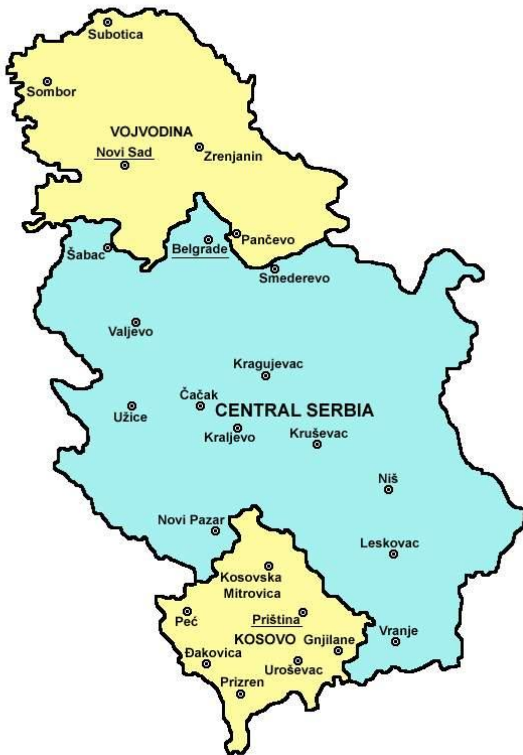
Obr. 2 Autonomní kosovsko-metochijský kraj