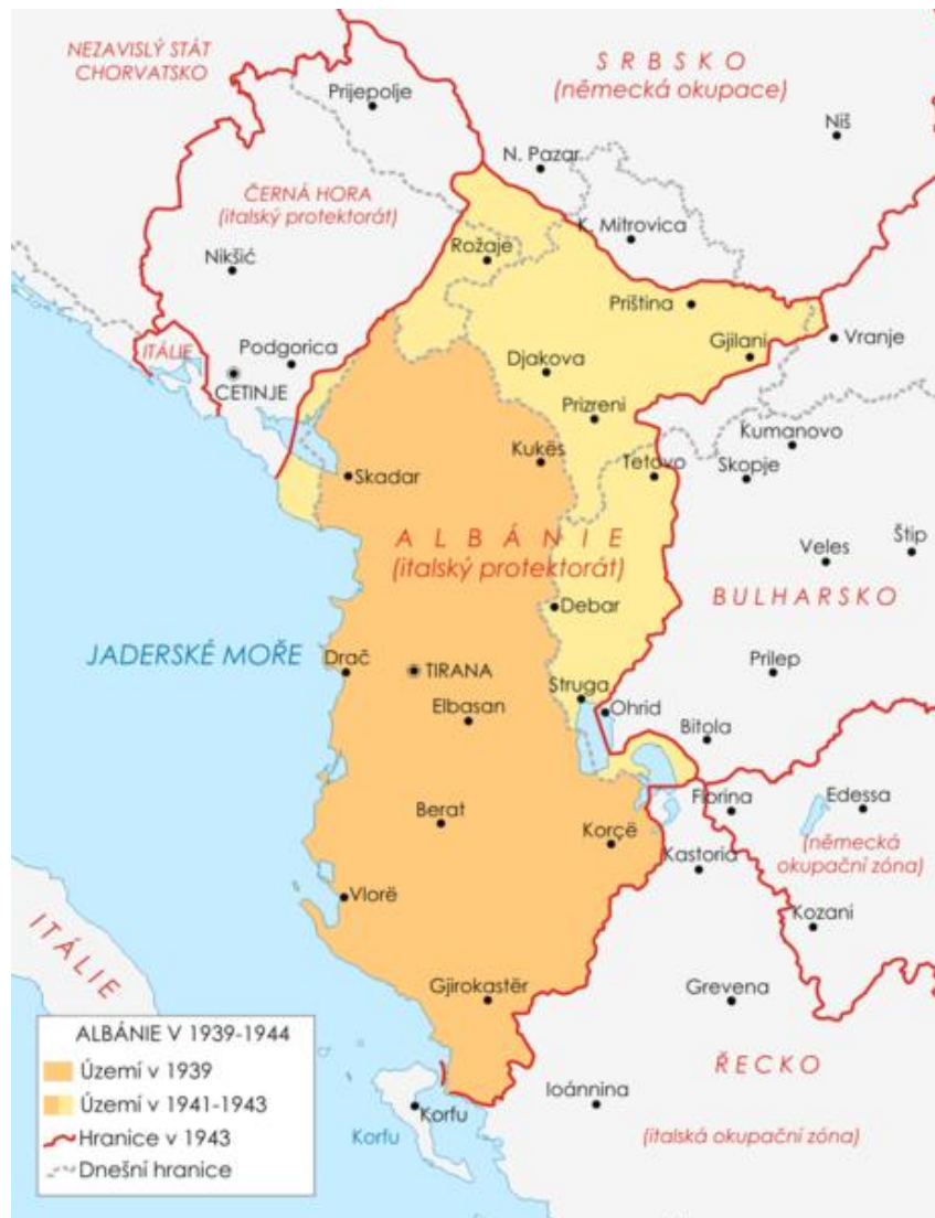
Obr. 1 Italská, německá a bulharská okupační správa nad Kosovem během druhé světové války