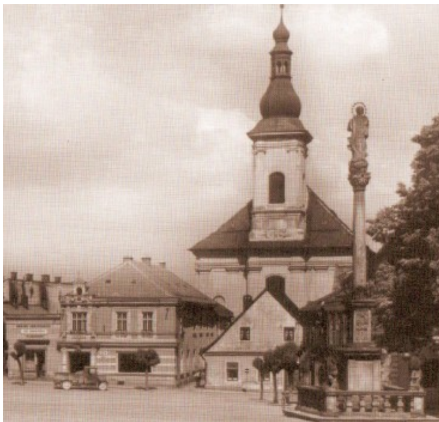
Příloha č.6 Farní kostel sv. Bartoloměje