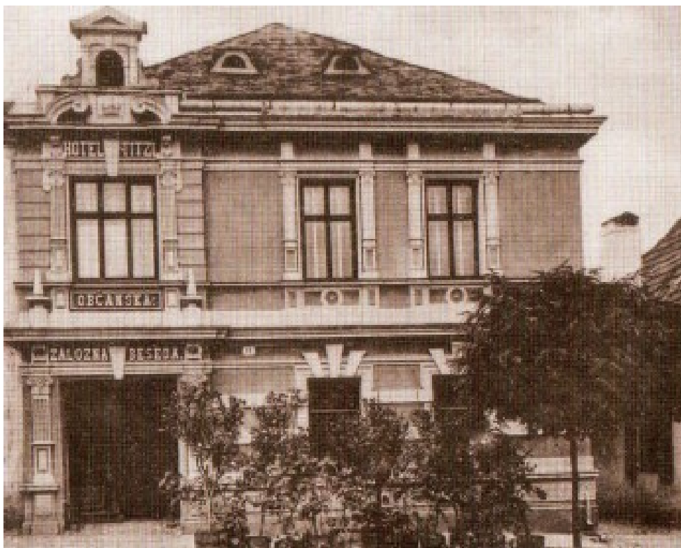
Příloha č. 4 Budova Občanské besedy