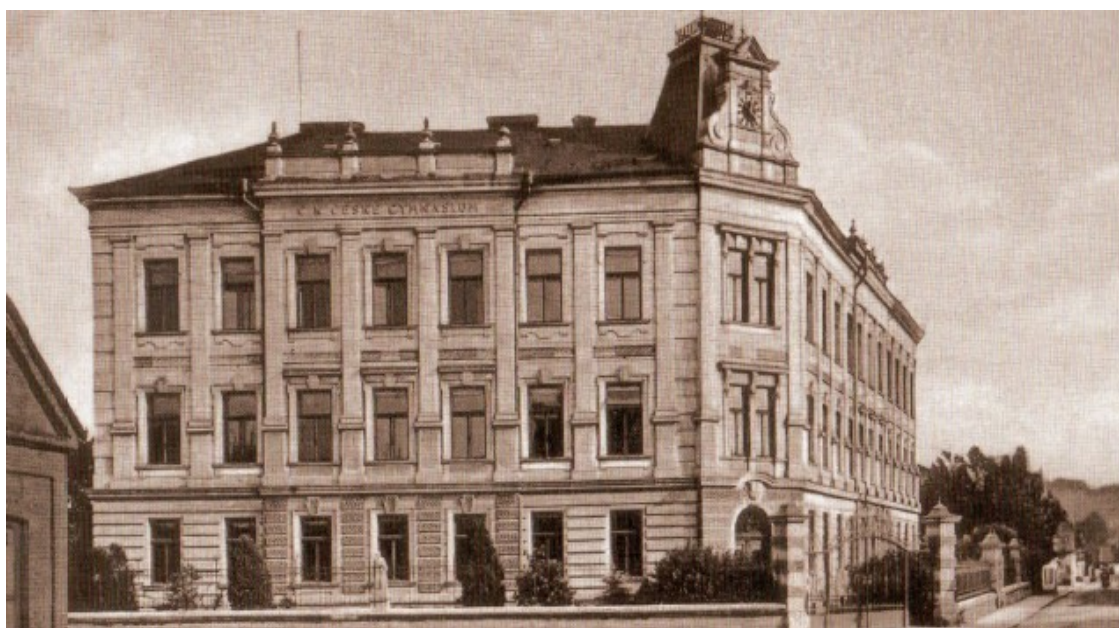
Příloha č.5 Budova gymnázia