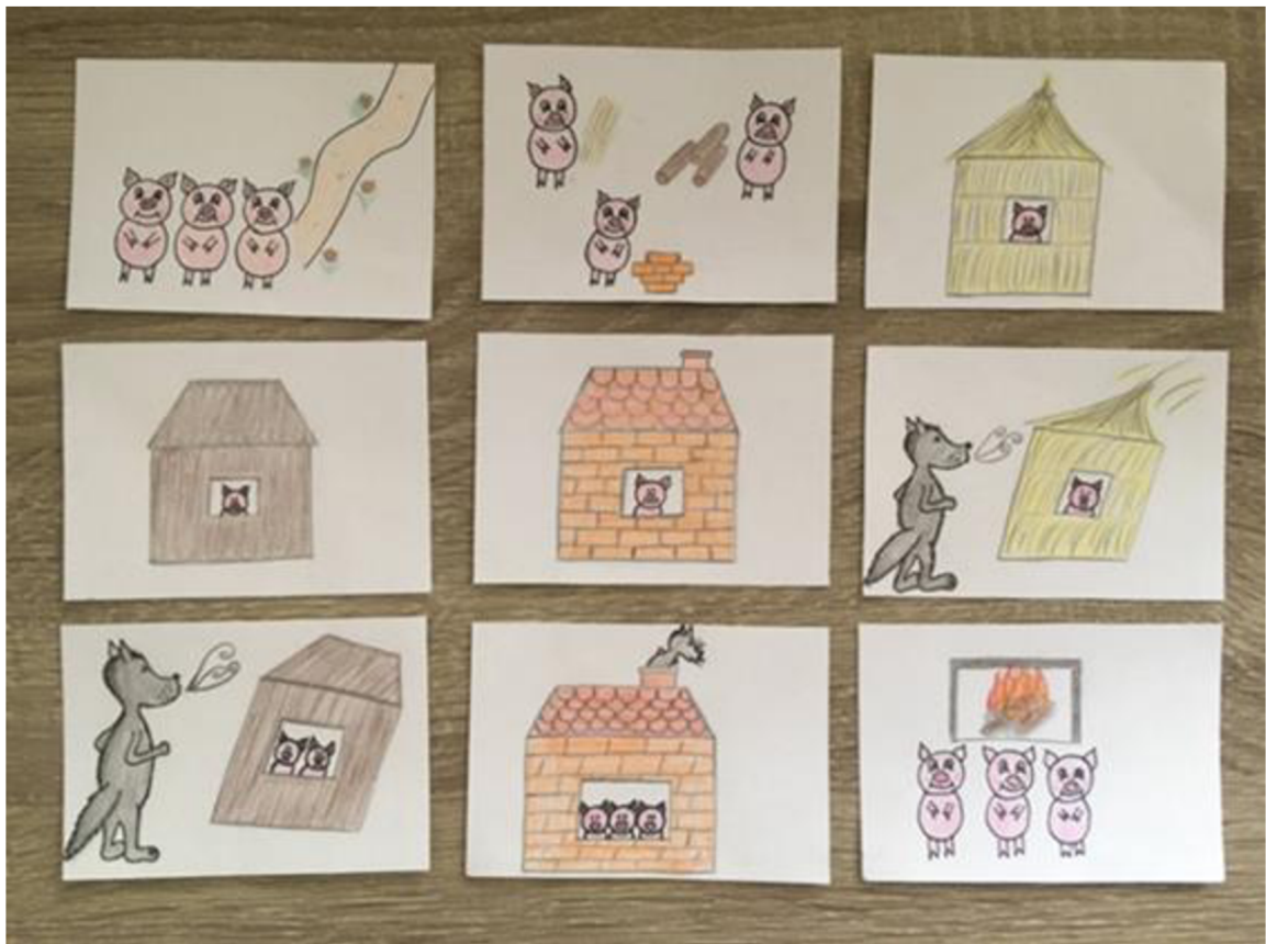
Obrázek 1 Kartičky k pohádce Tři prasátka