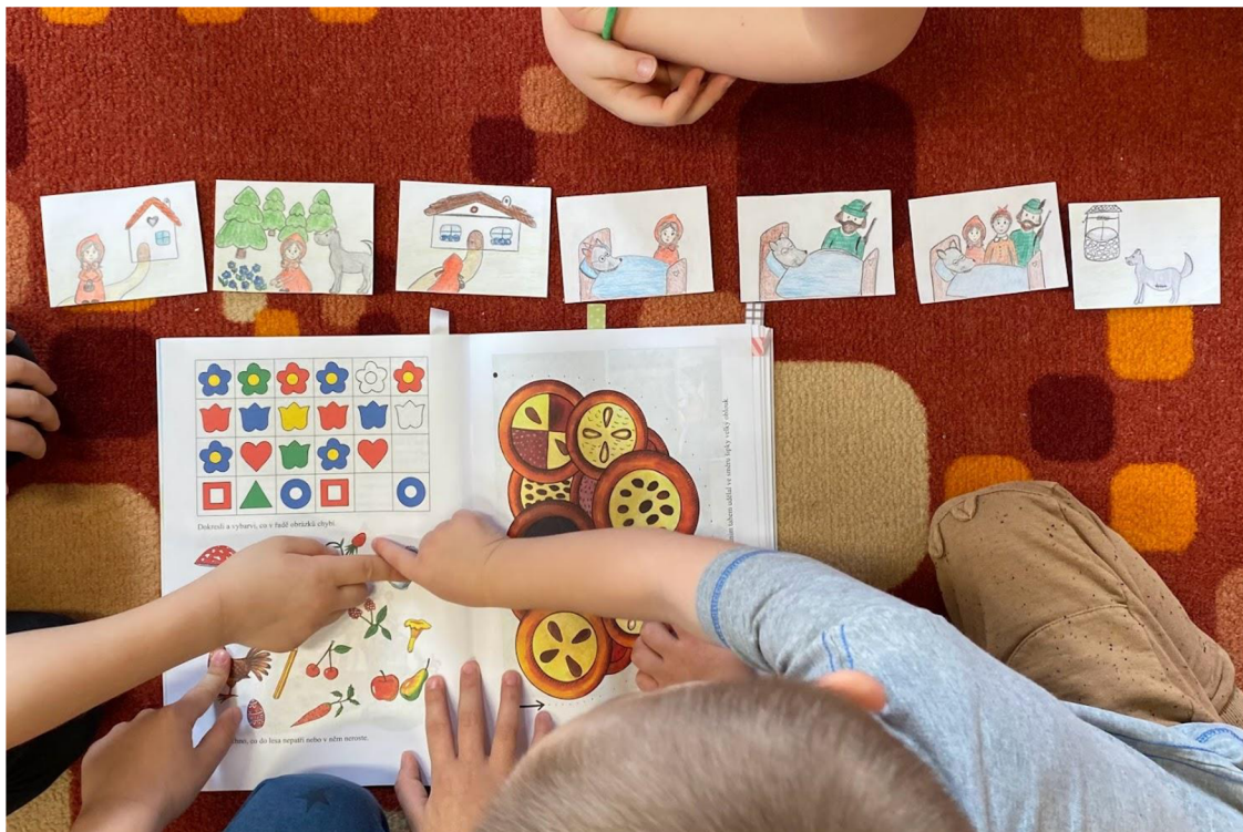
Obrázek 2 Práce s pohádkou Červená Karkulka