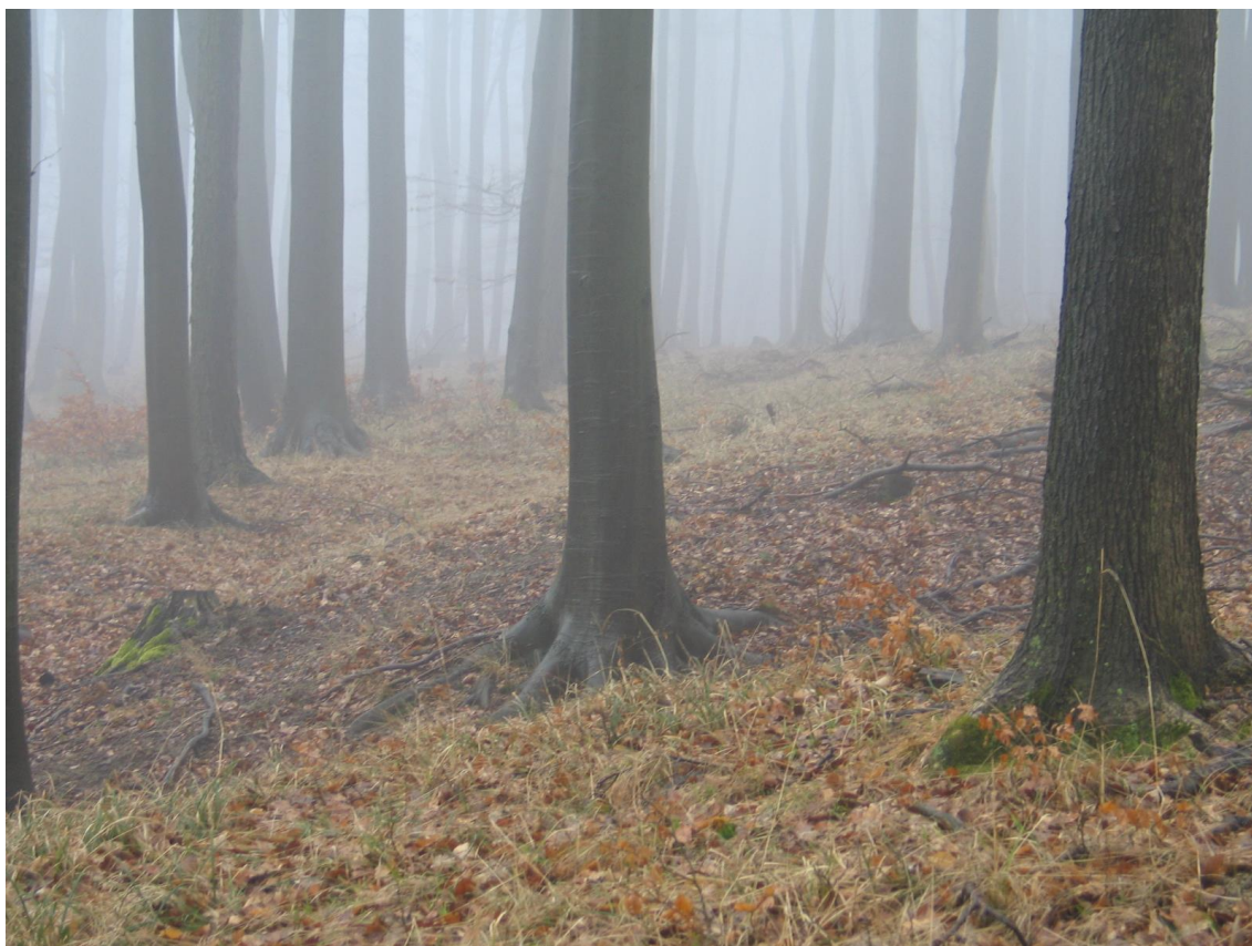
Foto 15 Sbíhající se úvozy, lokalita Db.