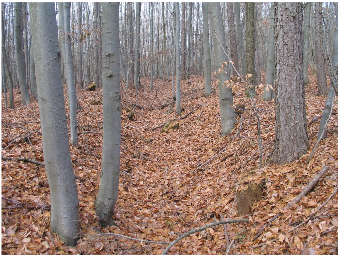
Foto 11 Nejvzdálenější úvoz od komunikace, lokalita Bb. (Opravil T., prosinec 2015)