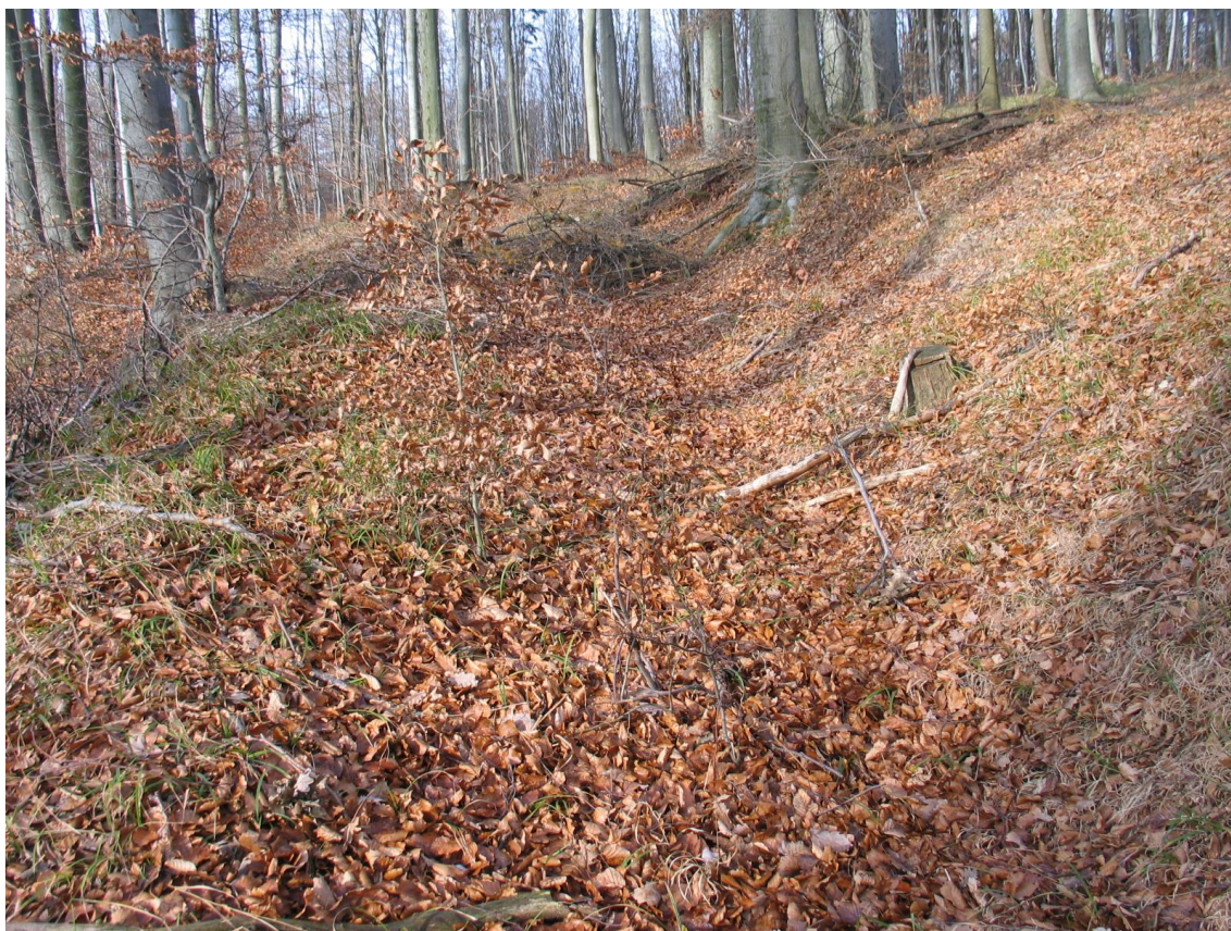
Foto 7 Úvozy často prozradí nahromaděné listí ze svahu, lokalita Ba. (Opravil T., prosinec 2015)