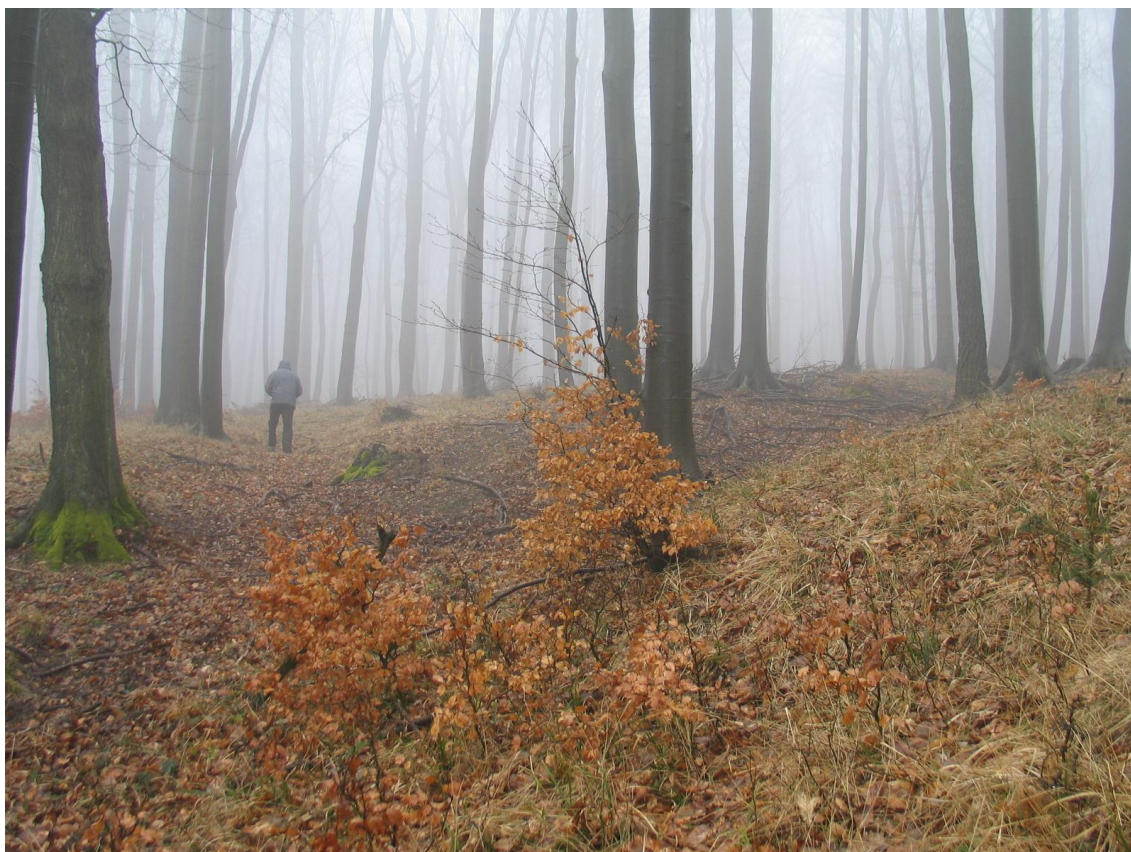
Foto 14 Rozsáhlý svazek zachycený od krmelce, lokalita Db.