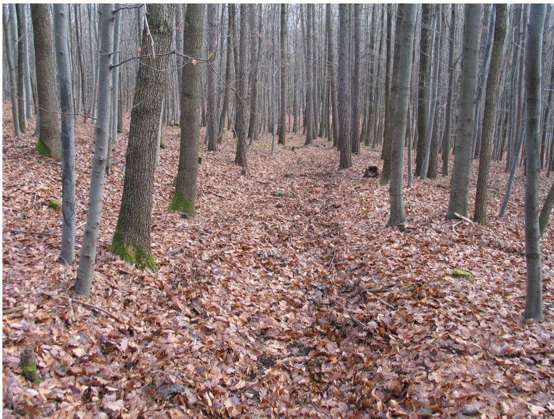
Foto 10 Pokrývku listí bylo mnohdy potřeba rozhrabat, lokalita Bb. (Opravil T., prosinec 2015)