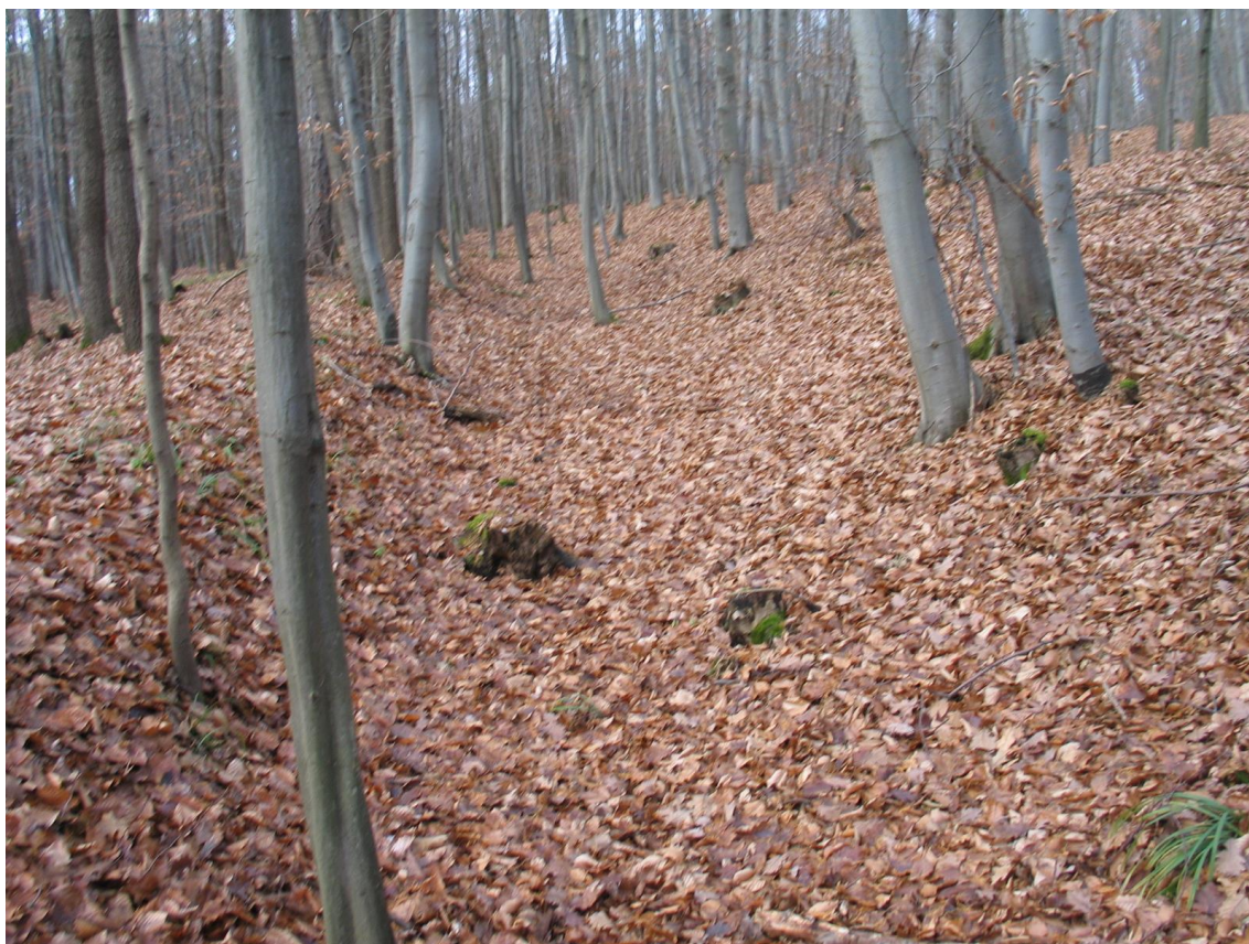
Foto 9 Hluboký úvoz západně od komunikace, lokalita Bb. (Opravil T., prosinec 2015)