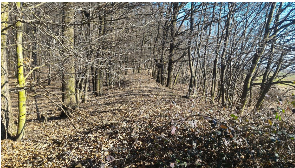
Foto 12 Foceno na vrcholu valu, lokalita C. (Opravil T., leden 2016)