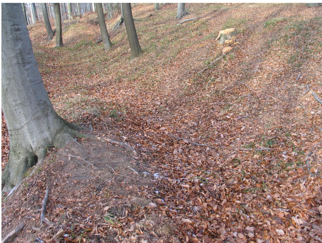
Foto 6 Úvoz nejblíže ke komunikaci, lokalita Ba. (Opravil T., prosinec 2015)