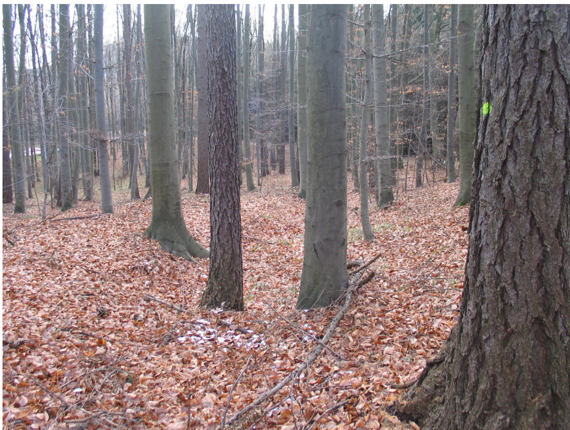
Foto 3 Svazek v lokalitě A – Na křížku, pohled z jednoho z úvozů. (Opravil T., prosinec 2015)