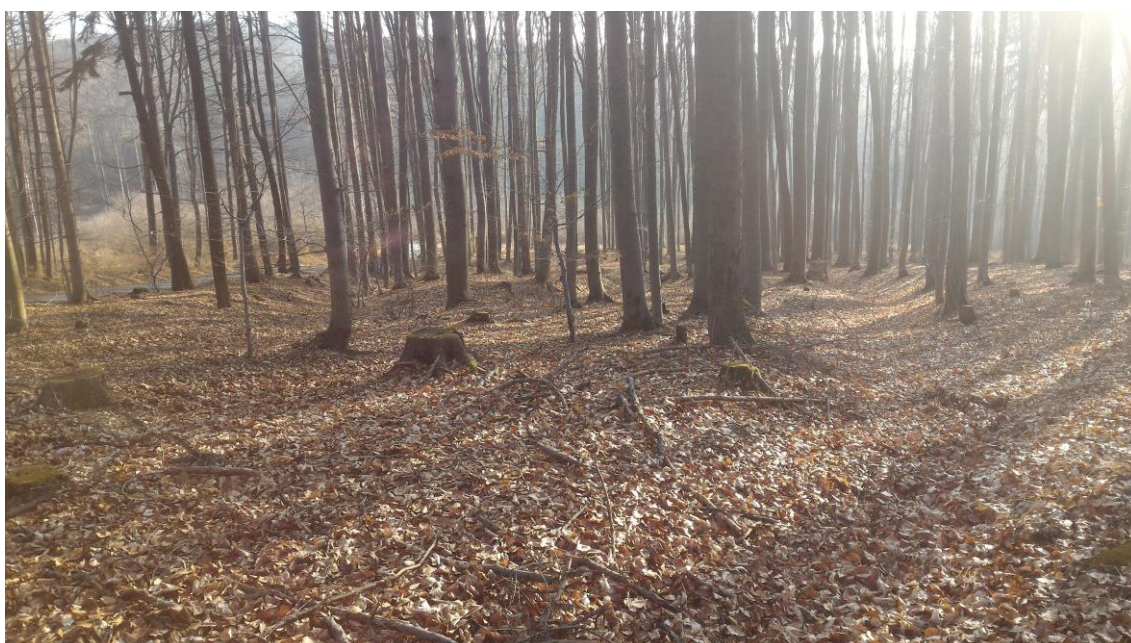
Foto 16 Úvozy jsou v této oblasti mělké, lokalita E. Zdroj: Opravil T., duben 2016