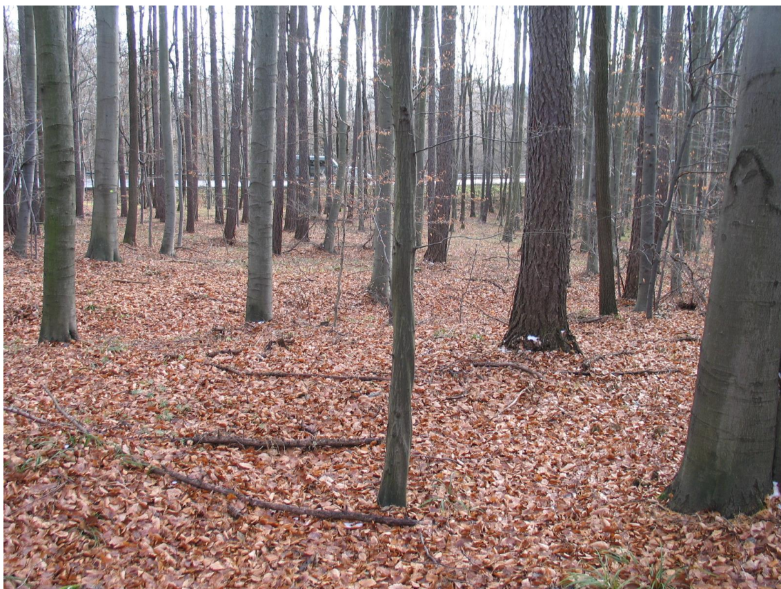
Foto 1 Svazek v lokalitě A – Na křížku, komunikace E50 v pozadí. (Opravil T., prosinec 2015)