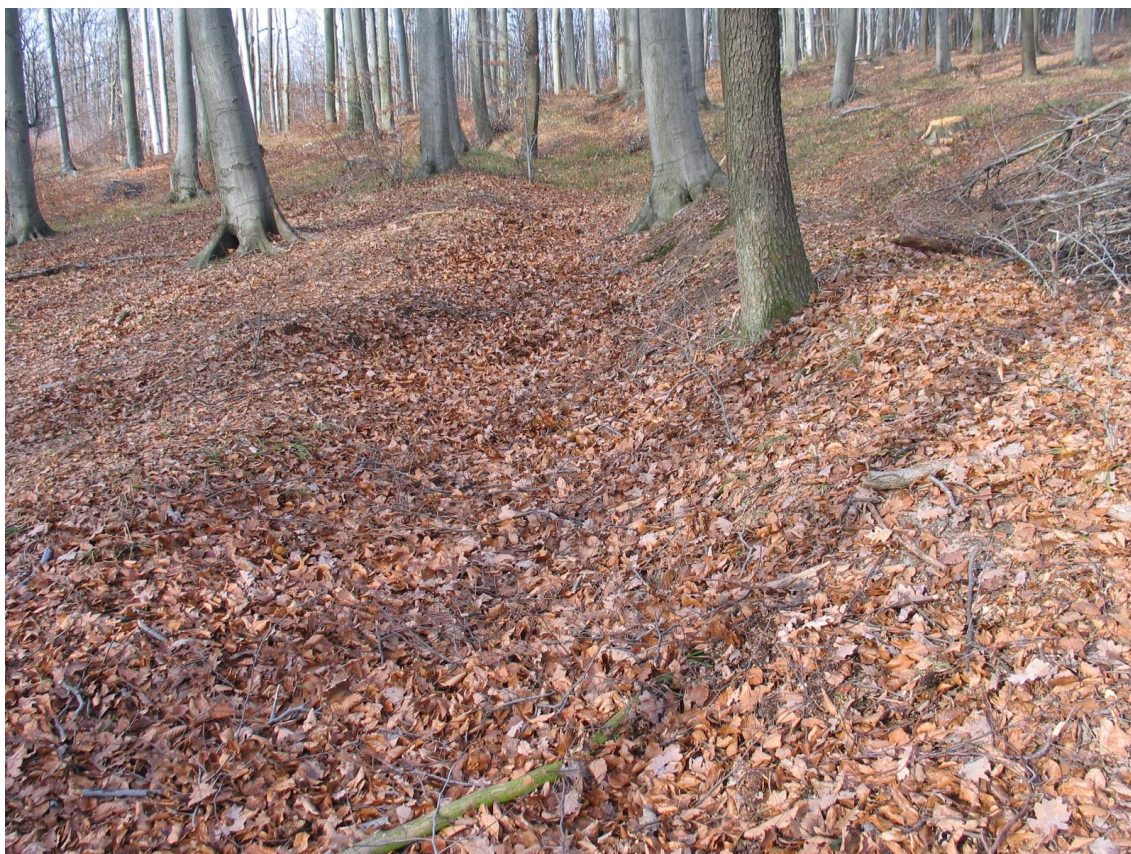
Foto 5 Výrazný úvoz směřující do svahu, z jedné strany zarovnaný s terénem, lokalita Ba. (Opravil T., prosinec 2015)