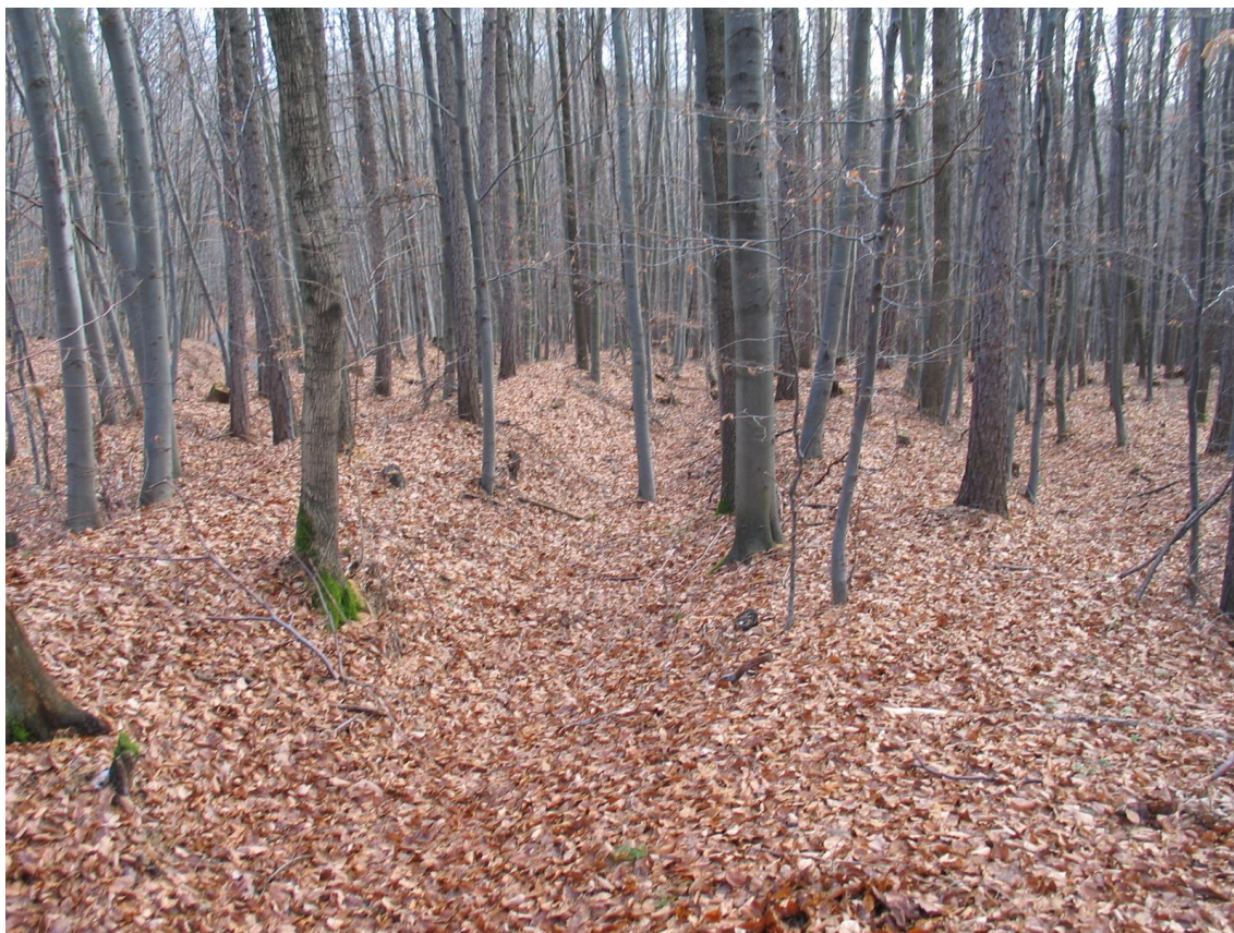
Foto 8 Nejširší část svazu úvozů, lokalita Bb. (Opravil T., prosinec 2015)