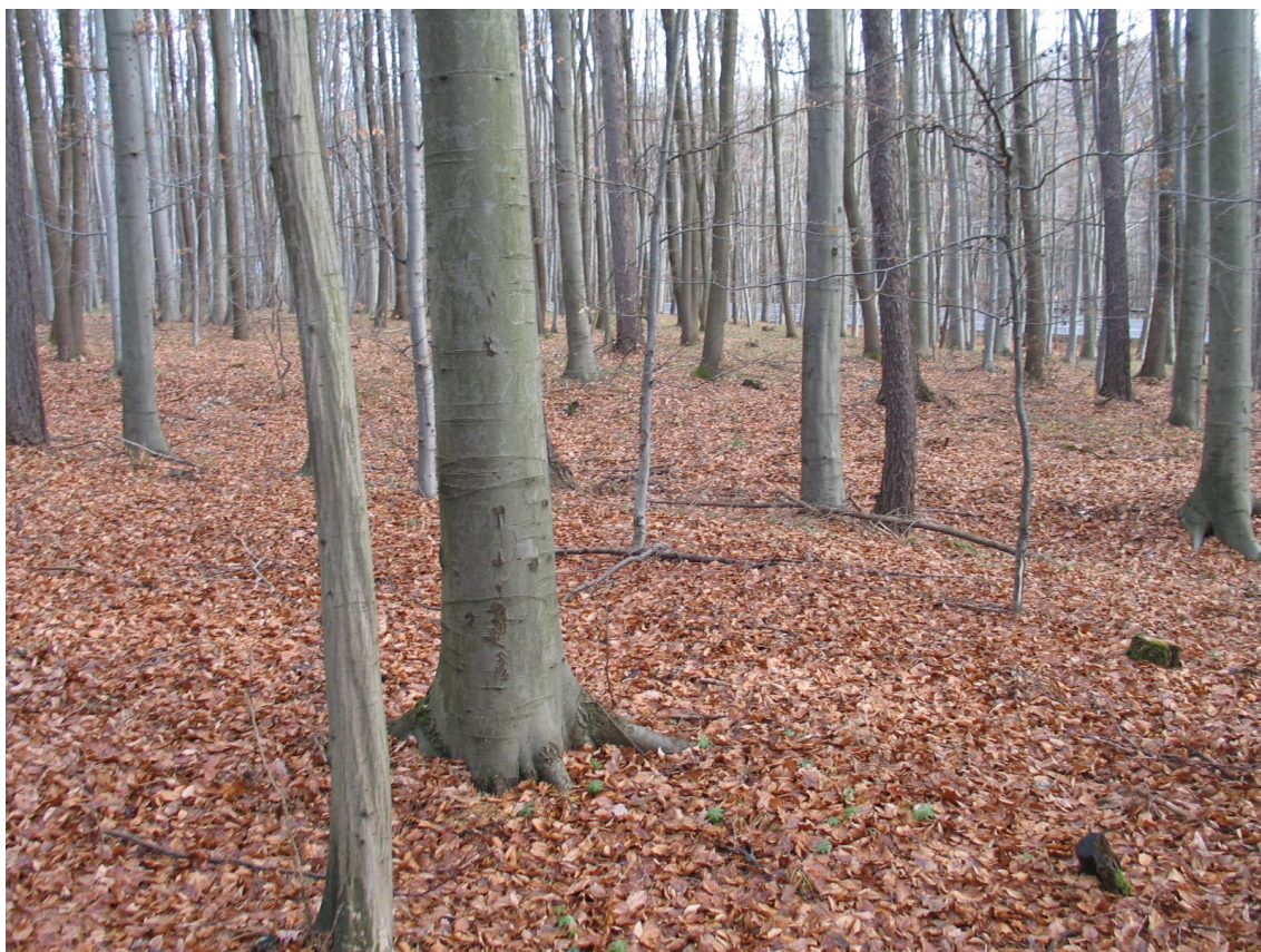
Foto 2 Svazek v lokalitě A – Na křížku. (Opravil T., prosinec 2015)