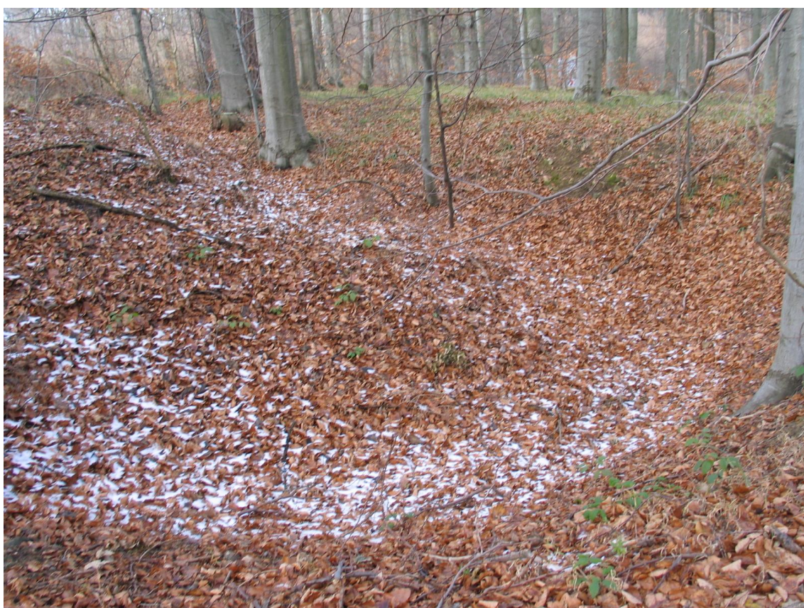
Foto 4 Okrouhlá vyhloubená jáma bez stop vegetace, lokalita A. (Opravil T., prosinec 2015)