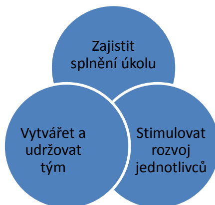
Obr. 1: Základní odpovědnosti manažera 10

Odpovědnost manažera týmu, jak ilustruje Adair je možné rozdělit do následujících tří oblastí života týmu, viz obr. 1.